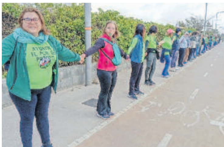
Tram de la cadena, formada per veïns i persones d'altres llocs.

“El nostre objectiu és clar: aturar aquest projecte especulatiu i destructiu”, començava el discurs de cloenda de l'acte. “No volem la destrucció del darrer corredor natural entre el massís del Garraf i el Delta del Llobregat ni cinc mil pisos nous que no responen a les necessitats reals de la població”, reivindicaven des de fa molt temps els veïns i les veïnes que s'oposen al Pla de Ponent. “Volem habitatge digne i assequible de veritat, però sen-