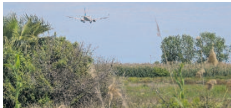
Un avió sobrevola els aiguamolls del delta.

INFRAESTRUCTURES ▶ El Comitè Assessor d'Infraestructures de l'Ajuntament de Barcelona aposta per allargar la tercera pista de l'aeroport "preferentment sense tocar els espais protegits de la Ricarda i el Remolar". Aquesta és una de les conclusions de l'informe elaborat per l'esmentat comitè, que no especifica de quina manera es pot fer.