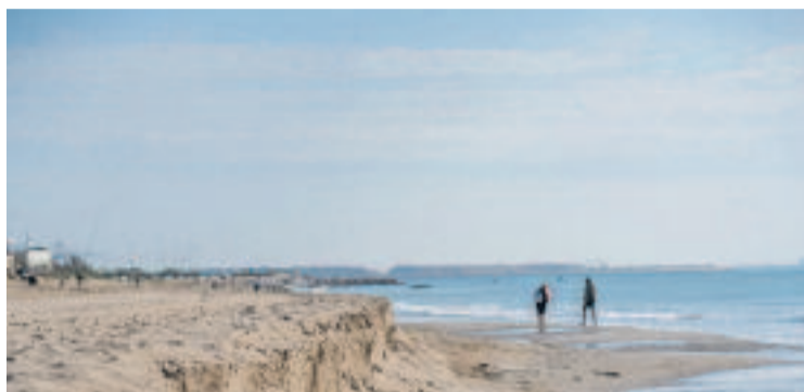
Tram de la platja del Prat afectat pels temporals.