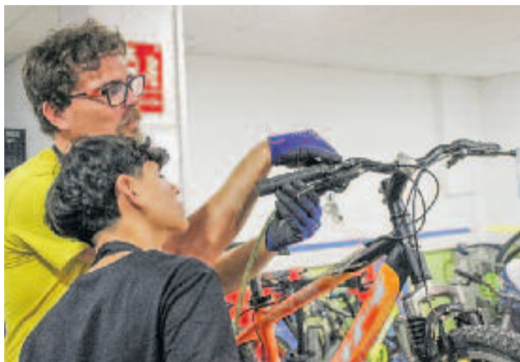
La formació de joves del barri i la ciutat és un eix de l'entitat.

"La fundació ja va néixer amb aquest rol d'incidència en la realitat social local, per visibilitzar les causes de les coses que es podrien fer d'una altra manera i millorar les condicions de vida de la gent del barri", rememora Osiàs, que remarca que, a diferència d'altres entitats que se centren en