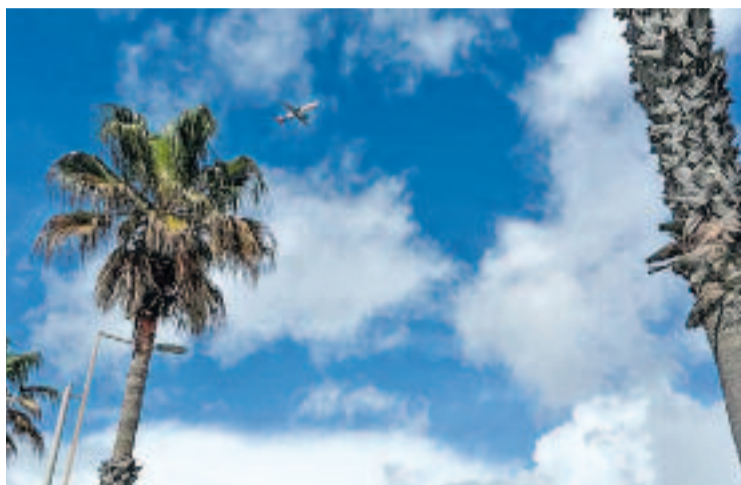
Més d'un centenar d'avions sobrevolen cada dia el municipi.

D'aquesta manera, i tot i no tenir competències directes en el trànsit aeri, la gestió de les infraestructures associades a l'aeroport del Prat i la contaminació acústica i atmosfèrica generada, el consistori vol millorar la qualitat de vida de la ciutadania en aspectes relacionats amb la salut i el benestar. En aquest sentit, demana tenir capacitat sancionadora durant els episodis de