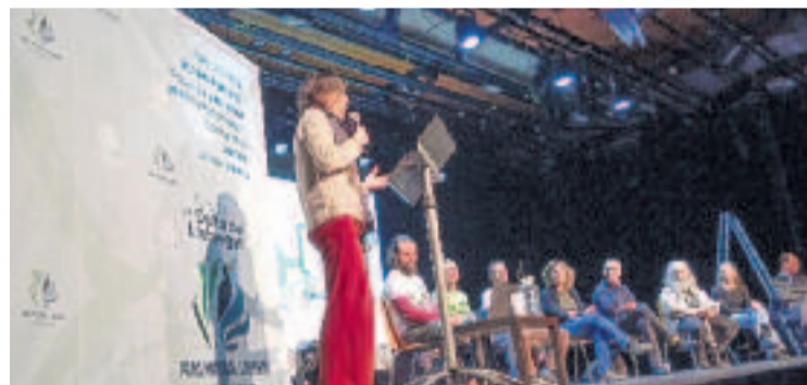
Acte de presentació de la proposta, al teatre Can Massallera.

ECOLOGISME ▶ "És temps de donar resposta agrària i de recordar la importància d'alimentar-nos tot preservant el territori. Per ecologia, per sobirania alimentària i per qualitat de vida. És temps de fer una proposta en positiu, que inclogui no només la societat civil organitzada sinó la pagesia, tants cops oblidada i marginada, però tan necessària".