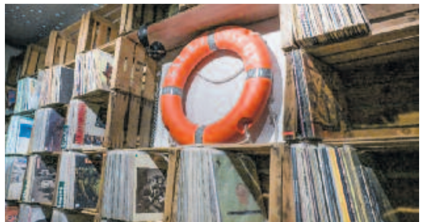
Salvadiscos és al barri barceloní del Poble-sec.

Salvadiscos, amb més d'11.000 socis, és, per tot plegat, un punt de trobada per a amants de la música.