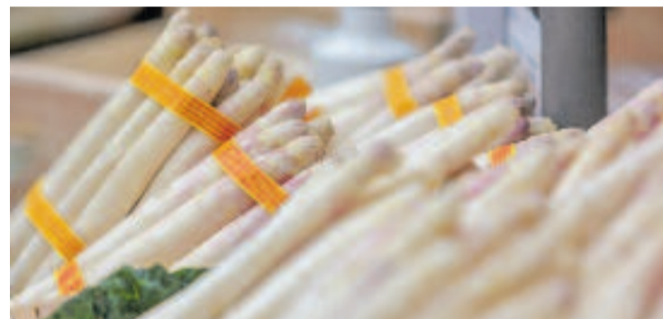
Primer pla dels espàrrecs durant l'edició de la fira del 2024.

FIRES ▶ Miki Núñez, Kiko Veneno i un xef amb una estrella Michelin són alguns dels noms propis de la nova edició de Temps d'Espàrrecs, la mostra anual gastronòmica que inclou la tradicional fira homònima.