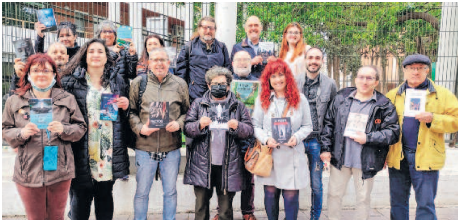
Els autors locals de Gavà de Lletres mostren els seus llibres, que signen a l'estand que l'associació col·loca per Sant Jordi.