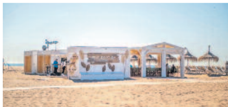
Una de les guinguetes reconegudes.

TURISME ▶ Una quinzena de guinguetes de la platja han obtingut la certificació 'Biosphere', segell impulsat per la Diputació de Barcelona que reconeix les empreses, serveis i destinacions turístiques que mostren un compromís per la sostenibilitat, com l'Oficina de Turisme del Centre o el Gremi d'Hostaleria de Castelldefels i Baix Llobregat, entre altres.