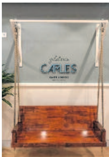
Gelateria Carles.

Entre la vintena d'espais comercials emblemàtics reconeguts fins ara amb la placa hi ha el celler Vallès, la ferreteria Fraile, la carnisseria Paquita o diversos hotels i restaurants, com el Rey Don Jaime o Las Botas.