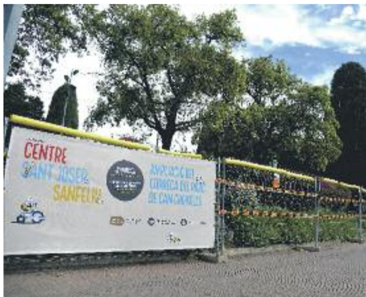
El consistori està fent obres al parc.

Un dels objectius d'aquesta actuació, que tindrà un cost supe-