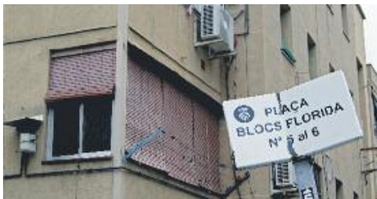
Una imatge d'arxiu dels Blocs del barri de La Florida.

una ludoteca, estarà fet a partir de contenidors marítims reciclats.