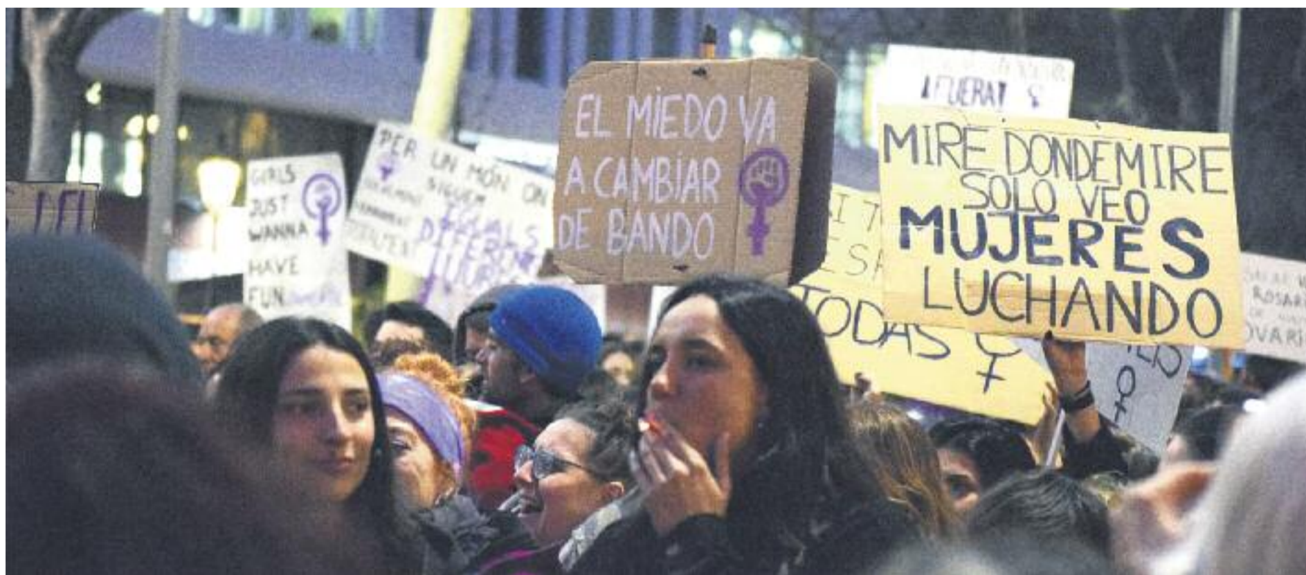
El feminisme es planteja cap on ha de focalitzar el seu missatge després de la polèmica sentència de la Manada.