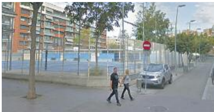
Les pistes i el pàrquing donaran pas a un poliesportiu.