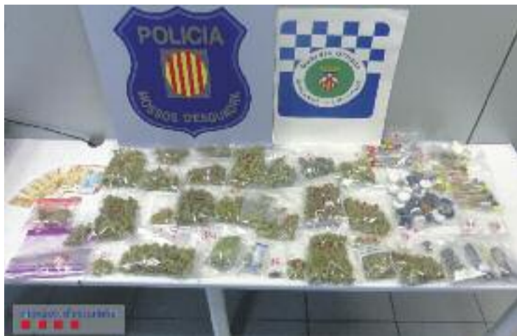
Drogues trobades al club cannàbic de Collblanc.

Davant d'aquests fets, els Mossos d'Esquadra, juntament amb la Guàrdia Urbana de l'Hospitalet, van detenir el president de l'associació i van entrar