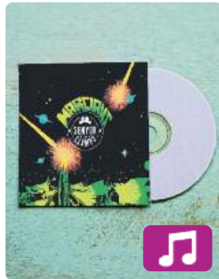
Marcians Senyor dels Llamps

La banda Senyor dels Llamps torna a la càrrega amb un disc ple d'històries fresques, divertides i poc convencionals, explicades amb el seu característic llenguatge sense filtres ple d'humor i d'ironia.