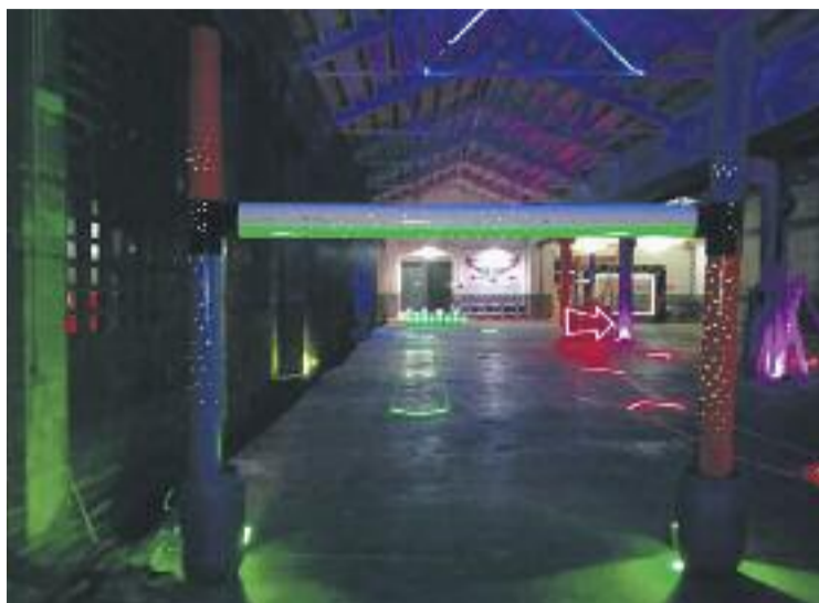
Una imatge d'una de les pistes.

La nau està dividida en dues zones. La més gran ocupa 1.200