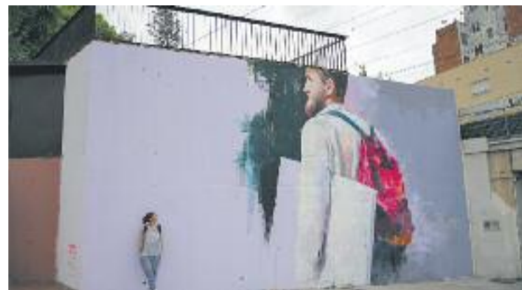
L'obra es diu "Llum i color" i està inspirada en un noi del carrer.

Els dos arrestats van passar a disposició judicial i han quedat en llibertat amb càrrecs.