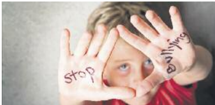
L'app aprofita la tecnologia per combatre el 'bullying'.

Els estudiants es poden descarregar de franc al mòbil l'aplicació, que permet enviar missatges a la persona de contacte que els joves desitgin. Els instituts també poden posar en marxa un xat, una opció que els impulsors recomanen per mantenir una millor comunicació.