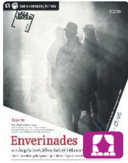
Enverinades Àngels Aymar

Què passaria si els contes tradicionals desapareguessin? A partir d'aquesta reflexió, l'obra Enverinades aporta dades poc conegudes sobre La Ventafocs, la Bella Dorment i la Blancaneus amb l'objectiu de desmitificar aquests personatges a través d'un llenguatge irònic i poètic.