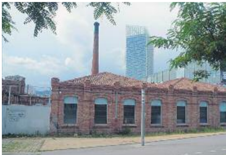
El centre es farà a l'antiga fàbrica Godó i Trias.

Aquest últim punt és un dels més importants, ja que es trac-