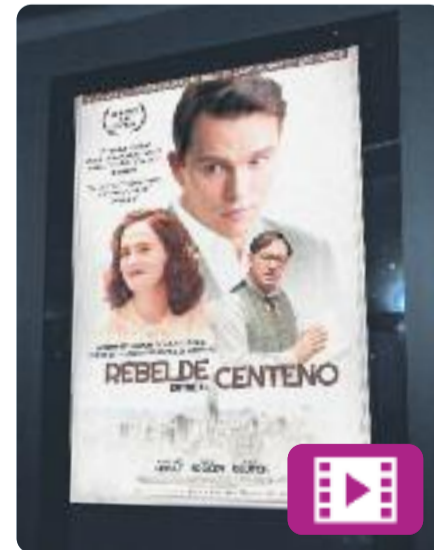
Rebel in the rye Danny Strong

Rebel in the rye explica la vida de l'escriptor nord-americà J.D. Salinger i posa el focus en l'època en la qual va escriure la seva obra més cèlebre, El vigilant del camp de sègol .