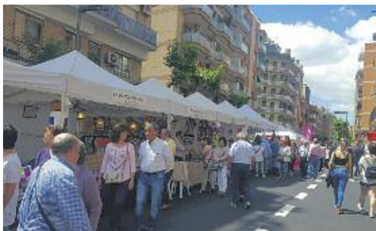
Amb l'arribada de la primavera comencen les fires al carrer.

La comissió de Comerç, Mercats i Restauració de l'àrea de Promoció Econòmica de l'Ajuntament serà l'encarregada de desenvolupar el document que inclourà propostes concretes