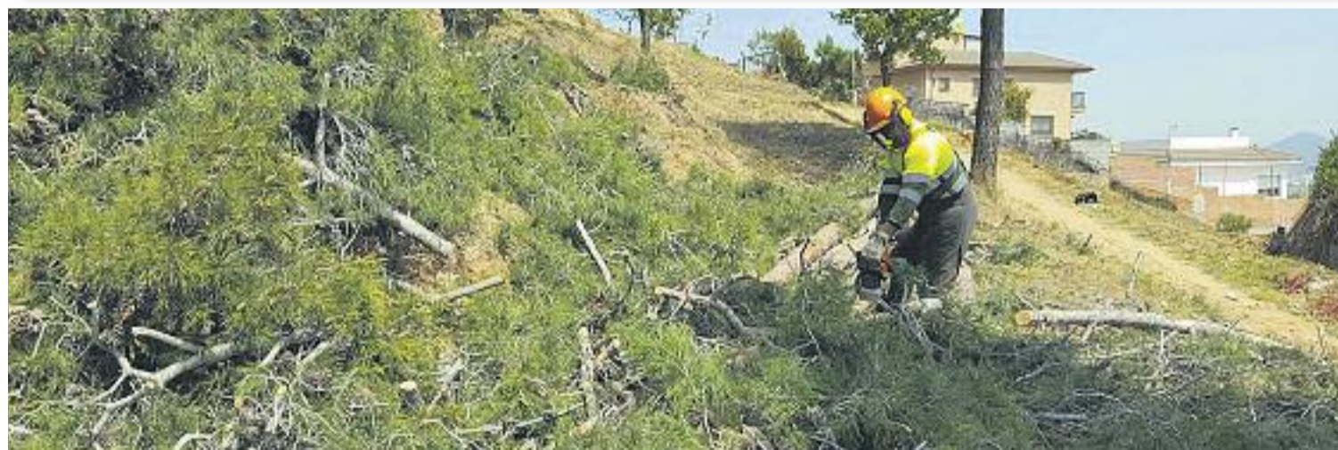
Creació d'una franja de protecció en una urbanització de Cervelló (a sota).

els vials i en la neteja vegetal de les parcel·les interiors. El conjunt d'aquestes accions suposen una millora en la seguretat de persones i béns davant d'incendis forestals i una millora de les condicions de seguretat que tindran els equips d'extinció en cas d'incendi.