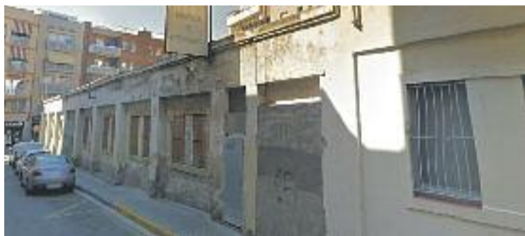
La residència es vol ubicar al carrer Ferran i Clua.

És per aquesta raó que el consistori ha fet un requeriment previ al recurs contenciós-administratiu contra la resolució de la comissió de Territori. Fonts municipals expliquen a Línia l'H que estan a l'espera que la Generalitat accepti totalment o