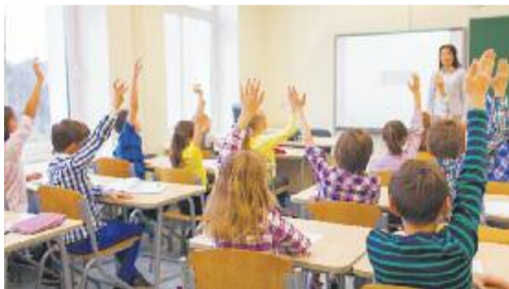
Comença la preinscripció per al pròxim curs.

En concret, al barri hi haurà tres grups més, en concret dos de primària i un a la secundària. Pel que fa a la primària, n'hi haurà un de nou a l'escola Folch i Torres, de segons, i un de tercer a la Puig i Gairalt. En el cas de l'ESO, el Rubió i Ors compartirà amb un grup nou de primer curs de l'ESO.