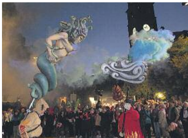
El toc d'inici tindrà lloc el dia 19 a la plaça de l'Ajuntament.

Per últim, als jardins de Can Sumarro hi haurà propostes de