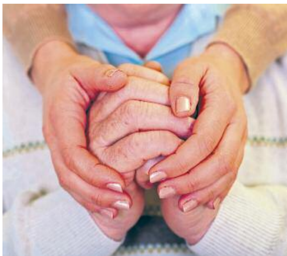
L'Alzheimer serà, segons els experts, una epidèmia en els pròxims anys.