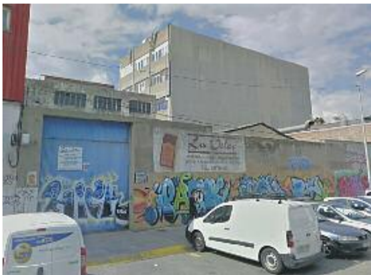
El local que ha comprat el consistori per 700.000 euros.