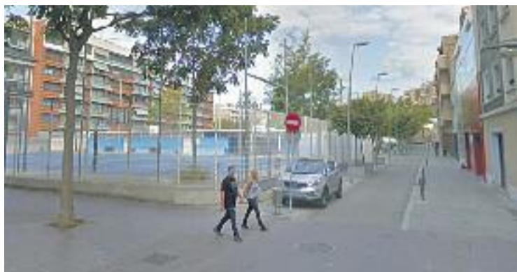
Les pistes i el pàrquing donaran pas a un poliesportiu.

A la planta baixa s'ubicarà l'entrada, recepció i vestíbul –que donaran a la cantonada del carrer del Gasòmetre