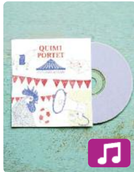
Festa major d'hivern Quimi Portet

El nou disc de Quimi Portet és un recull de tretze cançons que sublimen la barreja de sensibilitat i ironia que l'ha convertit en un referent inqüestionable per a joves i grans.