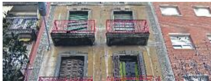
Ja hi ha hagut queixes veïnals pels pisos turístics a alguns barris.

HABITATGE ▶ L'Ajuntament regularà els pisos turístics. Així es va aprovar en el Ple de març, en el qual es va modificar el Pla General Metropolità (MPGM) per regular aquest tipus d'habitatges. Malgrat que només representen un 0,3% del total de pisos de la ciutat, des de fa més d'un any s'han multiplicat les queixes per part de veïns, relacionades amb l'incivisme d'alguns dels seus inquilins i l'augment dels preus del lloguer al qual han col·laborat.