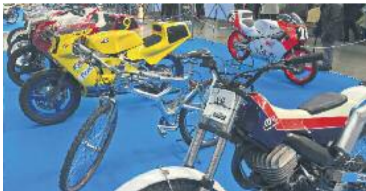
El Retromoto va tenir lloc del 9 a l'11 de febrer.

L'exposició sobre Harry Potter, Star Wars o la mesa rodona amb actors com Alberto Amman –Pacho Herrera a Narcos– o Berto Romero, van completar