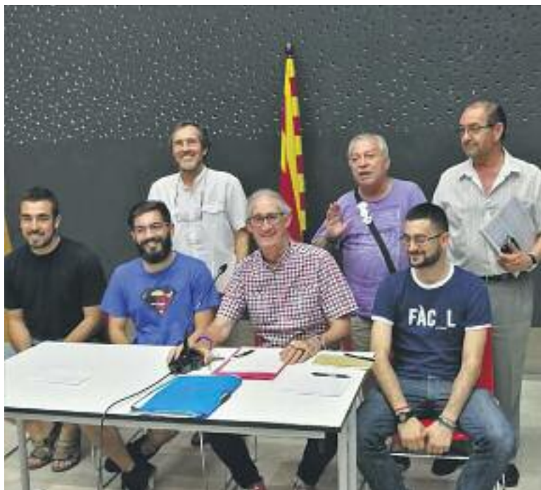
L'AVV 5 Carrers de Santa Eulàlia es va renovar fa uns mesos (esquerra), mentre que la de la Florida (dreta) ha renascut.