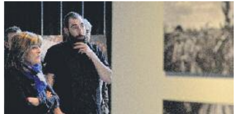
Brabo durant la presentació de l'exposició.

La mostra fotogràfica estarà disponible fins al pròxim 25 de març a la sala polivalent del Mercat de la Florida.