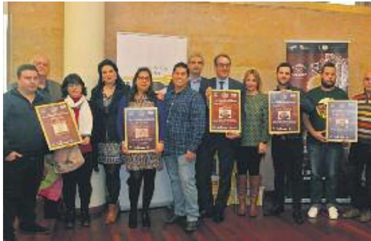
Els responsables dels restaurants i bars premiats.

A la gala d'entrega es van lliurar premis a cinc veïns i veï-