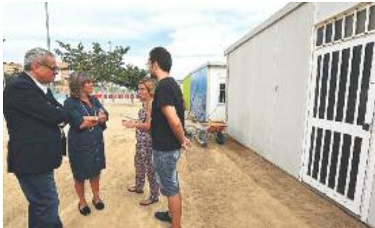
L'escola podria dir adéu als barracons el curs vinent.

Aquesta decisió s'inclou en un paquet de mesures emmarcades en el desplegament de l'acord marc del 2016 de col·laboració entre les dues administracions, ba-