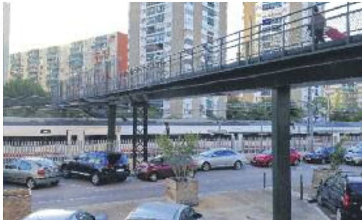
El primer tram de vies que soterrarien, els de la línia de Vilanova.

Dimarts dia 20 el ministre donarà més detalls sobre el projecte amb el qual treballa Foment, i que, tal com es va explicar l'any passat, prioritzaria el soterrament de les vies que esquinquen Bellvitge i el Gornal i la construcció de l'intercanviador de la Torrossa, el qual serà la principal entrada a Barcelona pel sud i descarregarà de feina l'estació de Sants. En principi també estaria previst el cobriment de les vies de la línia de Vilafranca –que separen la ciutat de