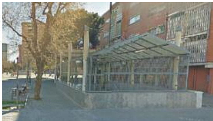
Els ascensors de l'estació de Renfe se segueixen fent esperar.