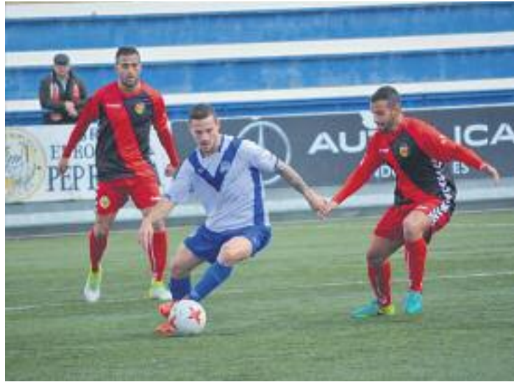
Un moment del partit que l'equip va guanyar al Nou Sardenya.

I és que el 2018 que està protagonitzant l'equip és pràcticament immaculat; amb més o menys brillantor, els de Molist han anat resolent favorablement gairebé tots els enfrontaments del començament de la segona volta, alguns dels quals han estat partits duríssims contra altres candidats a la promoció, com el Terrassa (0-1) o l'Europa (1-2). L'únic partit contra rivals de la