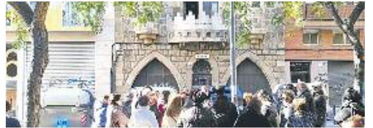
La ruta davant del Castell de la Pepa.

Tot plegat, està prevista una inversió global d'1,45 milions d'euros per a les obres de millora, dels quals 280.000 sortiran de les arques municipals.