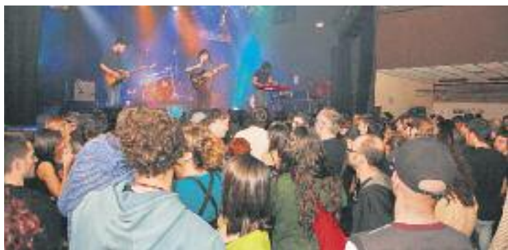
La Casa de la Música ajuda a fer emergir el talent musical.