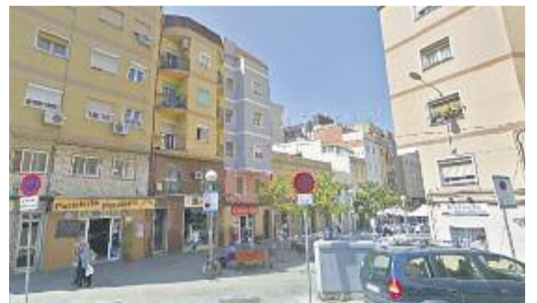
Els diners tenen a veure amb projectes al barri.

El 2015 l'Ajuntament va formular un requeriment a la Generalitat perquè abonés la quantitat que quedava pendent de programar en els comptes. Aquesta és la segona sentència favorable per a l'Ajuntament en pocs dies, després que el mateix tribunal donés la raó al consistori pel deute de les escoles bressol.