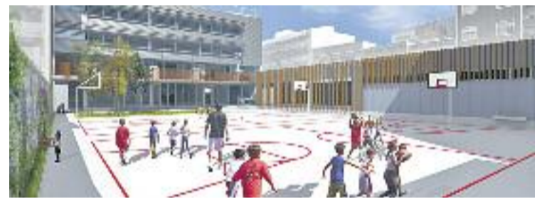
L'edifici que allotjarà l'escola Ernest Lluch. Foto: Sumo Arquitectes

El projecte de nou edifici –al qual la Generalitat destinarà 3,7 milions d'euros– està entrant en la seva fase final, després d'anys d'estira-i-arroses i mobilitzacions constants. Però l'horitzó final encara es veu molt lluny. Ja no només per les informacions d'Ensenyament, des d'on no s'aventuren a fer previsions, sinó també des del mateix estudi d'arquitectes. I és que a la fitxa de la nova escola que ofereixen al seu web xifren en un 1% el desenvolupament del projecte a hores d'ara.