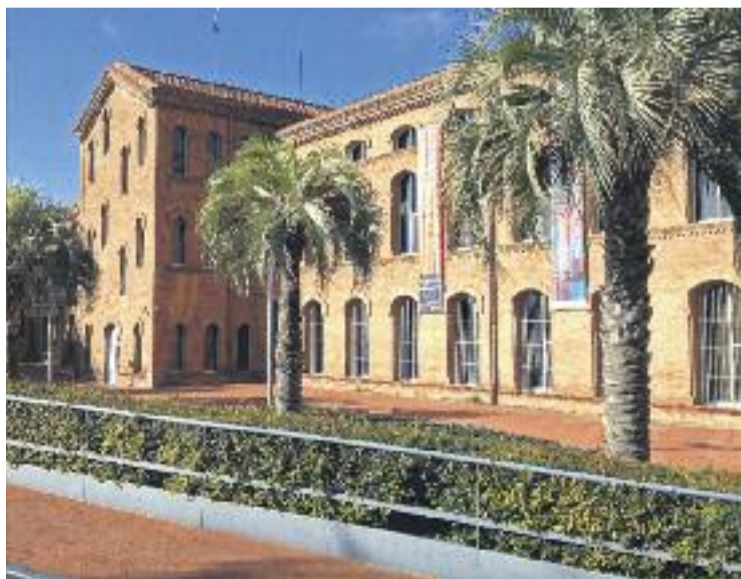
L'edifici acull actualment diversos equipaments culturals.

Ara, el Centre d'Estudis de l'Hospitalet i l'Ajuntament —a través del servei de Biblioteques i amb la col·laboració del Museu— estan recopilant testimonis de persones que van treballar-hi. "El teu testimoni, la teva experiència, formen part de la història de la ciutat. Ens agradaria conèixer-los", és el lema d'una iniciativa emmarcada en