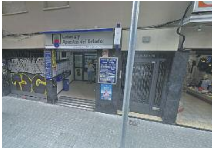
La butlleta la va validar La Herradura, al carrer Progrés.

La dona va anar a l'administració de loteria l'endemà del sorteig a comprovar si havia guanyat algun premi i va descobrir que havia estat l'única encertant de primera categoria. El responsable va ser qui li va comunicar la consecució del premi.