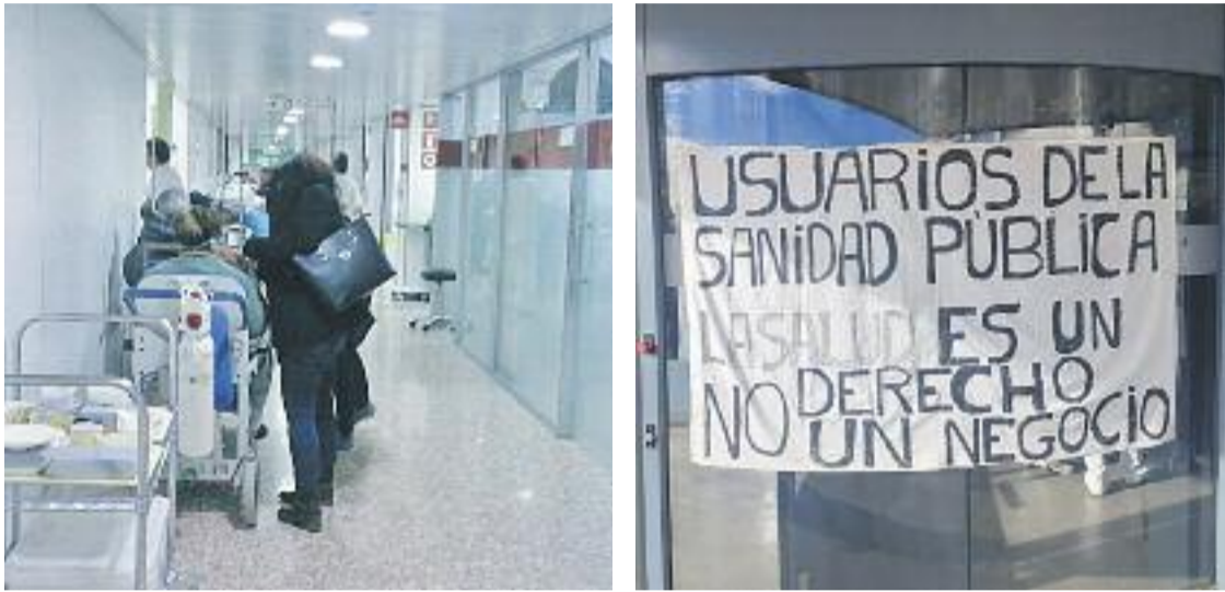
Alguns pacients han hagut d'esperar en llits instal·lats als passadissos de Bellvitge.

» Professionals i pacients denuncien “col·lapse” als centres mèdics » Veïns i partits reclamen “més recursos” i una millor previsió