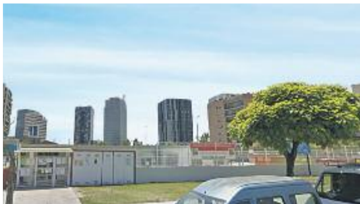
L'escola funciona en barracons des de fa set anys.

Des del departament descarten donar dates i terminis d'execució de les obres, però la comunitat educativa de la Candell urgeix per deixar de fer classe a barracons i estrenar el nou centre. Així ho expressa l'Associació de Familiars d'Alumnes de l'escola (AFA) en un article