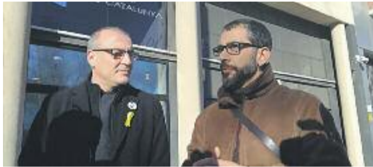
El moment d'entrada de la denúncia a Antifrau.