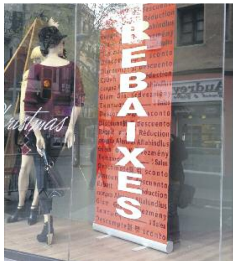
La campanya de rebaixes s'allargarà fins al març.