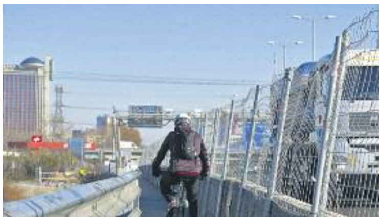
Situació del pas a dia 10 de gener.

Segons informa l'entitat, el projecte preveu adequar-hi una plataforma annexa al pont actual que sobresortirà 2,2 metres i que permetrà fer un carril bici i un espai per als vianants de 3 metres d'amplada i 200 metres de longitud. Es tracta d'una intervenció que la Saboga ha anat perseguint des de fa anys, ja que considera que l'actual pas "és molt precari". Tot i que estan satisfets amb el projecte, no descarten reivindicar en un futur que es redistribueixin els carrils del pont per ampliar la zona de bicicletes i vianants. De fet, l'Associació Catalunya