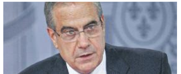
Corbacho va ser alcalde de la ciutat del 1994 al 2008.

POLÍTICA ▶ L'exalcalde Celestino Corbacho ha deixat de militar al PSC perquè no se sent suficientment valorat i per haver quedat apartat de les responsabilitats polítiques de la formació, tal com va avançar La Vanguardia. Així ho va fer saber al primer secretari dels socialistes catalans, Miquel Iceta, en una carta enviada el passat divendres dia 12, segons ha explicat el secretari d'organització del PSC, Salvador Illa.