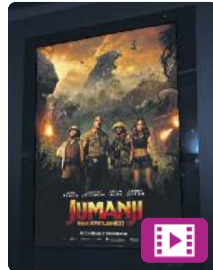
Jumanji: Benvinguts a la jungla

Rentat de cara a un dels clàssics del cinema d'aventures de finals del segle passat. A Jumanji: Benvinguts a la jungla , quatre joves amics són absorbits per un videojoc i es converteixen en personatges amb habilitats úniques.