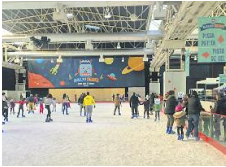
L'espai va estar obert fins al 7 de gener.

L'organització s'ha mostrat satisfeta per la xifra de visitants, els quals van poder gaudir de tres grans espais diferenciats: el Kaliu Gel –la pista en si mateixa–, el Kaliu Creatiu i el Kaliu Lúdic. En general, les activitats van estar adreçades als més petits de la casa, amb activitats de lleure relacionades amb Nadal i d'esportives. En aquest sentit, va tenir "força èxit" el Kaliu Creatiu, obert a propostes d'entitats de la ciutat com Per Amor a L'Hart, que va fer cada dia una representació