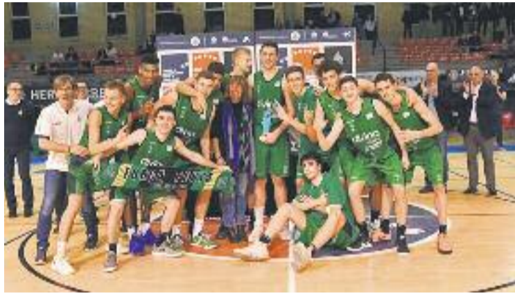
Els verd-i-negres celebren la seva victòria.

Els amfitrions, el CB l'Hospitalet de Marc Solanes, no van poder guanyar cap dels tres partits de la primera fase (estaven en un grup duríssim, amb els campions, la Virtus de Bolonya i l'Herbalife Gran Canària), però van tancar el campionat amb