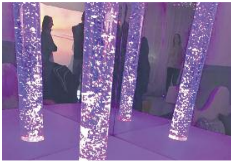
L'aula està equipada per estimular els sentits dels més petits.

Des del consistori expliquen que inclou les aules multi-