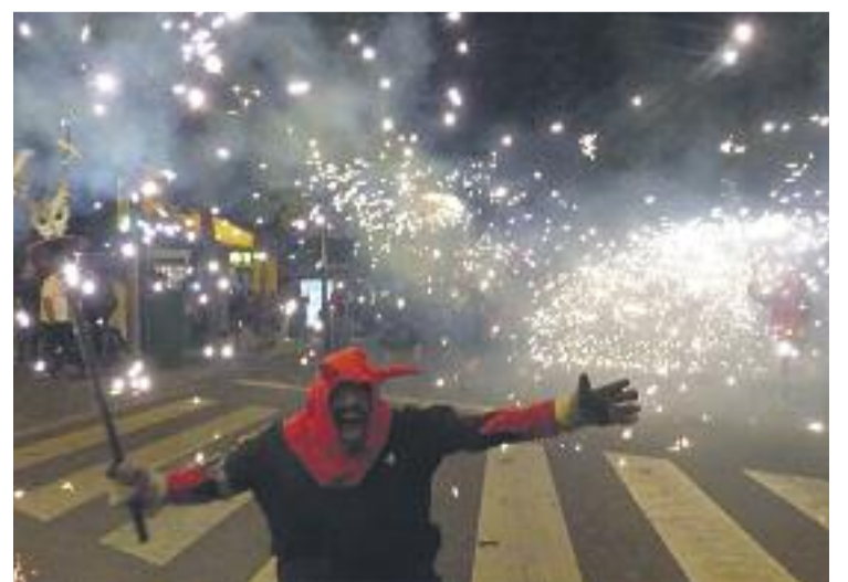
La colla és tot un clàssic de les festes de la ciutat.

Aquesta colla de diables i tabalers arrelada a Santa Eulàlia va néixer el 1987 i des d'aleshores és un clàssic del foc i les festes populars –com ara el dia de la Flama, entre altres, que se celebra al començament de l'estiu– i dels barris de l'Hospitalet i altres municipis propers.