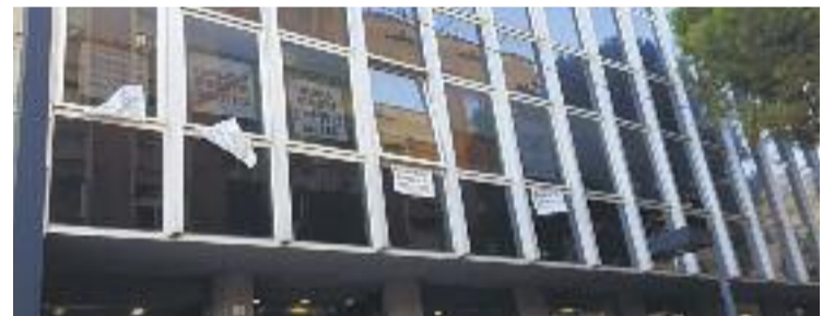
Els cartells continuen psenjats.

POLÈMICA ▶ Els grups municipals d'ERC, CUP i PDeCAT han emès un comunicat mostrant el seu "total desacord i enuig" amb l'expedient sancionador que ha obert la Guàrdia Urbana i l'equip de govern local contra ells per penjar cartells a les finestres dels seus despatxos municipals demanant la llibertat dels consellers. Les pancartes són visibles des de la part posterior del consistori.