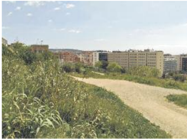
El camp ocuparà uns terrenys sense un ús definit.

Per accedir al camp es construirà un ascensor que hi facilitarà l'accés des del carrer de l'Albereda, a més de construir