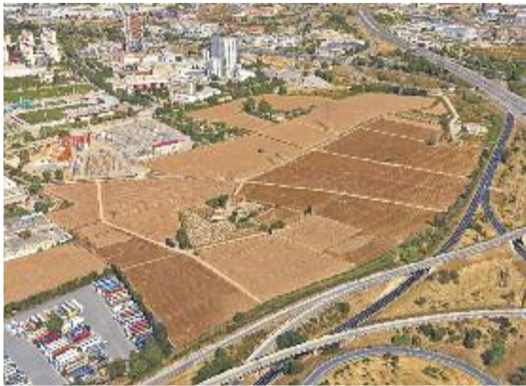
El Pla de la Gran Via ha centrat el debat polític local darrerament.

No Més Blocs reitera les seves crítiques al govern municipal per "falta de diàleg" i assegura que ara mateix no hi ha "consens popular i polític" al respecte. En aquesta línia, també recorda que