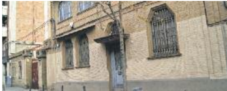
Aquesta antiga fàbrica tèxtil està datada dels anys 20.