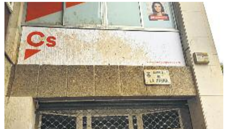
Així va quedar la seu del partit taronja.

L'últim atac que havia patit la seu del partit taronja datava del desembre de l'any passat, mentre que mesos abans el mateix García va ser víctima d'una bufetada en una carpa informativa de Cs a la Florida.