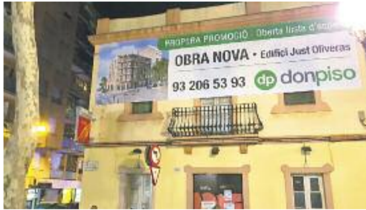
El mític bar va tancar les seves portes fa tres anys.