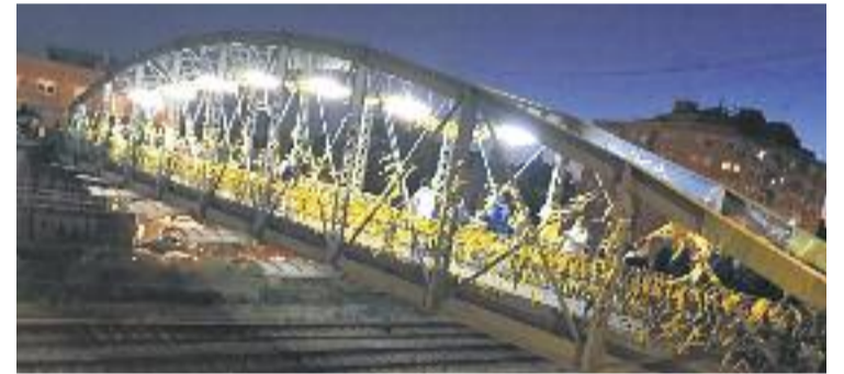
El pont es va omplir de groc.

Les brigades municipals, tanmateix, van retirar els llaços un dia després a molts dels punts on s'havien col·locat.