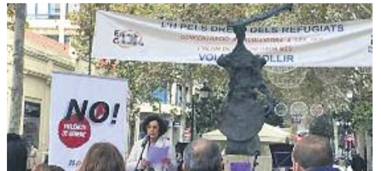
Acte de commemoració del 25N a l'Acollidora.

IGUALTAT ▶ Segons dades municipals, el Programa Municipal per a la Dona (PMD) ha atès enguany, de forma individualitzada, 890 dones, de les quals 319 havien estat víctimes d'algun tipus de violència. El nombre total de visites i entrevistes ha estat de 3.438. Pel que fa a l'atenció col·lectiva, s'han dut a terme un total de cinc grups per a dones que han patit violència i relacions abusives.