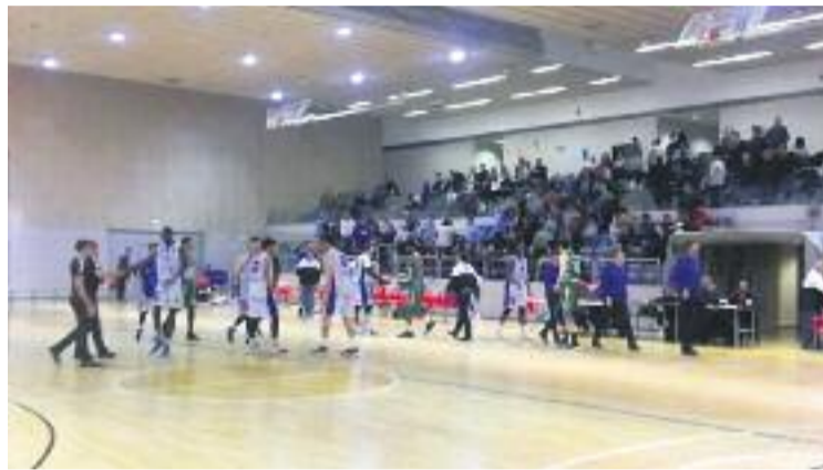
Els blancs viuen el moment més dolç dels últims temps.

El conjunt blanc, però, encara haurà d'enfrontar tres partits més abans que s'acabi l'any ja que, contràriament al que passa en moltes altres categories i esports, la LEB Plata no s'atura per Nadal. D'aquesta manera, els homes de Tarragona hauran de viatjar a Madrid el pròxim dissabte 16, clouran l'any natural