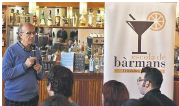
De las Muelas durant la seva intervenció.

Aquest ha estat el segon any que l'Ajuntament ha posat en marxa aquest programa relacionat amb l'Escola d'Hostaleria que vol fomentar l'ocupació dels joves en aquest àmbit.