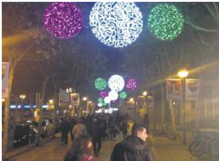
Els llums de Nadal es van encendre el 24 de novembre.

En aquest sentit, a partir del 13 de desembre i fins al 7 de gener la rambla Marina, entre Prat de la Riba i l'avinguda Carrilet, acollirà la ja tradicional Fira de