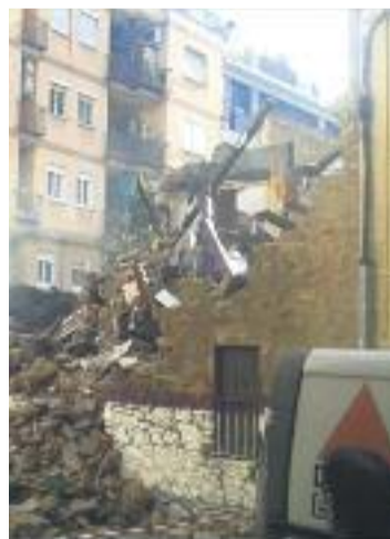
L'abans i el després de la masia.

exemple més de la "poca sensibilitat" de les administracions envers el patrimoni.