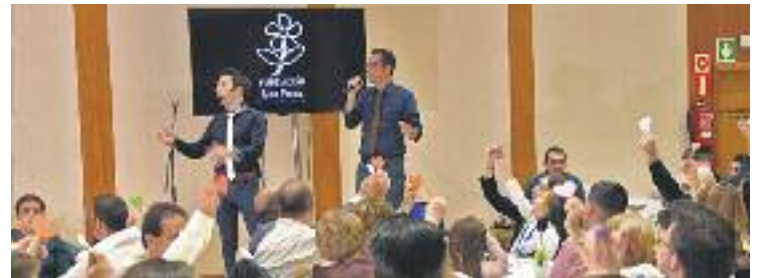
La gala es va celebrar el dia 4.

2,2 MILIONS PER A L'IDIBELL Per altra banda, a principis de mes es van lliurar les ajudes per a la recerca sobre l'ictus i les lesions cerebrals i medul·lars de la Marató de l'any passat, un total d'11,3 milions d'euros. Els sis projectes d'investigació finançats per col·laboren investigadors de l'IDIBELL han rebut 2,2 milions.