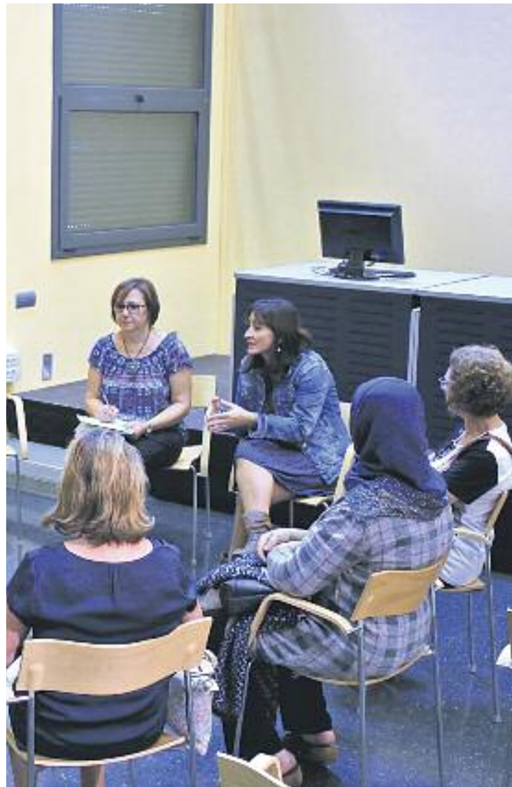
La Diputació desenvolupa diversos programes per a les persones dependents i els seus cuidadors.

CURES ► Reduir la càrrega emocional i també física de les persones cuidadores que tenen a càrrec seues persones en situació de dependència. Aquest és l'objectiu del Programa Grups de Suport Emocional i Ajuda Mútua o el servei Respir de residències temporals, desenvolupats per la Diputació de Barcelona.