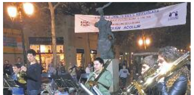
Actuació musical a la cloenda a l'Acollidora.

SOLIDARITAT ▶ L'Hospitalet es va bolcar amb la problemàtica dels refugiats del 23 al 30 d'octubre en el marc de la quarta Setmana de la Solidaritat, un esdeveniment que, per primer cop, no va recollir ni aliments ni diners, sinó que va centrar els seus actes en la sensibilització dels ciutadans envers una qüestió que afecta 65 milions de persones.