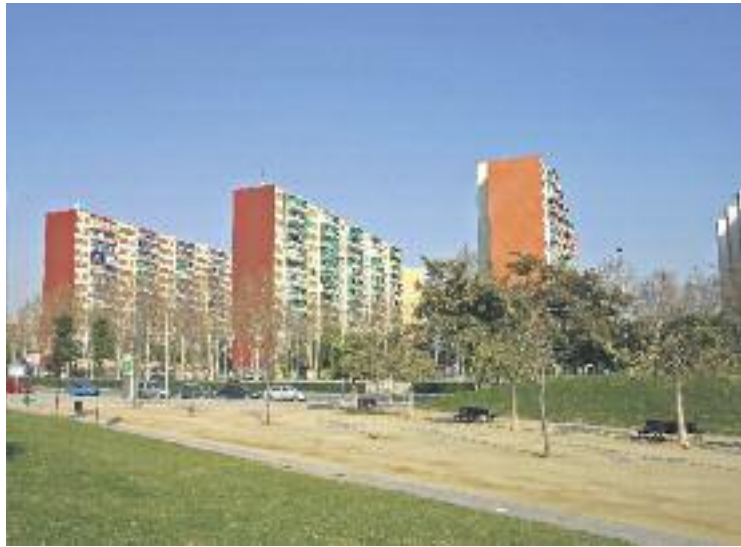
Bellvitge va arribar recentment als 50 anys.

La mostra estava comissariada per Universitat Sense