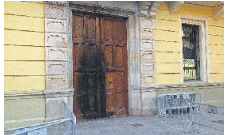
La porta data del segle XIX i és patrimoni arquitectònic.