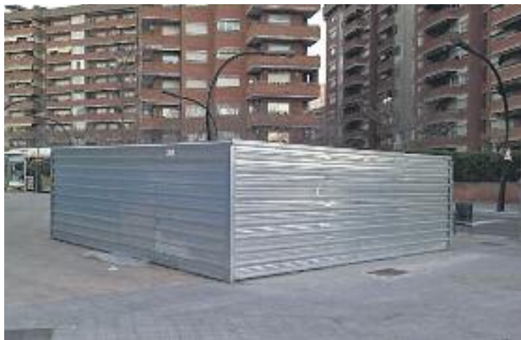
Les obres d'infraestructura estan enllestides des de fa cinc anys.

La parada disposarà de tres nivells: carrer, vestíbul i andanes. El vestíbul se situa al costat del Trambaix –tindrà correspondència amb les línies T1, T2 i T3–. Amb aquesta nova estació –i les altres dues projectades a Provençana i Ildefons Cerdà–,