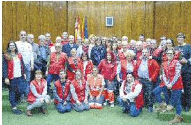
Els 18 voluntaris hospitalencs homenajats.