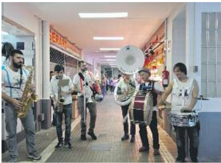
Banda de música amenitzant el matí de dissabte 4 al Centre.

Per altra banda, diverses parades de mercats de la ciutat van sortir al carrer el passat dissabte 11 de novembre, en concret a la plaça del Mercat de Collblanc, durant una jornada festiva, lú-