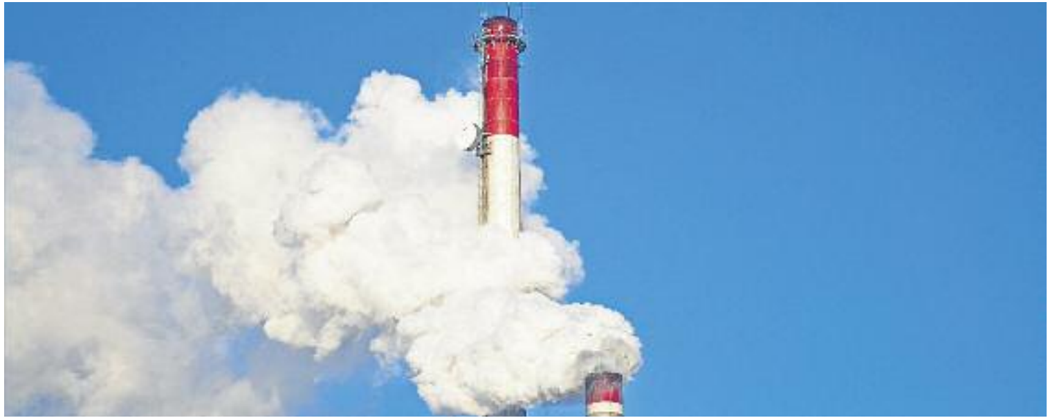
Cada any s'emeten 700.000 tones de diòxid de carboni (CO2) a l'Hospitalet.

En aquest sentit, el govern de l'Hospitalet ha posat en marxa un procés per assolir l'any que ve el Pacte local sobre el canvi climàtic (PLCC), "el primer d'aquestes característiques impulsat per una ciutat espanyola", assegura el consistori en un comunicat.