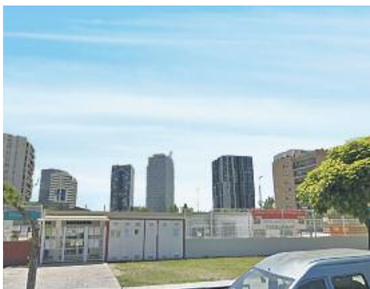
L'escola funciona amb barracons des de fa set anys.

El solar on hi ha ara els barracons és de propietat municipal. L'Ajuntament el va posar a disposició del departament d'Ensenyament el novembre del 2010 per tal que es poguessin instal·lar els mòduls i acollir de manera