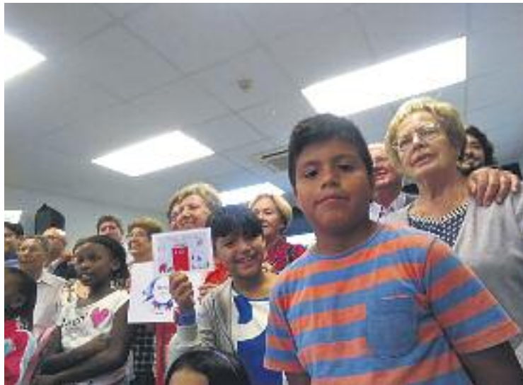
Alguns dels protagonistes del projecte.

El projecte va ser presentat a la Bòbila el 27 d'octubre, en un acte que va comptar amb la presència del regidor d'Innovació