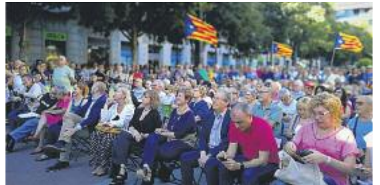
L'acte va tenir lloc davant de l'edifici de l'Ajuntament.