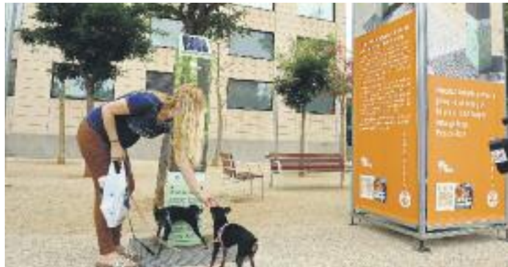
L' e-can premia als gossos que orinin a sobre.

L' e-can incorpora un sistema informàtic que gestiona el funcionament de l'equip, la neteja i la càrrega de bateries i enregistra l'ús que se'n fa. Funciona amb una placa fotovoltaica que