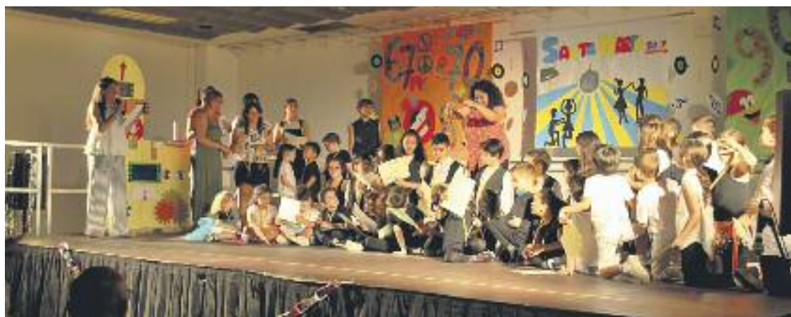
La graduació va fer una repassada a la història de l'escola.