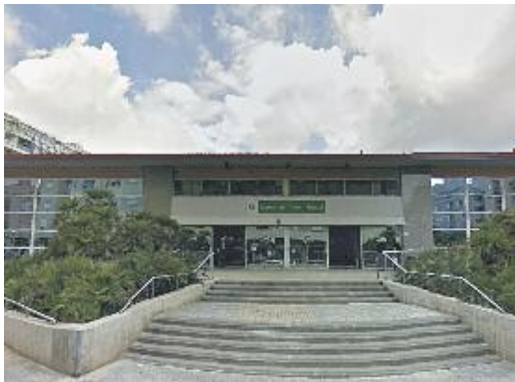
El mercat va ser inaugurat el 1969.