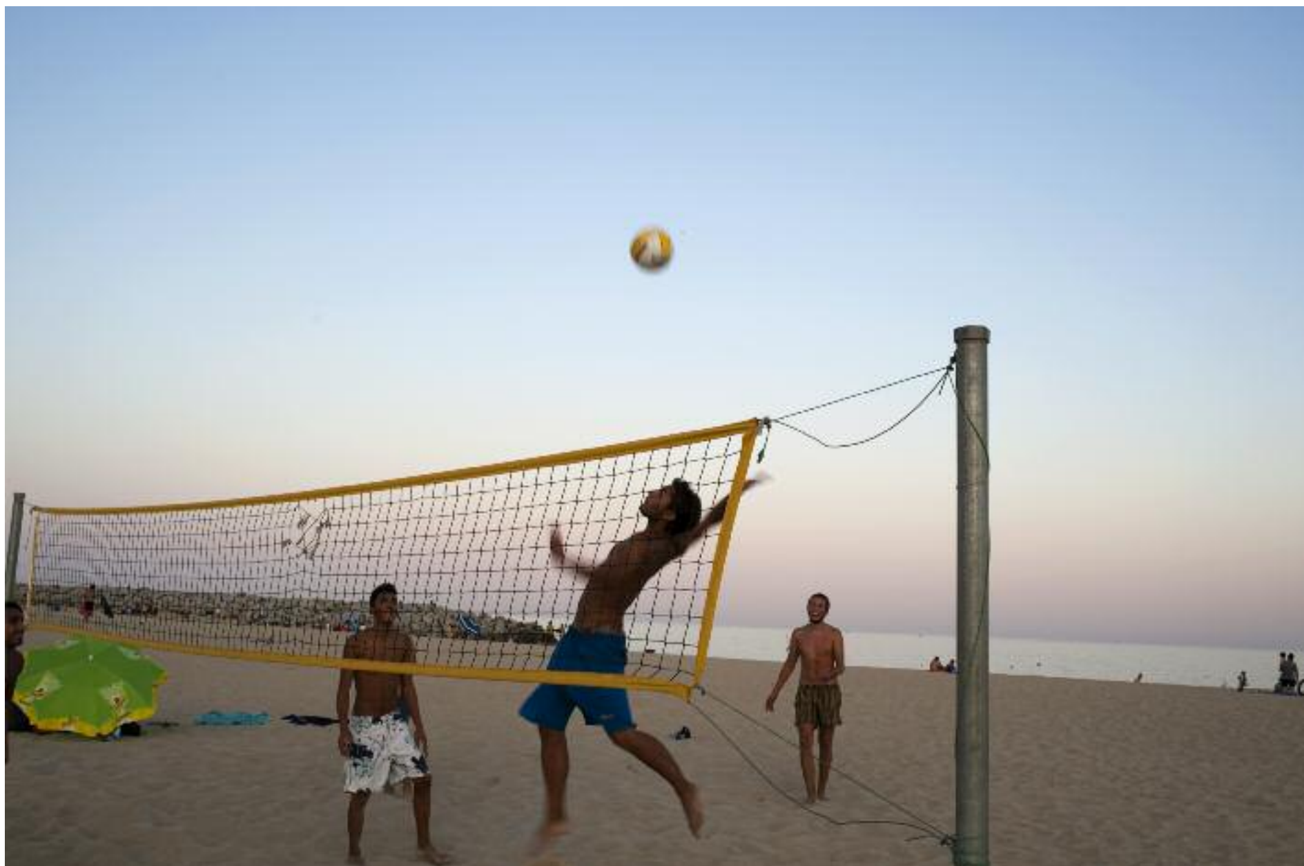
La Diputació dedica 830.000 euros a garantir la qualitat i la seguretat de les platges.

► La Diputació de Barcelona ha portat a terme l'innovador 'Estudi de reputació online de les platges de la demarcació de Barcelona 2016', el qual reflecteix, amb un índex de 8,47 sobre 10, l'elevada satisfacció respecte de "l'experiència platja". Això vol dir que els usuaris de la xarxa han posat un notable alt a les platges dels municipis del litoral barceloní, que com cada any reben el suport de la Diputació de Barcelona per garantir-ne la seguretat i la salubritat.