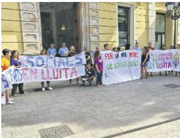
Protesta del col·lectiu a la plaça de l'Ajuntament.