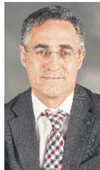
si la seva prosperitat ha d'entrar pels ports catalans.

Aquest reglament de ports serà la prova del cotó del (fallit? Inexistent?) federalisme espanyol: si una demanda majoritària catalana, aquesta vegada amb un suport massiu de les institucions europees, és avortada "porque va en contra de la Constitución" (Luis de Grandes, eurodiputat del PP, ho va dir en el debat al PE el dia abans de la votació), serà la prova més evident que, sense la independència, Catalunya no tindrà un futur de primera divisió en el segle XXI: a Madrid prefereixen una Espanya pobra a una Espanya pròspera