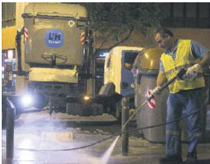
De matinada es netegen els carrers i els contenidors.

L'acció s'acompanya de petites actuacions urbanístiques de reparació de voreres, mobiliari urbà, senyalització i enllumenat