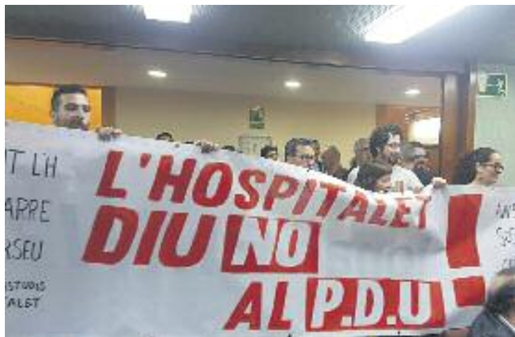
La protesta contra el PDU va obligar a aturar el Ple.

Per altra banda, el grup de Canviem també va anunciar el