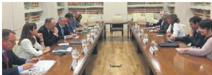
Reunió a tres bandes entre Ajuntament, Govern i Foment.

INFRAESTRUCTURES ▶ El procés per soterrar les vies del tren que esquincen la ciutat avança. El dia 27 de juny es va celebrar a Madrid una reunió a tres bandes entre l'Ajuntament, la Generalitat i el Ministeri de Foment per abordar la qüestió.