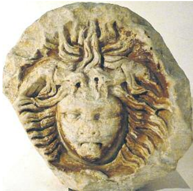
Canviem destaca els indicis d'una necròpolis romana entre el carrer Radi i l'avinguda Vilafranca (esquerra). A la dreta, la medusa, la troballa més característica.