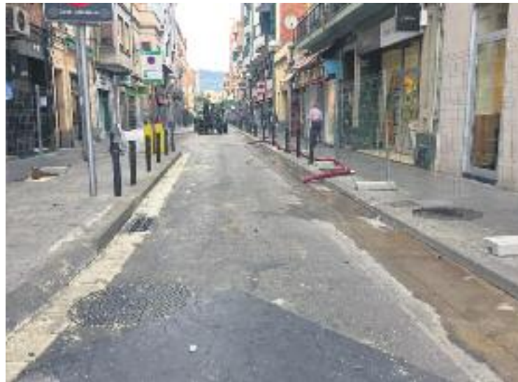
La peatonalització canviarà d'aspecte el carrer.

Tot i que la reforma de la via és molt ben rebuda per veïns i comerciants, també té un punt de polèmica. Per tal de garantir la nova funcionalitat del carrer com a espai de vianants, s'hi ins-