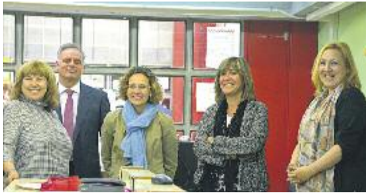
L'alcalde i la consellera durant la visita al Vilumara.

ENSENYAMENT ▶ Dos dels centres educatius més rellevants del barri estan de celebració. Per una banda, l'Institut Can Vilumara, creat l'any 1995 per fusió de l'IB Vilumara i l'IFP l'Hospitalet III, ha inaugurat les reformes fetes durant anys i que han permès rejuvenir l'equipament, a més d'ampliar-lo. Les obres d'ampliació, que han tingut un cost de més de 4.700.000 euros, han permès, entre d'altres aspectes, la construcció d'un nou gimnàs, vestidors, aula de música i plàstica i una pista esportiva, així com la retirada de l'antiga caldera o l'arranjament de la xemeneia de l'antiga fàbrica. El centre té actualment 913 alumnes, dels quals 345 cursen ensenyaments d'ESO; 118, de batxillerat, i 450, de cicles formatius. La consellera d'Ensenyament, Meritxell Ruiz, i l'alcalde Núria Marín van visitar el centre, del qual Marín ha