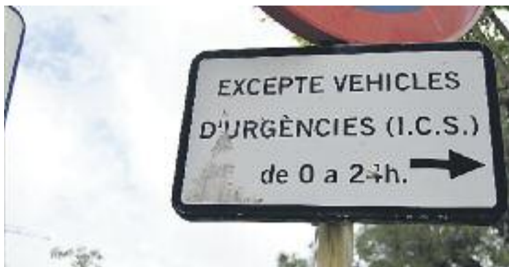
Els senyals de trànsit seran bilingües.

La moció de Cs va provocar un encès debat al Ple entre García i representants d'altres formacions, sobretot amb Rafael Jiménez, regidor no adscrit que va acusar el partit taronja de patir “catalanofòbia”. García va res-