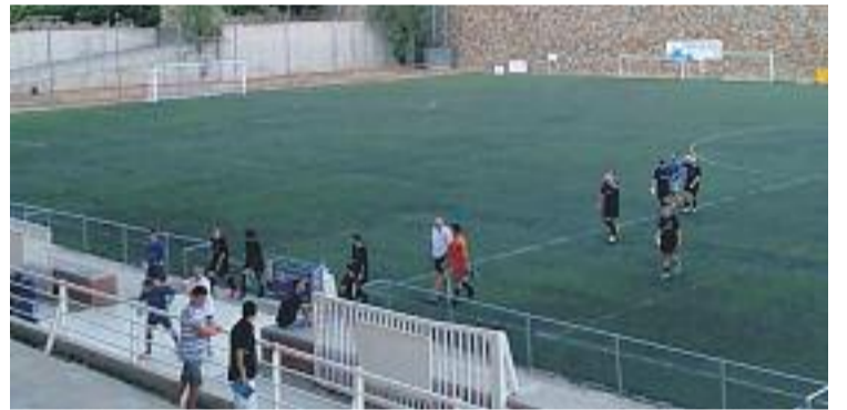
El partit es va jugar al municipal Salt del Pi.

En el moment del tancament d'aquesta edició de Línia l'H , l'Hospitalet havia de jugar el partit de la 38a jornada de Segona B contra el Mestalla que podria fer que l'equip perdés la categoria i que jugués l'eliminària de permanència.