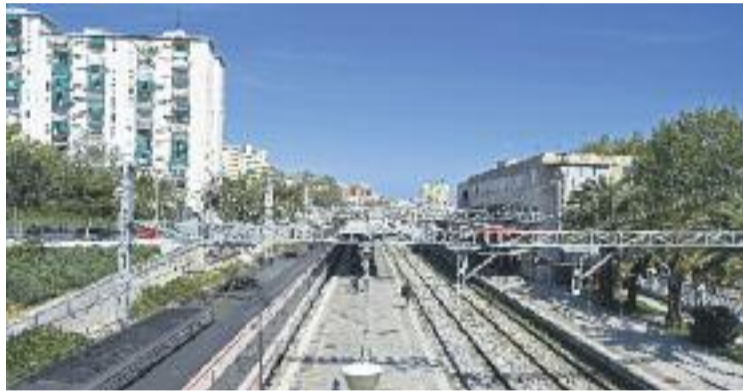
La línia de Vilafranca haurà d'esperar per ser soterrada.

Marín ha celebrat "el canvi d'actitud de Foment" i ha re-