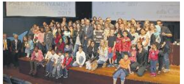
La comunitat educativa de l'escola celebra el guardó.

ENSENYAMENT ▶ Alguns la van qualificar com 'l'escola miracle', mentre que altres van contrargumentar que l'excel·lència de l'escola Joaquim Ruyra de la Florida no es devia a cap intercessió divina, sinó més aviat a la feina de la seva comunitat educativa i els seus mètodes.