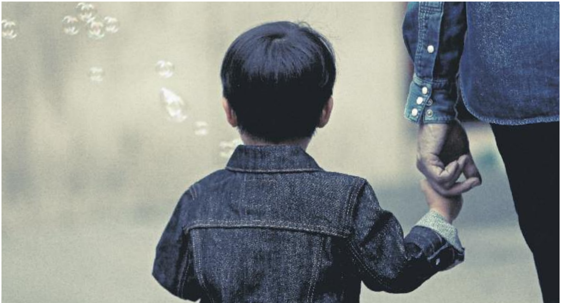
El Departament de Treball, Afers Socials i Famílies ha dissenyat un pla per aconseguir més famílies d'acollida.

» La Generalitat busca un centenar de famílies acollidores per a nens i nenes d'entre 0 i 6 anys