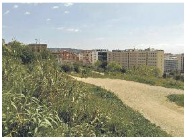
El camp s'ubicarà a tocar del parc de la Torrassa.

En el pla d'inversions de l'Ajuntament fins el 2019 es preveia la construcció d'aquest equipament, que tindrà una superfície de 7.571 metres quadrats. Actualment el pressupost per