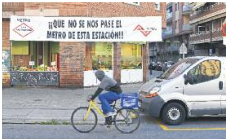
La ciutat segueix pendent de l'arribada de l'L10.

En aquest sentit, Piñar destaca que tant el conseller com els altres membres del departa-