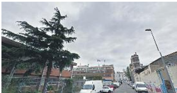
L'Institut, a l'esquerra. A la dreta, fàbriques abandonades.

L'Organització Mundial de la Salut (OMS) ha confirmat l'amiant com a substància cancerígena “de primer grup en humans”, destaca el text de la moció, que recorda que aquesta material “pot produir càncer amb independència de la quantitat a la qual s'està exposat”. De