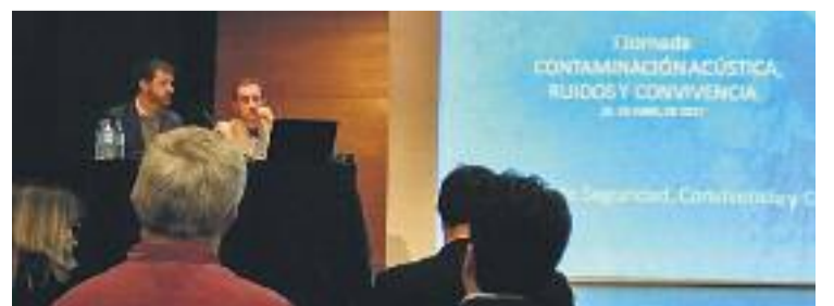
La sessió va tenir lloc al Centre Cultural.

Aquesta activitat es va celebrar en el marc del Dia Internacional contra el soroll, celebrat el 26 d'abril. Qui també es va afegir a la iniciativa va ser l'Hospital de Bellvitge, que va convocar a pacients i metges perquè guardessin silenci durant cinc minuts.