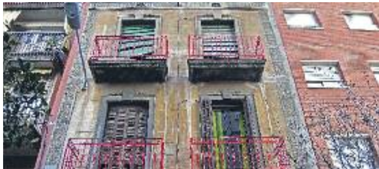
L'edifici de Martí i Julià 199 ha provocat diverses queixes.

És per aquesta raó que els promotors han ampliat el seu radi d'acció i han posat la vista a ciutats com Sant Adrià, Santa Coloma, Badalona o l'Hospitalet. A les tres primeres ja s'han posat en marxa mesures per frenar-los. A l'Hospitalet, en canvi, el Ple de desembre va tombar una moció d'ERC que demana una regulació dels habitatges d'ús turístic de la ciutat i una moratòria fins que no entri en vigor la normativa. "La moratòria de Barcelona comença a tenir efecte a les ciutats dels voltants", va afirmar a la sessió el portaveu republicà, Antoni Garcia. La proposta no va prosperar pels vots en contra de Ciutadans, els regidors no adscrits i el PSC.