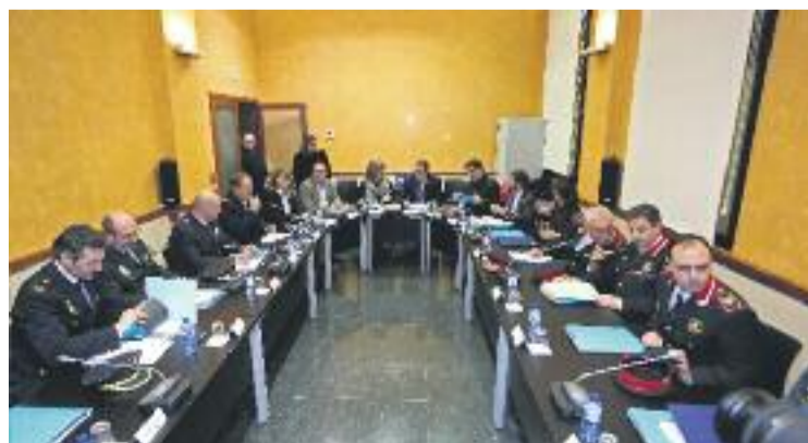
Reunió de la Junta de Seguretat.

En relació amb la lluita contra la violència masclista, a l'Hospitalet es van detenir 481 persones al llarg de l'any passat. Una xifra pràcticament idèntica a la de l'any anterior –quan va ser de 480– i que indica que "cal continuar lluitant contra aquest fet", destaca el consistori.