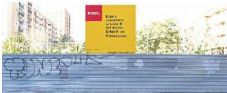
L'estació de Provençana, al carrer Aprestadora.

Qui també està molest per la situació són els veïns. La Federació d'Associacions de Veïns continua recollint signatures a peu de carrer a favor de l'arribada de l'L10 a la ciutat i no descarta