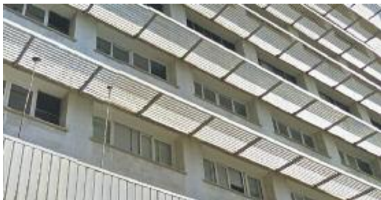
Els veïns del barri han d'anar al CAP de Just Oliveras.

Per una banda, el partit reclama que es construeixi el nou