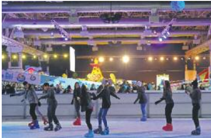
Els infants han estat els protagonistes del Kaliu Park.

Des de la Farga i AP-Productions, els impulsors del projecte que va abandonar Barcelona fa dos anys, s'han mostrat "molt satisfets" amb les dades, ja