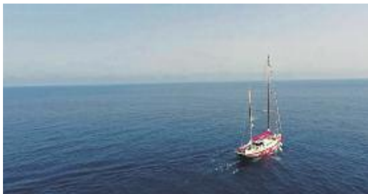
Imatge del vaixell Astral que ajuda els refugiats.

En el documental es pot veure com és el dia a dia dels voluntaris, i com recullen a centenars de persones que agafen embarcacions molt precàries per