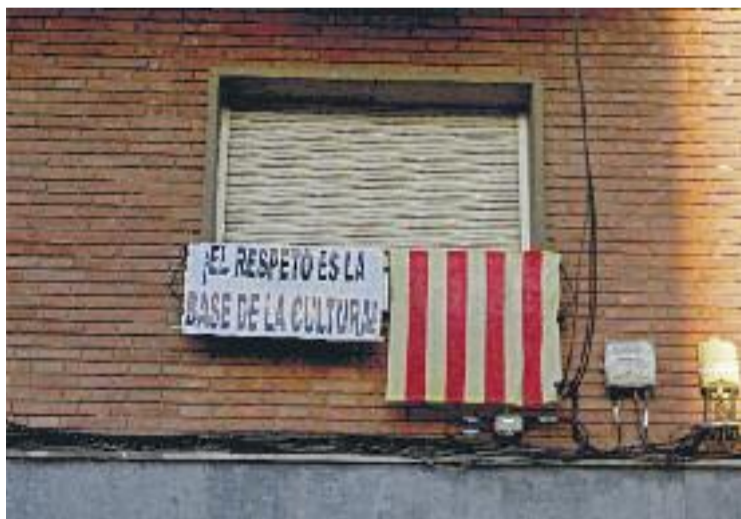
Uns 30 balcons de la plaça llueixen les pancartes.

"Continuem treballant a favor de la convivència", afirma a Línia l'H el regidor del Distric-