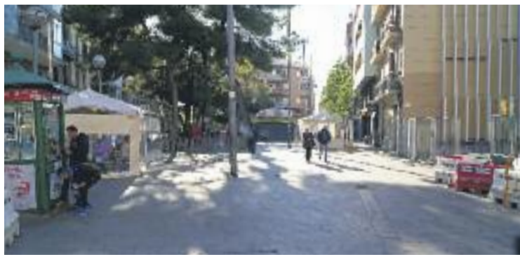
La plaça serà objecte d'una reforma.

De moment, però, els membres de la Plataforma Plaça Espanyola no n'han estat informats de primera mà. “Esperem que quan ho tinguin tot preparat ens