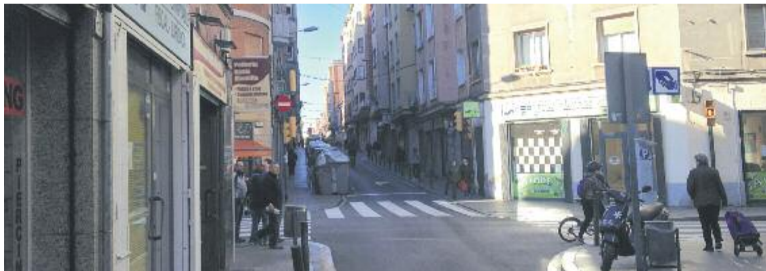
A dalt, un local ocupat per una família al carrer Holanda. A sota, el carrer Pujós, on els veïns alerten de pisos ocupats.

pisos "sense cap tipus de contacte" i que no es faria "càrrec de les despeses de la comunitat". Un testimoni en la línia dels anteriors.