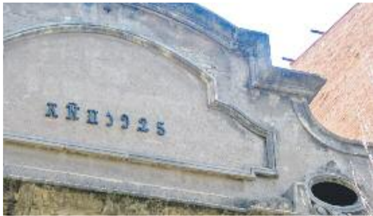
Detall de la façana de l'edifici, que anirà a terra.

Un cop traspasada aquesta zona, es donava accés a un tea-