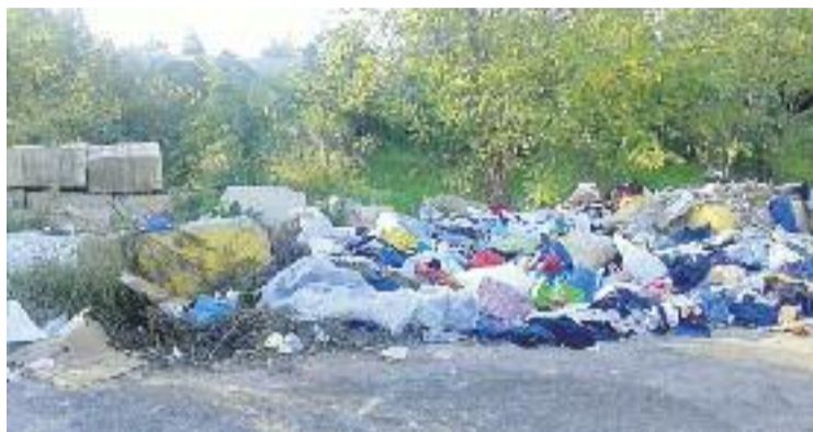
Estat de la zona del pàrquing dels terrenys de Can Rigal.

“Fa més d'un any que ho reclamem, però l'Ajuntament diu que no hi pot fer res”, explica Gimeno. El fet és que els terrenys pertanyen a una mancomunitat de propietaris privats –entre els quals hi ha el FC Barcelona–, i segons el consistori no es posen d'acord per tal d'acometre la tant anhelada neteja de l'espai. Mentrestant,