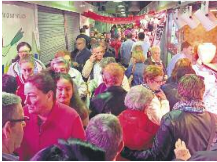
Aspecte del Mercat del Torrent Gornal a la nit de tapes.

Els visitants van poder participar en sortejos que van repartir més de 5.000 regals, 300 quilograms de caramels i 2.000 globus. Per altra banda, els mercats han organitzat demostra-