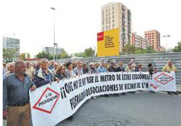
Uns 250 veïns es van manifestar pels carrers del barri.

La notícia que el metro podria passar de llarg de Santa Eulàlia va indignar als veïns del barri, que cansats de suportar les obres de construcció del metro ara te-