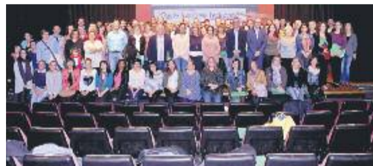
L'acord compta amb 105 suports.

EDUCACIÓ ▶ El Pacte local per l'educació, impulsat pel govern local i presentat a principis de mes, ha començat a caminar sense consens amb totes les forces de l'oposició. El document, que contempla 155 propostes d'actuació per afrontar els reptes en matèria d'ensenyament a la ciutat, només ha comptat amb el beneplàcit del PSC, ERC i PDE-CAT. Tanmateix, el text aplega un total de 105 signants entre escoles, sindicats i entitats diverses.