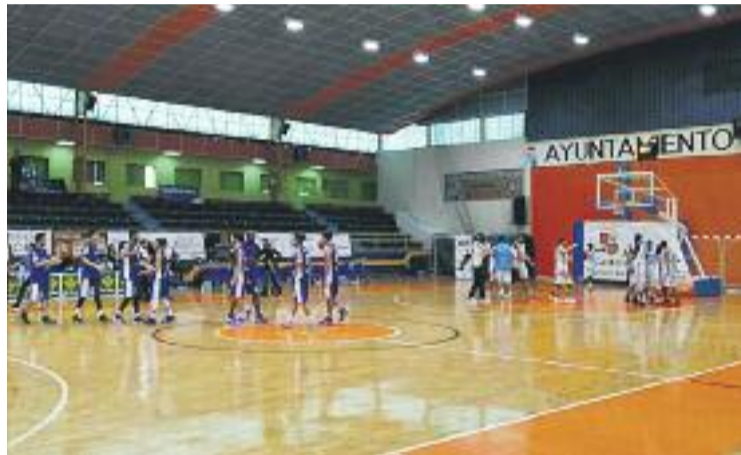
L'equip no va poder puntuar a Zamora.

del segon parcial, però a falta de cinc minuts per al descans els locals van començar a reaccionar per reduir la renda a set punts (31-38).