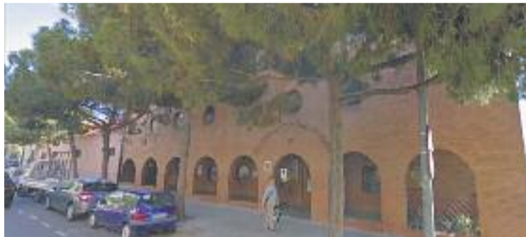
La parròquia de la Immaculada, de nou al centre de la polèmica.

Tot i així, segons es pot veure a les fotos publicades per la Di-