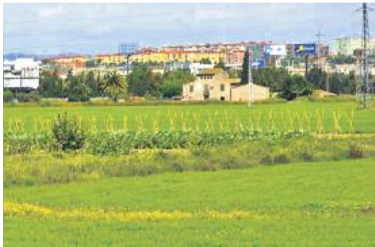
Els terrenys de la Masia de Cal Trabal afectats.