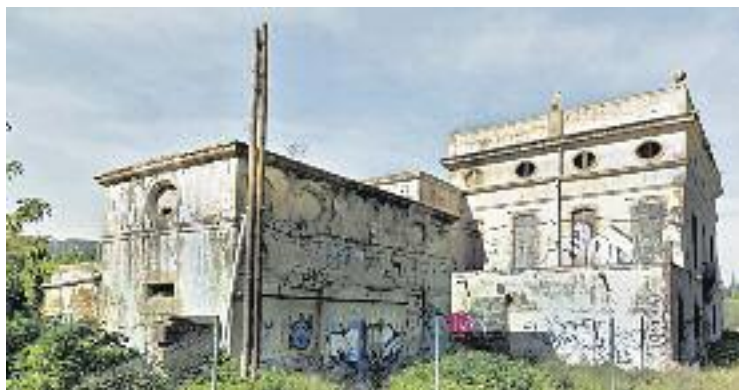
Una imatge de l'estat actual de la masia de Can Rigal.

La masia de Can Rigal data de mitjans del segle XVIII i està inclosa al Pla Especial de Protecció del Patrimoni Arquitectònic de l'Hospitalet. Malgrat això, la situació actual de l'edifici dista molt de ser l'esperat d'una construcció protegida: parets i sostre en mal estat, pintades a l'exterior... A més, els veïns de Pubilla Cases s'han cansat de demandar una solució, ja que els terrenys on s'ubica la