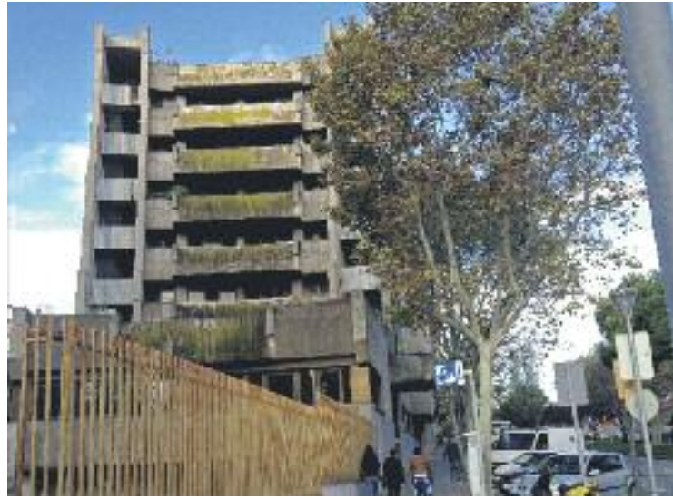
Els antics jutjats pateixen un estat de degradació alt.

L'edifici és de propietat municipal i Planeta el podrà explotar per un període de 25 anys, prorrogable fins a un màxim de cinc anys més. L'inici de l'activitat tindrà lloc en el curs acadèmic 2017-2018 i es centrarà en el projecte iFP de formació professional, que estableix una vinculació directa amb les necessitats formatives del món de l'empresa. També abastarà projectes d'àmbit universitari –de formació presencial i online– i de matèries molt diverses, com ara ciències