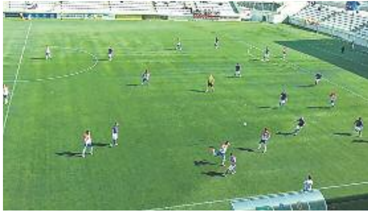
L'Hospi es va quedar sense veure porteria.

A la represa va trencar-se el partit. Corria el minut 63 quan Nieto va desbordar per la banda dreta i va posar una centrada rasa que Javi Flores va rematar a l'altura del punt de penal lluny