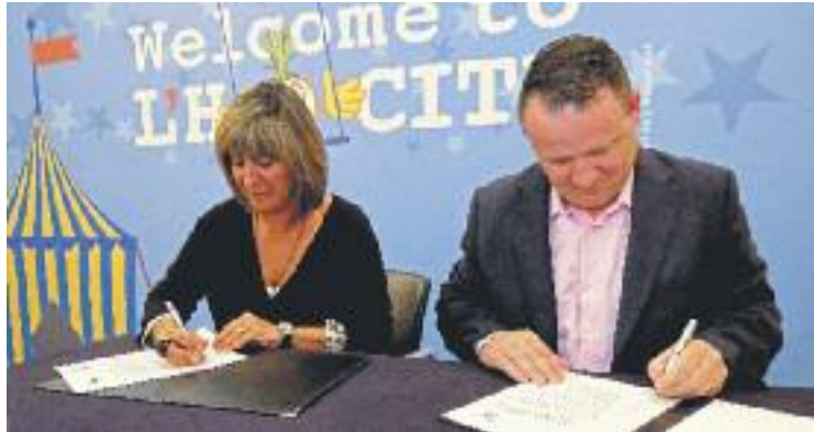
Moment de la signatura de l'acord d'intencions.

D'aquesta manera, tot i que no hi ha cap expedient encara, l'espectacular circ quebequès es compromet a portar els seus espectacles en gira a una carpa que s'instal·larà en un solar de 19.000 metres quadrats, delimitat per la Travessera Industrial i el carrer de la Feixa Llarga. La carpa tindrà la mateixa mida que les utilitzades en espectacles anteriors,