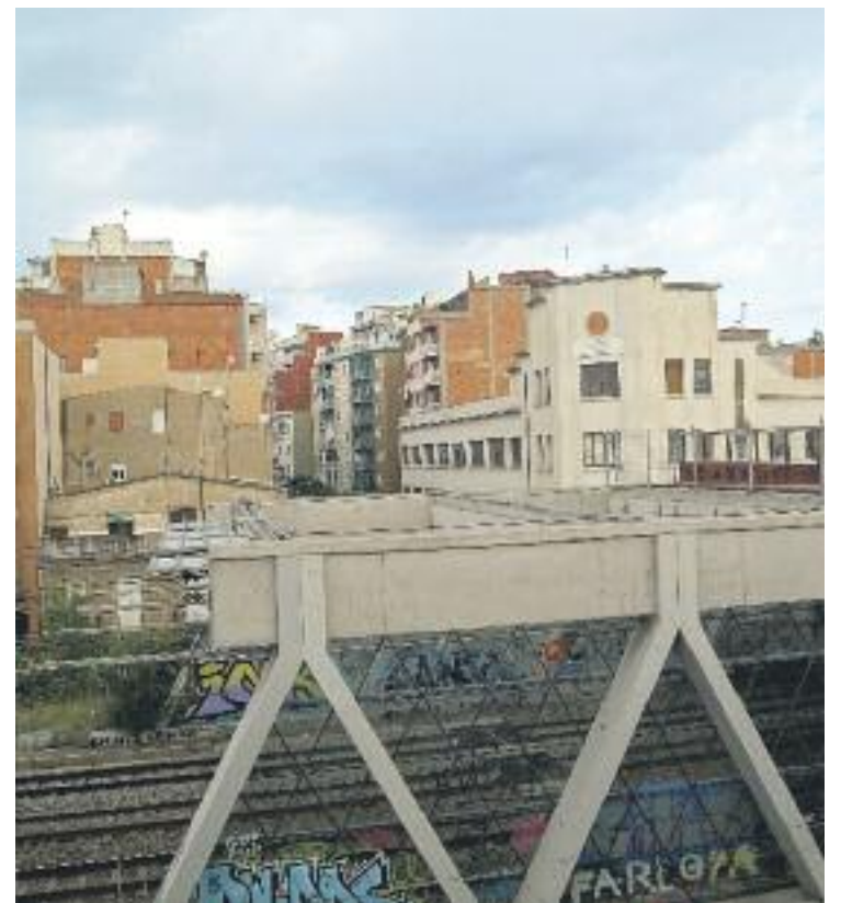
El calaix de les vies emfatitza la frontera entre Barcelona i l'Hospitalet, la segona ciutat de Catalunya.

caminant o en bicicleta pel cor de la ciutat sense interrupció. “Seria genial”, sosté Godia. Poc després va esclatar la crisi i aquest preprojecte se'n va anar en orris.