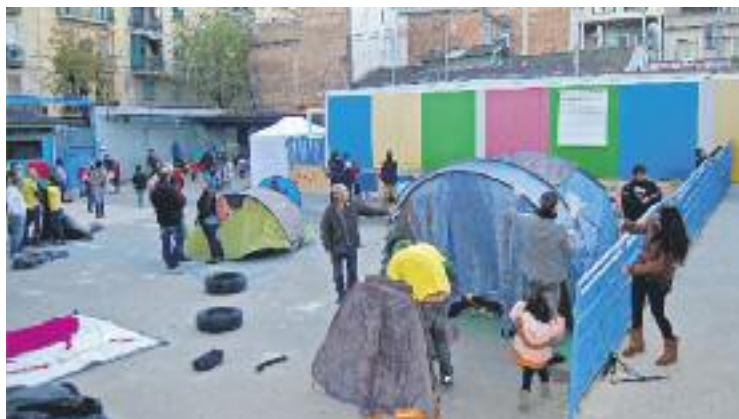
Acampada del desembre reclamant el nou edifici.

Aquest nou anunci dilata el procés del nou edifici d'una escola que ha arrencat el curs de nou en barracons, ja que a principis d'any Ensenyament va assegurar a aquesta publicació que estaria construït al llarg del curs 2017-2018. Si el procés del nou centre arrenca finalment