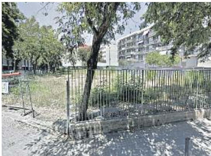
Es construirà en aquest solar entre els carrers Bacardí i Alhambra.

es liciti, les obres tenen un termini d'un any i mig, per tant serà clau que el projecte no s'encalli en aquests tràmits i s'aprovi la construcció a principis de l'any vinent, per tal que a finals del 2018 el nou CAP estigui llest.