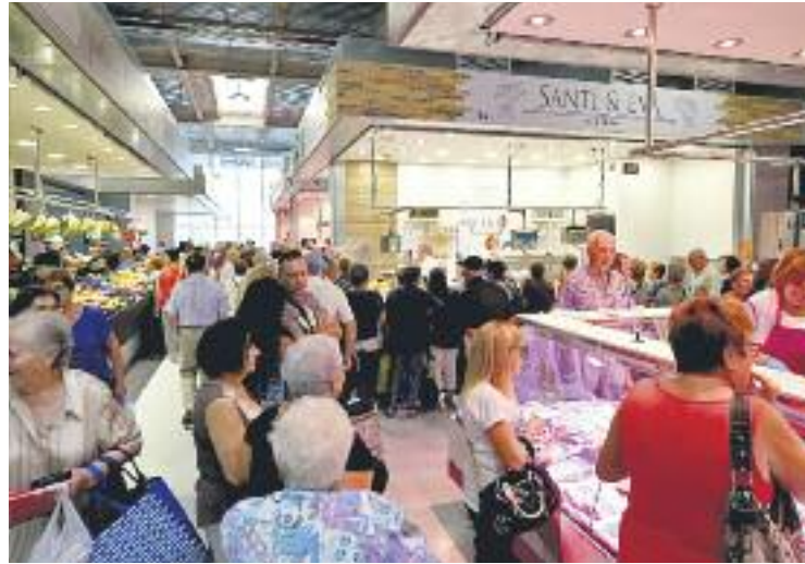
Obertura del nou Mercat de la Florida.

Coincidint amb la Setmana de la Solidaritat, el diumenge 23 d'octubre se celebrarà una botifarrada popular al mercat de Los Pajaritos a partir de les 12 del migdia. Els diners que es recaptin aniran destinats al fons de la Setmana de la Solidaritat. Per altra banda, els dies 22 i 23 els mercats treuran les seves