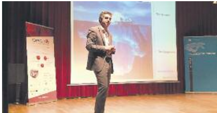
El Barradas es va quedar petit per escoltar el científic.

Esteller va parlar de la seva especialitat, l'epigenètica, que tracta sobre la influència d'elements externs sobre la genètica de les persones, i que explica perquè algunes persones des-