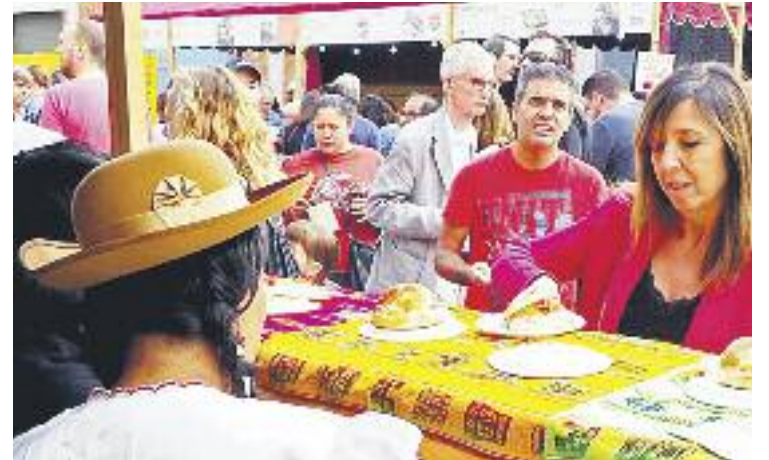
La fira va registrar una bona afluència de visitants.

El tast de tapes va estar acompanyat d'actuacions i exhibicions que van acompanyar els visitants en el seu viatge pels sabors d'altres continents sense haver de sortir de la ciutat.