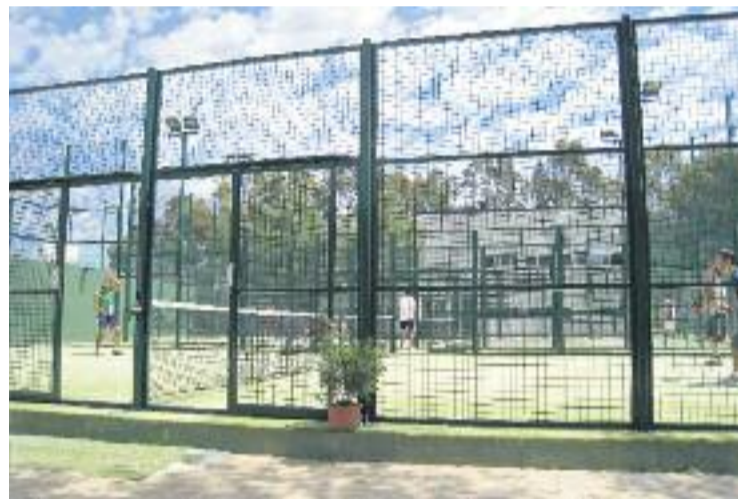
Segons l'estudi, el pàdel és l'esport de moda a la ciutat.

Les dades de Decathlon també destaquen que en l'últim any s'ha disparat la pràctica de l'esport. De fet, en aquest període de temps a la ciutat s'ha passat de poder practicar una quarantena de disciplines a les gairebé 70 de l'actualitat.