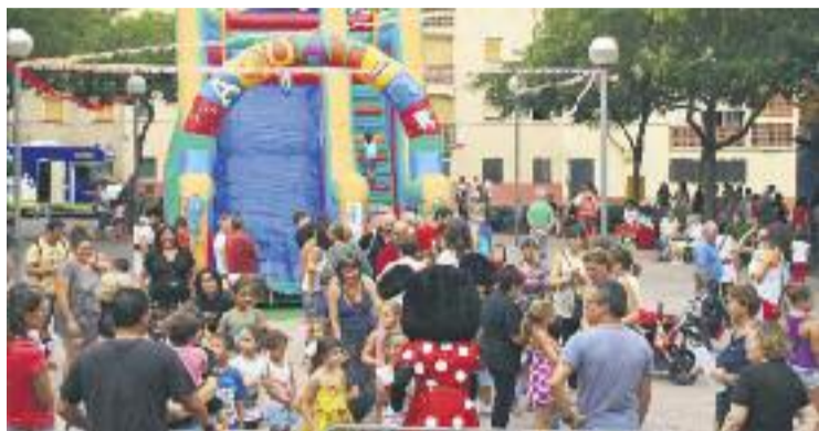
La festa infantil sempre triomfa.

La celebració arrencarà divendres vinent amb la presentació de les festes a la plaça Sant Jordi. Hi desfilaran les pubilles, es llegirà el pregó i hi haurà els parlaments de les autoritats, que donaran pas al tradicional sopar