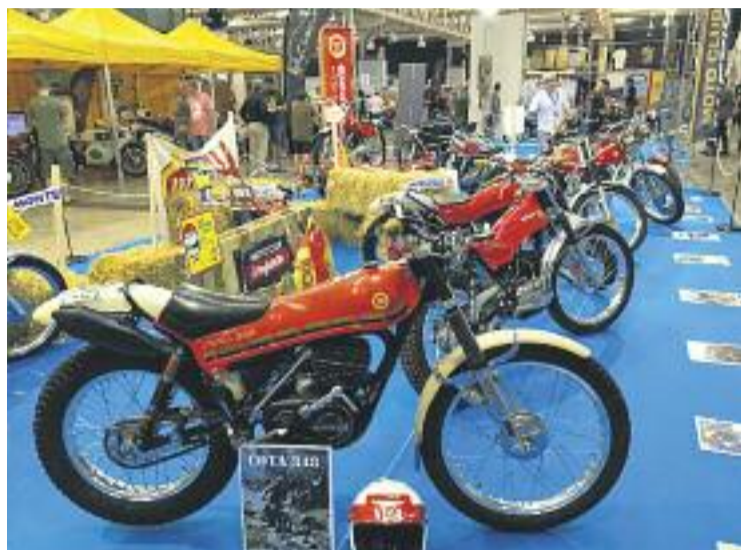
Les tradicionals marques catalanes hi van ser presents.