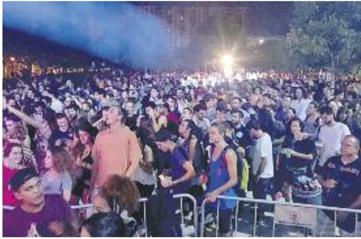
Els concerts van tornar a ser tot un èxit.

Les celebracions van arrencar el dia 3 amb la visita de l'alcaldessa, Núria Marín, a l'Estand Sociocultural, a l'envelat de la plaça de la Cultura. Durant els dies de festa, com és també tradició, diferents líders dels partits polítics van visitar les parades de