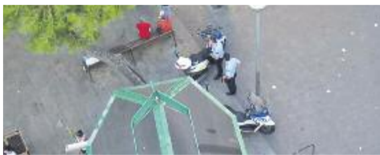
Els veïns demanen més presència policial.

Per tot plegat, els veïns han decidit passar a l'acció. D'aquí a uns dies es reuniran per concretar protestes, com ara col·locar pancartes "fins a l'octubre de l'any