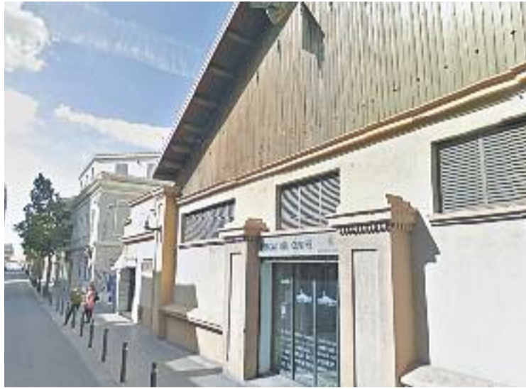
La compra del mercat es podrà rebre a casa aviat.

Per altra banda, des d'ERC sostenen que, "a més de millorar la qualitat de l'activitat i serveis que actualment presten