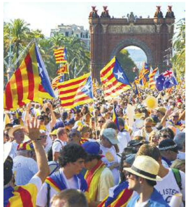
El passeig de Sant Joan de Barcelona es va omplir a vessar de manifestants a favor de la República Catalana.