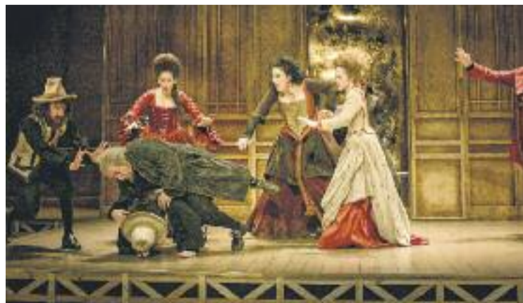
L'obra arriba a l'Hospitalet divendres 30.