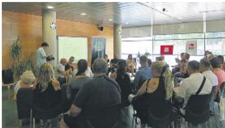
Presentació del quadern sobre la Bomba.

Aquest barri s'ubicava en la confluència del carrer de Caste-