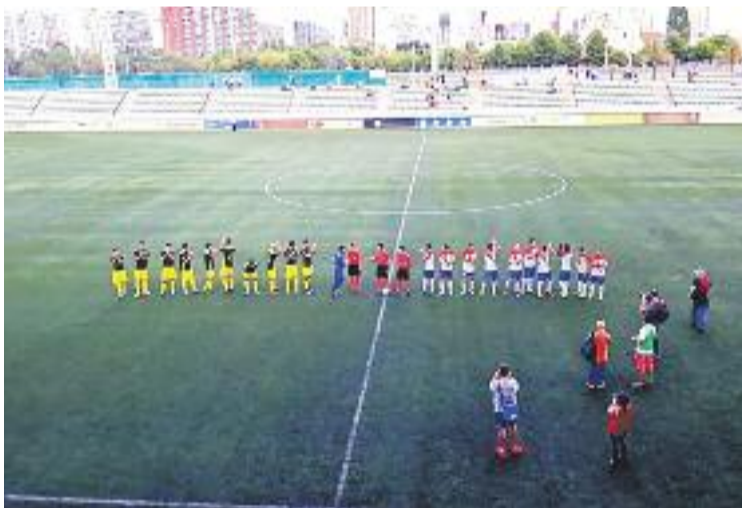
L'equip va aconseguir el tercer empat del curs contra el Prat.