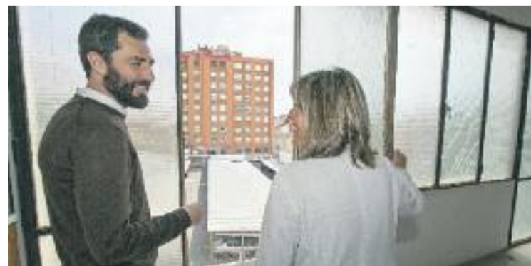
Una visita de l'alcalde a les galeries Nogueras Blanchard.

La Gallery Weekend Barcelona arrencarà el pròxim 29 de setembre i s'allargarà fins al 2 d'octubre.