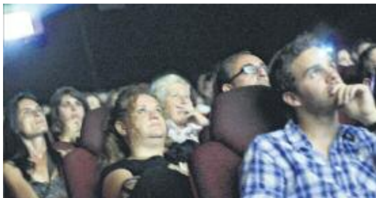
Els curts es projectaran a la gala del dia 4 de novembre.

Enguany el certamen ha fet un salt qualitatiu. I és que inclou la marca L'Hospitalet Experience, una iniciativa municipal que vol posar en valor la cui-