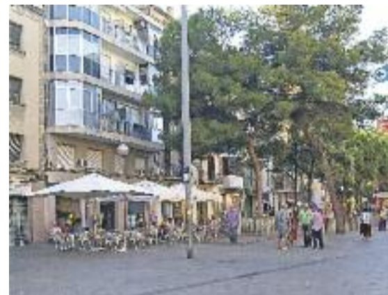
L'estat de la plaça durant la nit (esquerra) contrasta amb la seva aparença plàcida durant el dia (dreta).

punts calents" del barri. A més, aquesta font ha reconegut que, sobretot a l'estiu, "s'hi necessitaria més presència policial" per evitar actuacions incíviques i "poc respectuoses". També cal dir, però, que no és un punt on es cometin delictes greus.