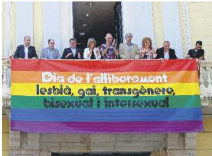
Desplegament de la bandera amb l'arc de Sant Martí.

De l'estudi es desprèn que tot i l'ampli percentatge d'alumnes que presenciaven conductes homòfobes, els que reben aquest ti-