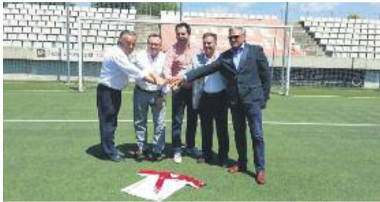
Una imatge de la presentació del director esportiu.

El dels quadribarrats, però, no és l'únic compromís que l'Hospi afrontarà de manera immediata, ja que durant la primera setmana d'agost defensaran el campionat del Torneig dels