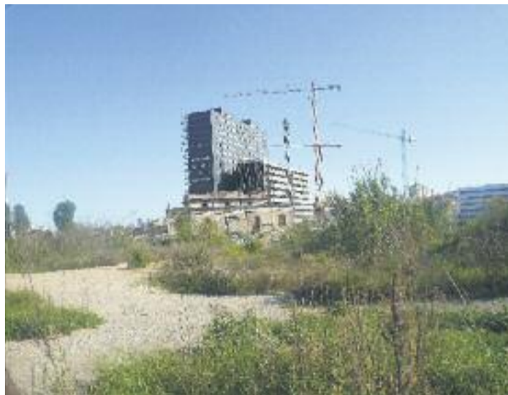
Terrenys de Can Rigalt.

El Club està obligat a desfer la venda dels terrenys de Can Rigalt, a Pubilla Cases, ja que la sentència diu que no s'han com-