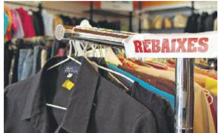
Les rebaixes duraran fins a finals d'agost.

Pel que fa a la competència de les grans superfícies, Ibáñez creu que "el petit comerç té la seva pròpia vida" i que "són models compatibles". "Hem de posar en valor aspectes com la proximitat". "Les grans superfícies no haurien de ser la nostra guerra", conclou.