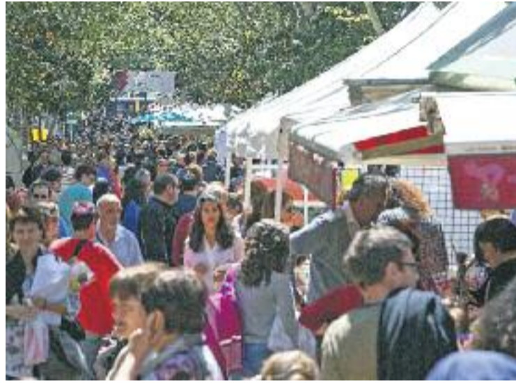
Els comerciants locals han tret pit els últims mesos.

En el cas de la Festa del Comerç a la Florida, la jornada es va dur a terme al vespre, ja que va coincidir amb la Festa Major i d'aquesta manera es va poder