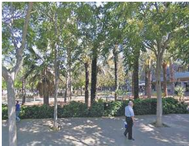
La Milagros Consarnau s'omple d'activitats cada divendres.

El programa preveu que al matí s'oferixin contes teatralitzats i musicals, a més de jocs a la tar-