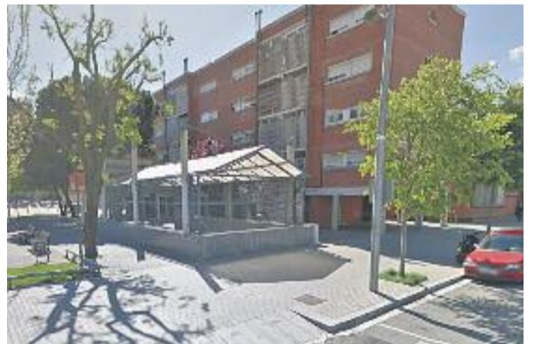
Una imatge de l'exterior de l'estació de Bellvitge.

Segons va remarcar Casals, tot plegat es tracta d'una "demanda històrica" dels veïns i veïnes del barri de Bellvitge i de l'Ajuntament.