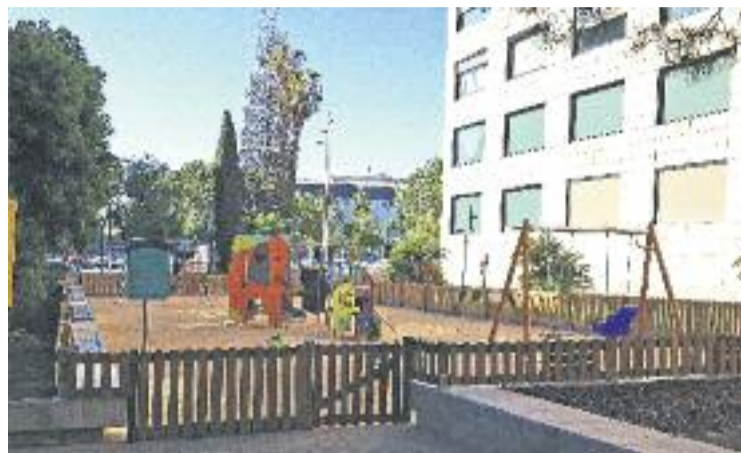
El nou espai de joc del parc de la Serp.

VUIT ELEMENTS DE JOC NOUS El nou espai de joc a l'àmbit de Puig i Gairalt compta amb 360 metres quadrats i es divideix en