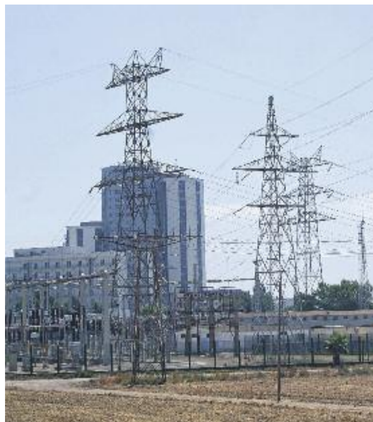
Masia de Can Trabal (esquerra), que dona nom a tots els terrenys de l'entorn. El PDU també contempla soterrar les línies elèctriques de la zona (dreta).