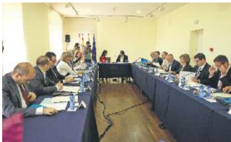
Reunió a Can Buxeres entre el consistori i la Generalitat.