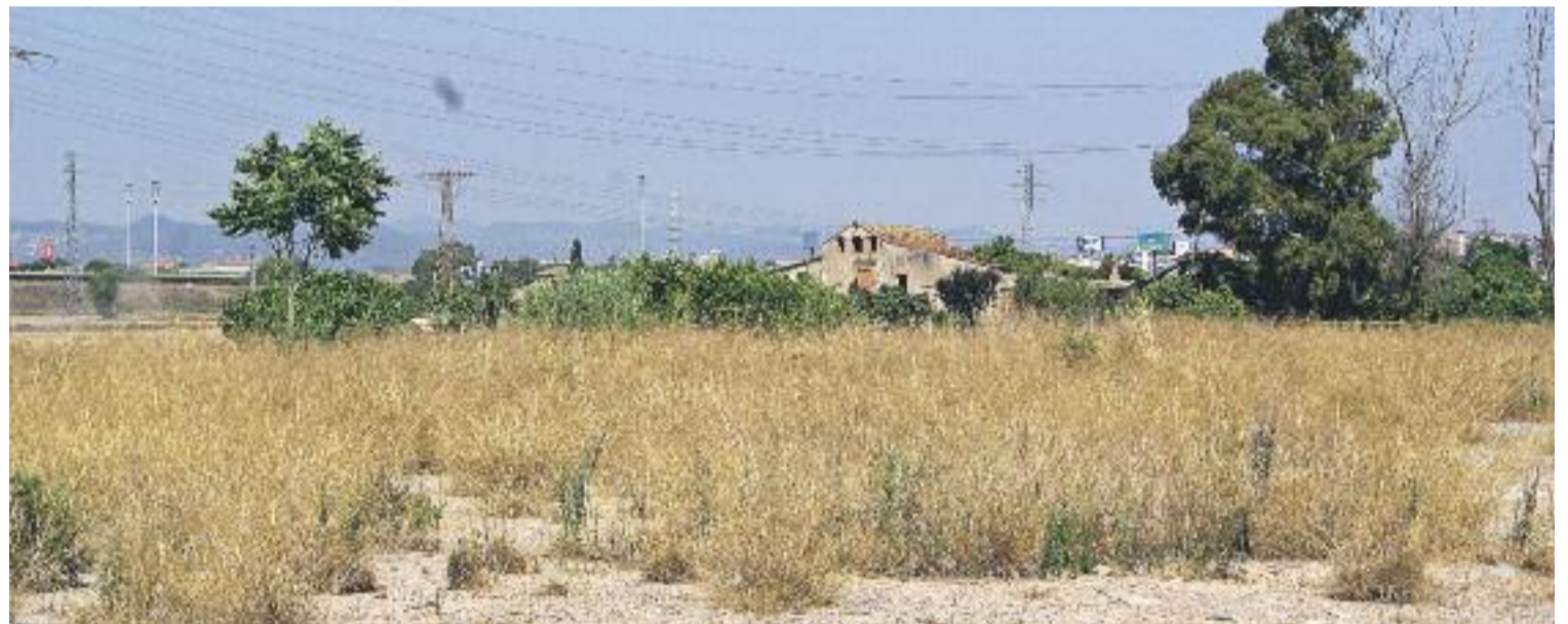
Manifestació a l'exterior del Consorci de la Gran Via del dilluns dia 6 (a dalt) i àmbit de Can Trabal (a sota).

canvis efectuats, els republicans els consideren “insuficients” i anuncien que presentaran al·legacions per “millorar el pla de la Gran Via i preservar Can Trabal”.