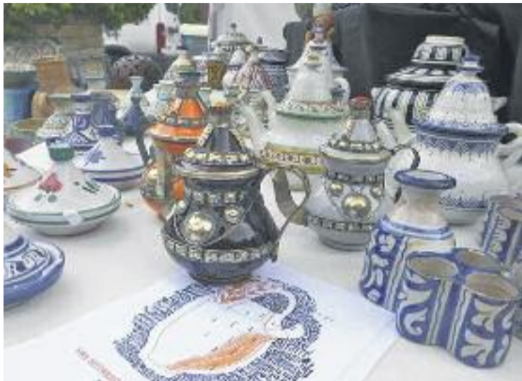
La mostra tindrà lloc del 21 al 24 d'abril.