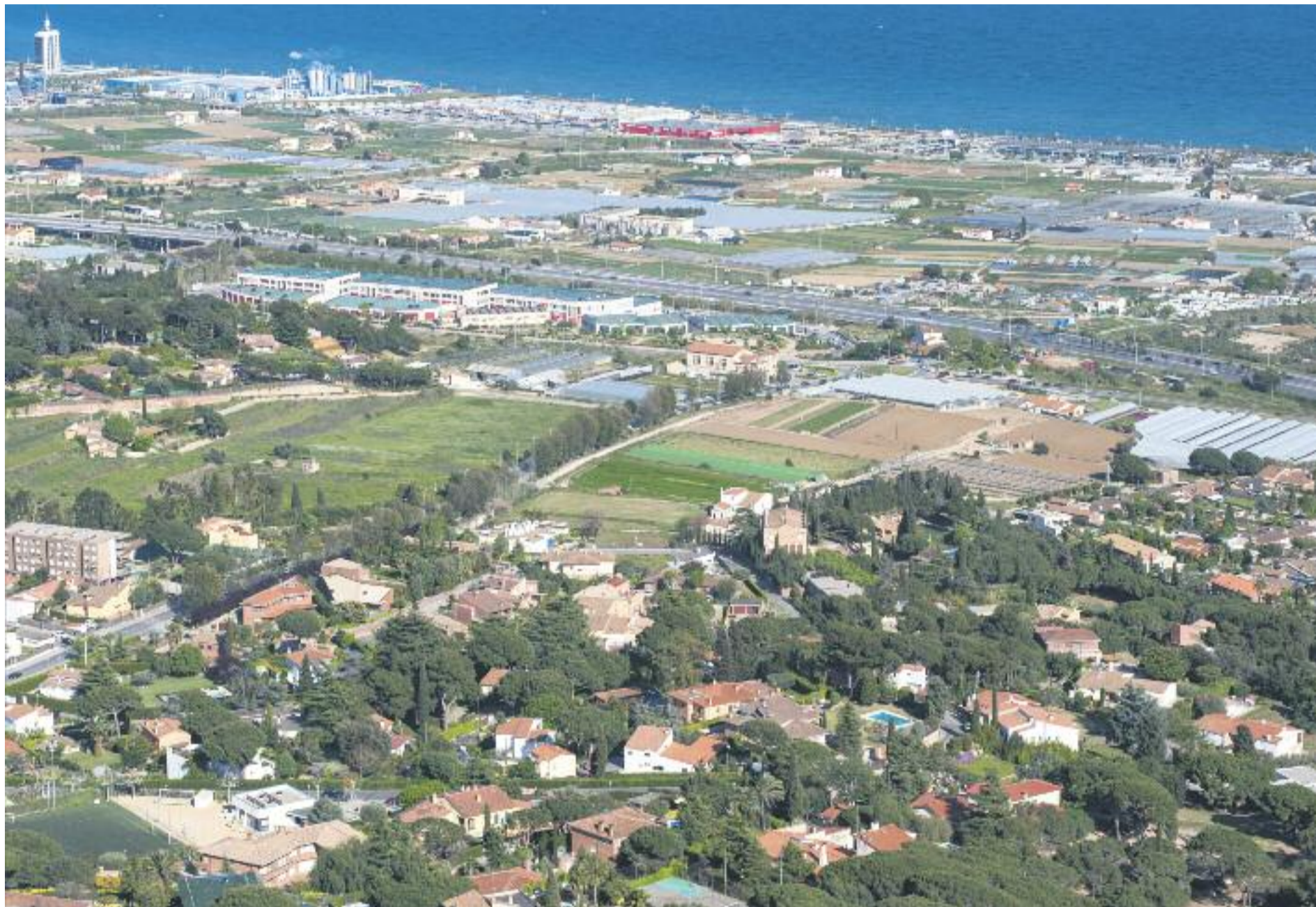
El programa està destinat als municipis de la demarcació i inclou dues línies de suport.

» La Diputació impulsa un nou programa de foment de l'ocupació i de suport a la integració social » El pla beneficiarà 5.000 persones i dóna llibertat als contractadors i autonomia als ajuntaments