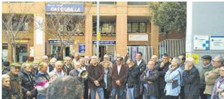
Una imatge de la concentració del 7 d'abril.

del servei es va fer el passat dijous 7 d'abril al davant del mateix centre sanitari, en una concentració on es va explicar l'acord als veïns i veïnes de la zona i on hi van ser presents representants municipals tant de l'Hospitalet com d'Esplugues.