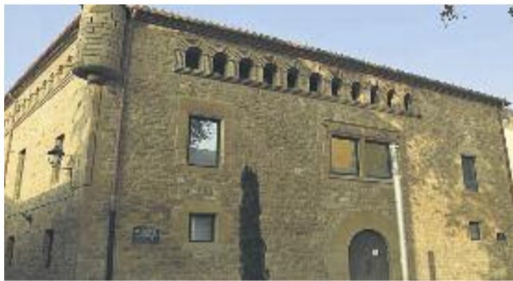
La mostra s'exposa a l'Harmonia.