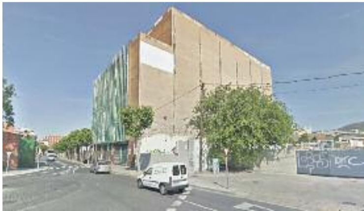
Antiga fàbrica Mistral.

Des de Ciutadans han criticat "que l'equip de govern local no