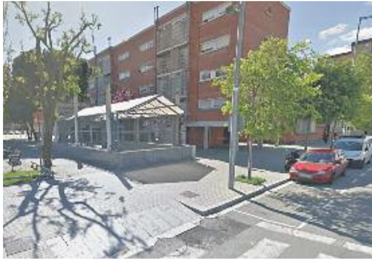
Estació de Bellvitge-Gornal.

També van recordar que tan veïns i veïnes com el consistori hospitalenc s'oposen a "l'inici de les obres de millora de les vies si aquestes no inclouen les obres