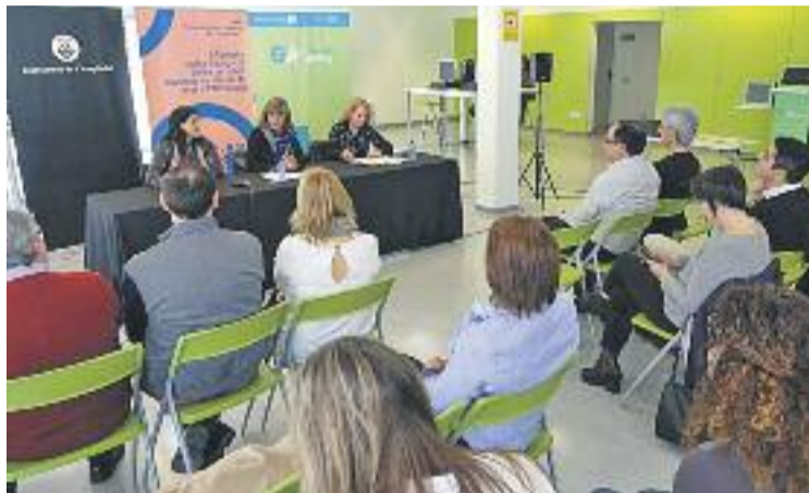
Dia de la presentació del congrés al Gornal Activa.

La jornada està organitzada per Assat50, compta amb el suport de l'Ajuntament i del SOC,