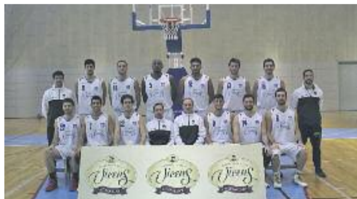
L'equip sènior està protagonitzant una gran temporada.

BÀSQUET ▶ El Torrons Vicens CB l'Hospitalet serà un dels organitzadors de les fases d'ascens a LEB Plata. El club ha rebut aquesta recompensa gràcies a la bona feina de l'equip de Jorge Tarragona, líder indiscutible en els dos primers trams del campionat.