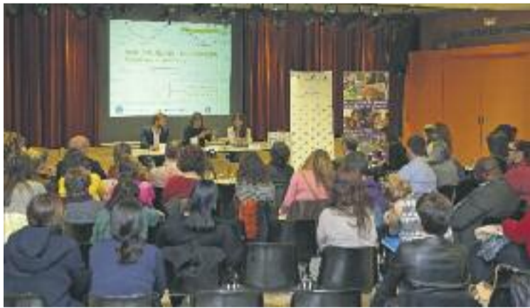
Acte de la primera trobada, el passat 8 d'abril.

En aquesta jornada es va presentar un diagnòstic dels barris de Collblanc i la Torrassa, el qual consisteix en un estudi detallat