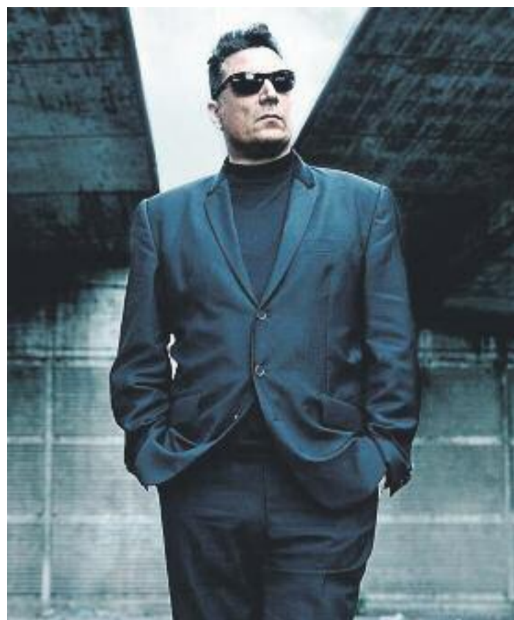
Loquillo (dreta), cap de cartell d'unes festes que tornaran a homenatjar la cultura popular (esquerra).