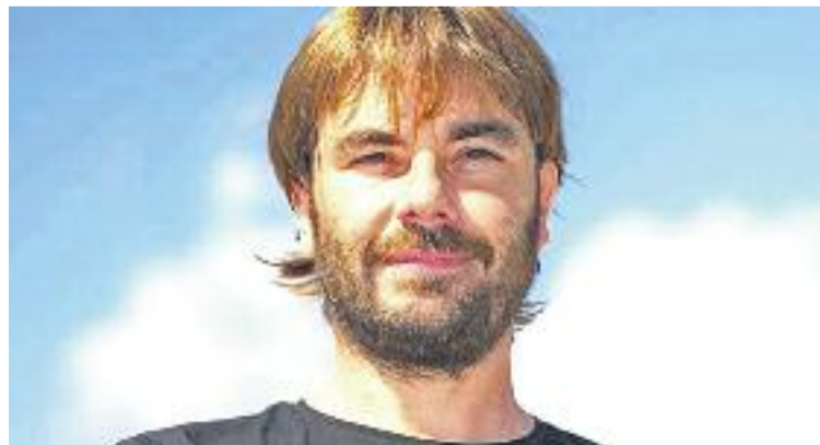
Masferrer presentarà l'acte el pròxim 8 de maig.

L'espai compta amb dues sales, una amb una capacitat per a 520 espectadors i ocupa 120 metres quadrats de superfície. L'altra té 168 localitats i 40 metres quadrats.