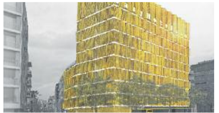
Recreació virtual del futur EasyHotel de la Gran Via.

TURISME ▶ L'Hospitalet tindrà un nou hotel a partir del 2018, el seu catorzè. La cadena britànica EasyHotel el construirà al número 22 de la Gran Via, entre els carrers Modern i de Bacardí.