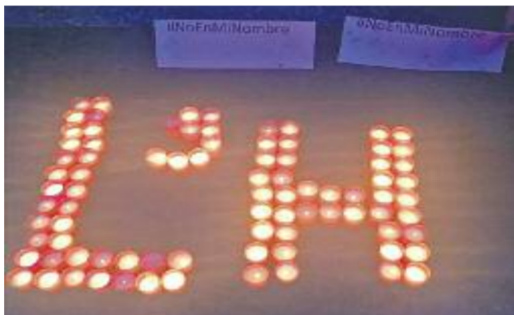
Espelmes enceses en record dels refugiats.

A la mobilització també es va criticar el preacord de la Unió Europea amb Turquia per retornar refugiats al país otomà. L'acte, que es va haver de traslladar al vestíbul del consistori per la pluja, va cloure amb la lectura d'un manifest per part d'un