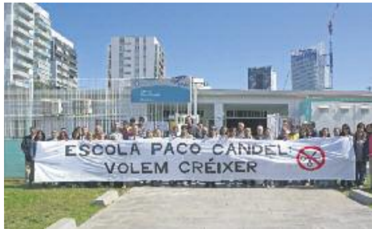
Protesta a l'escola per reclamar l'ampliació.

Els grups parlamentaris també demanen "informar sobre la situació de l'escola Frederic Mistral i el calendari previst per re-