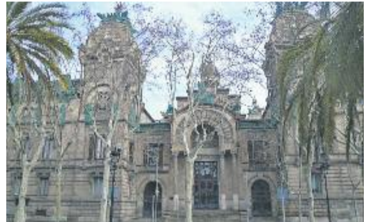
El judici s'ha celebrat a l'Audiència de Barcelona.

Los Menores està integrada per una vintena de joves d'origen sud-americà, tots ells adolescents. Va néixer l'any 2006, després que s'escindissin de la banda dels Black Panthers, ja que aquesta no acceptava menors.