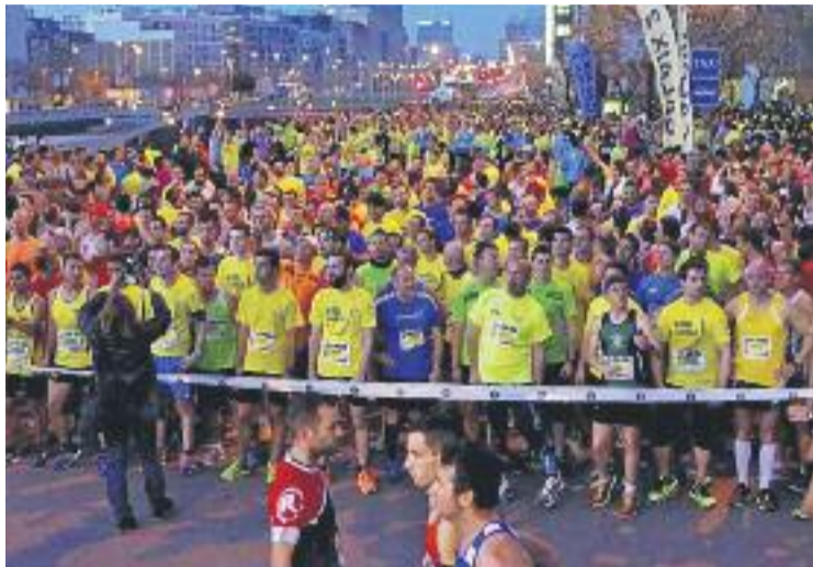
Una imatge de la cursa de l'any passat.

Les inscripcions es podran formalitzar fins al dia 8 d'abril a diferents poliesportius i comer-