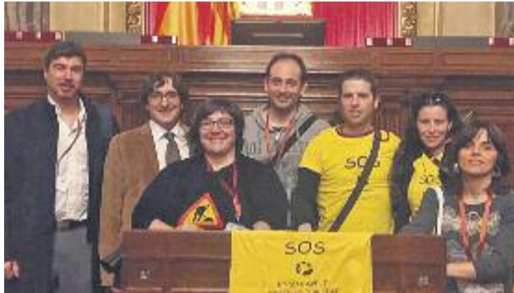
Membres de l'AMPA al Parlament, l'1 de març.