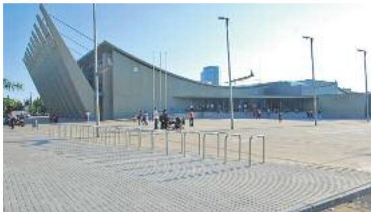
Exterior del poliesportiu.

L'AE Bellsport ha rebut amb satisfacció la condemna i fa uns dies va emetre un comunicat dient que "l'entitat, la seva junta directiva i gerència resten lliures de culpabilitat". "Desitgem poder recuperar la credibilitat en