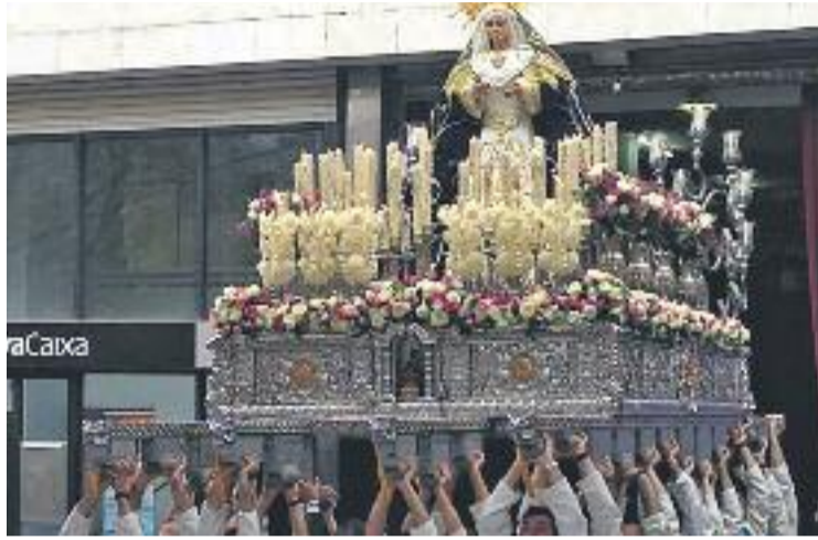
Sortida de la Virgen de los Remedios de l'any passat.

El mateix dia a dos quarts de nou del vespre se celebrarà la processó del Cristo de la Expiración. El recorregut començarà i finalitzarà al carrer del Molí i passarà per l'avinguda de l'Electri-