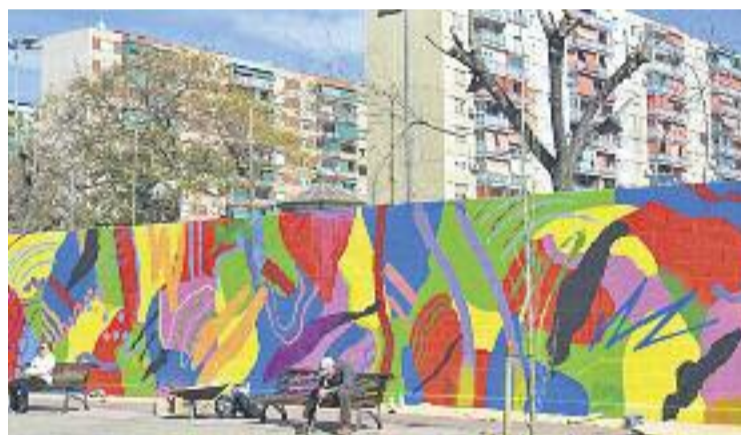
El mural ha estat encarregat per l'AVV del barri.

L'associació Contorno Urbano està formada per diversos artistes de la ciutat, a més d'una integradora social i una arquitecta. Les seves propostes giren entorn de l'art mural i el grafiti com a "elements actius per difondre la cultura i millorar la qualitat de vida de les persones", segons diuen des de l'entitat.