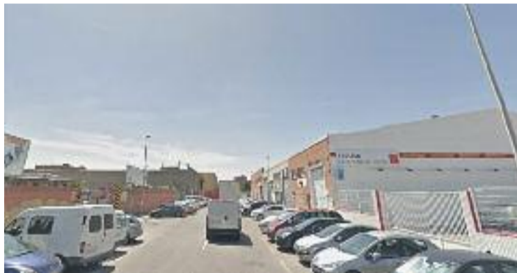
El carrer de Cobalt es projectarà com a 'central street'.

L'Ajuntament ha engegat aquesta proposta en el marc d'una "aposta estratègica per a la ciutat sorgida del procés participatiu L'Hospitalet on ". L'objectiu de la iniciativa és situar la cultura "com un dels eixos bàsics de desenvolupament social i econòmic", expliquen des de l'Ajuntament.