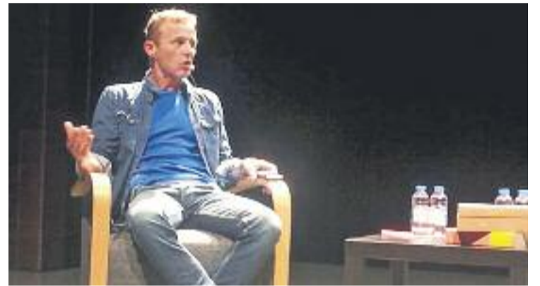
L'autor conversant amb els assistents a l'acte.

Jo Nesbø va néixer a Oslo l'any 1960. El 1997 va publicar la seva primera novel·la, Flaggermusmannen , i va ser premiada amb el Riverton i el Grassnøkkelen. És conegut principalment per les seves novel·les negres sobre l'inspector Harry Hole.