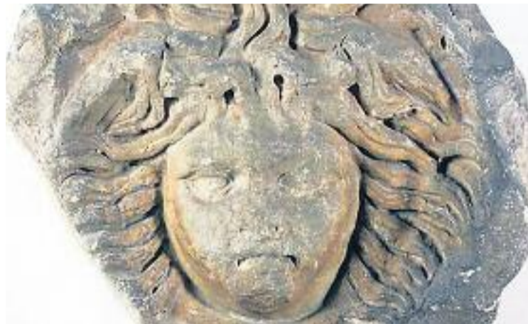
La Medusa forma part del Museu Arqueològic de Catalunya.

Partint d'aquesta peça, els artistes que ara exposen les seves obres al museu han aportat la seva visió personal del mite del cap de la medusa. La iniciativa forma part del cicle Mirades