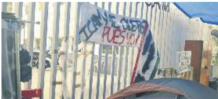
L'ICAM denuncia danys a la seva instal·lació.

López va acampar a la seu de l'ICAM, al barri barceloní de Vallcarca, durant un parell de mesos a finals de l'any passat reclamant que es reconsiderés la seva incapacitat laboral per les seqüeles que li ha deixat un in-