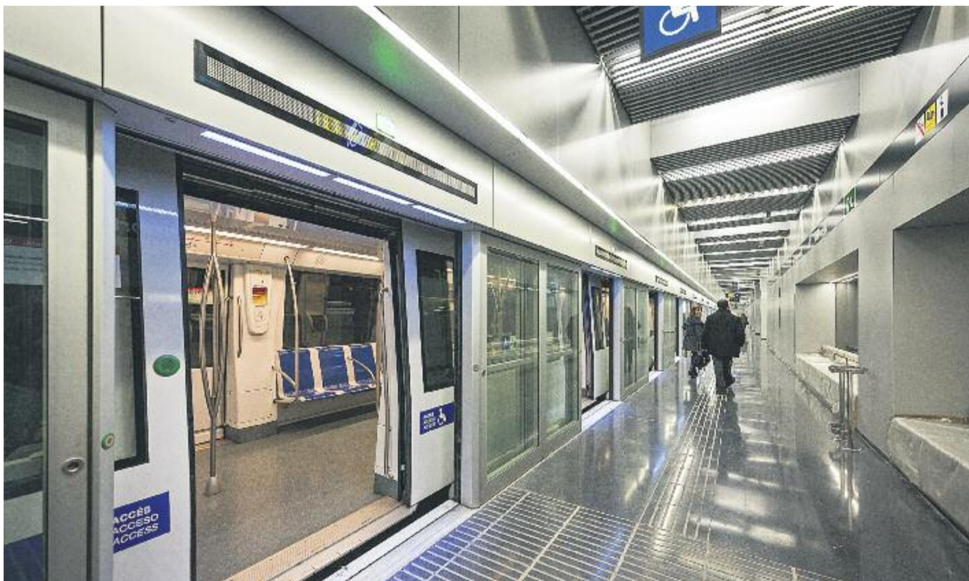
El tram sud de l'L9 està en funcionament des del passat dia 12 de febrer.

» El tram sud de la Línia 9 de metro entra en funcionament amb 20 quilòmetres i 15 estacions » La nova línia uneix Zona Universitària amb l'aeroport del Prat en poc més de mitja hora