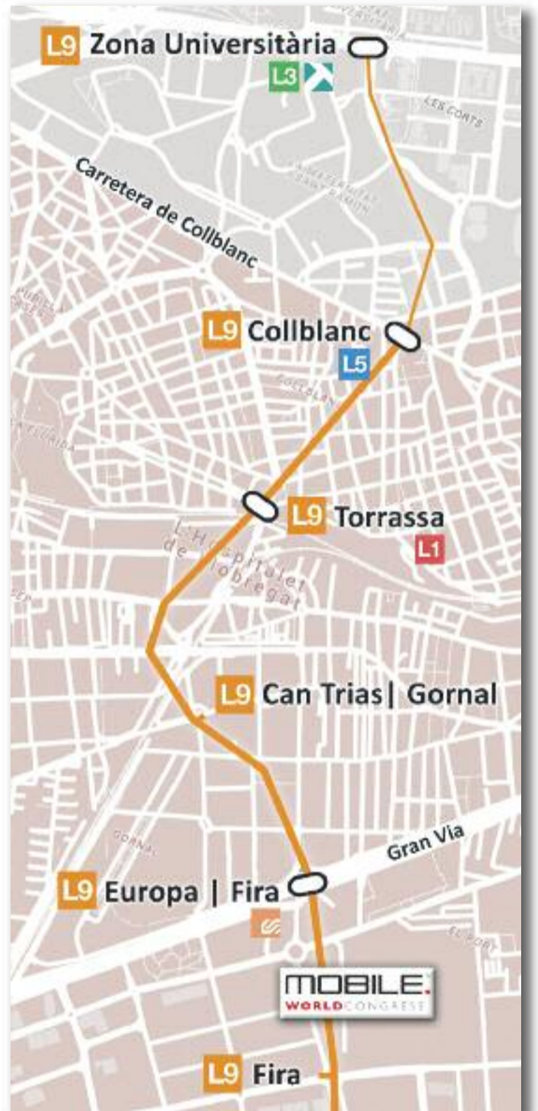
Les cinc parades de la Línia 9 a la ciutat.