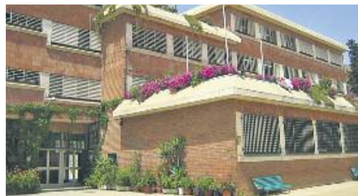
L'escola Pere Lliscart tindrà un grup més de P3.

En el conjunt de la ciutat s'ofriran 54 grups de P3 per al curs vinent, tres més que en l'actualitat. L'escola concertada manté els 39 grups, així com als centres de Secundària.