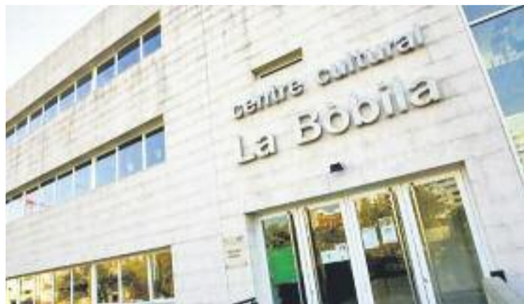
Les activitats s'allargaran fins al 4 de març.

Fins al 29 de febrer la biblioteca també acull la mostra Assassins nats , que recorre els personatges que amaguen la seva part fosca sota una màscara d'honorabilitat. Fins a finals de mes també es podrà visitar l'exposició La novel·la policíaca històrica , la qual recorre la història d'aquest subgènere literari a par-