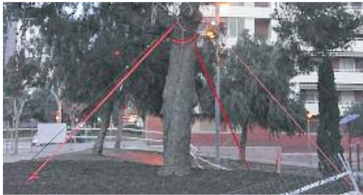
L'arbre, de moment, s'aguanta amb cordes perquè no caigui.