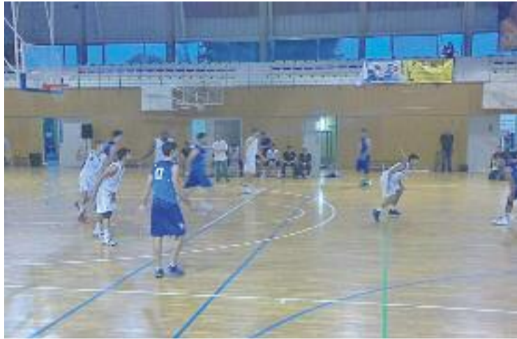
El CB l'Hospitalet va guanyar els 18 partits de la primera fase.

Els dos conjunts riberencs formen part del grup C-1, on hi són els cinc millors classificats dels dos grups de la primera fase, el C-A i el C-B. CB Igualada, CB Santfeliuenc i BBA Castelldefels són els tres conjunts que van coincidir amb els hospitalencs a la primera fase, però el sistema d'EBA fa que els resultats obtinguts en aquest tram s'arrossequin al segon. D'aquesta manera, Hospi i Aracena jugaran anada i tornada contra els equips de l'altre grup, que són, en