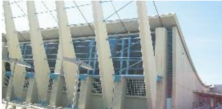
El serial del Manzano viu un nou episodi amb la moció de gener.

L'estudi que es durà a terme estarà basat en els informes de la Intervenció General i la resta d'àrees que tenen competència sobre el control i la fiscalització del poliesportiu. A més d'aquest punt, el Ple també va aprovar que tots els grups municipals "siguin coneixedors d'aquest informe, de les mesures que s'adoptin i les que es proposin".