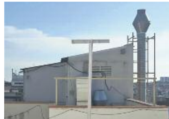
Imatges del dia del desmantellament de l'antena (esquerra) i de com ha quedat el terrat (dreta).

criu el procés per retirar aquesta antena que no complia amb la normativa com a "complex".