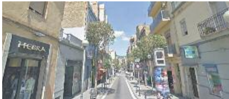
El projecte té incidència a Collblanc-Torrassa.

SOLIDARITAT ▶ Quatre centres educatius de Collblanc-Torrassa s'han adherit al programa 'AMPAs Endavant', el qual té per objectiu revitalitzar el comerç del barri, a més d'ajudar les famílies més desfavorides econòmicament. Les associacions que hi participen són les de l'Ernest Lluch, Sant Ramon Nonat, Sant Jaume FEP i la Casa del Parc.