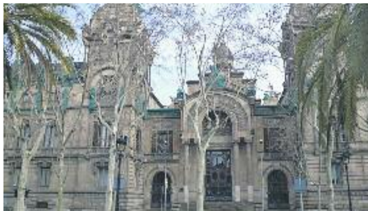
El judici va arrencar el passat dia 12 a l'Audiència.

La banda s'havia construït d'acord amb una jerarquia molt