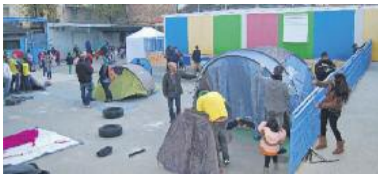
Acampada del desembre per demanar el nou edifici.

Aquestes mateixes fonts, tanmateix, eviten donar un termini per a la construcció de l'escola i