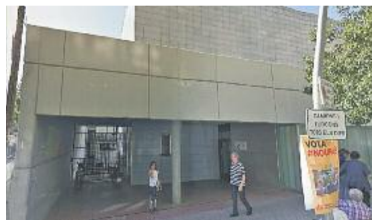
L'estudi s'ha dut a terme al CAP Pubilla Cases.

Segons es desprèn de l'estudi, la depressió s'associa a variables mèdiques com haver patit un càncer o la hipertensió arterial. També s'han de tenir en compte factors nutricionals i socials, com per exemple, la manca d'activitats d'oci.