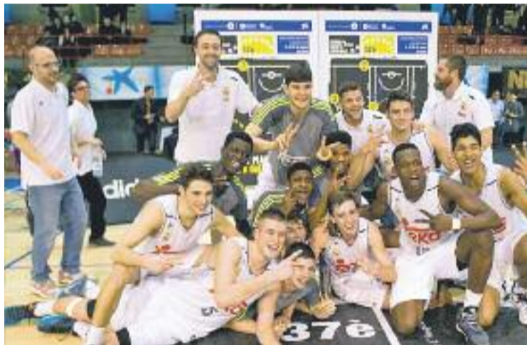
L'equip blanc va guanyar el títol per desè cop.

Els blaugrana van tornar a connectar-se al partit després del descans. Martínez i Aleix Font do-