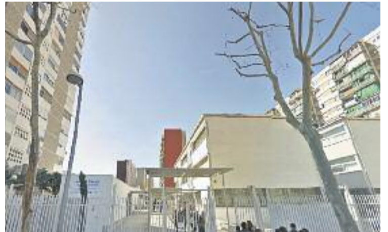
Entrada de l'IES Europa.

Per altra banda, l'Institut de Bellvitge participarà també en un estudi de l'Observatori contra l'Homofòbia, segons informa LH Digital. L'objectiu de la iniciativa, a càrrec de la facultat de Psicologia de la UAB i l'Ajuntament, és analitzar l'assetjament homòfob que existeix a les escoles. La metodologia consistirà en tests anònims als alumnes.