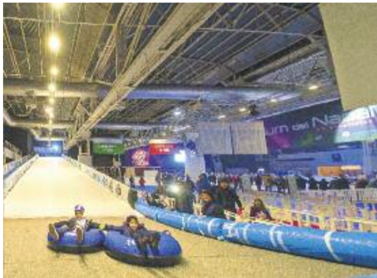
Més de 200.000 persones han visitat la pista, segons el consistori.