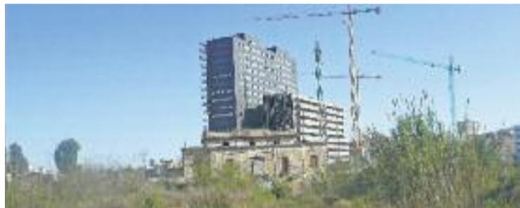
El consistori ha descartat que l'hotel s'instal·li a Can Rigalt.