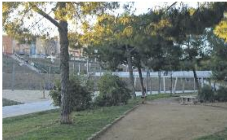
L'ampliació on abans hi havia el nucli de la Fonteta.

Pel que fa als horts socials, n'hi ha una quarantena. Cada parcel·la ocupa 35 metres quadrats de superfície, les quals s'oferiran a entitats i col·lectius so-