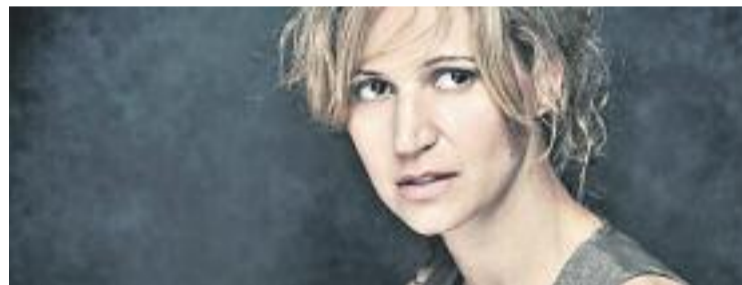
L'actriu Sílvia Bel participarà en una taula rodona. Foto: Sílvia Bel

També s'assessorarà sobre projectes de cinema, a més d'organitzar-se un esdeveniment sobre màrqueting i distribució, entre altres.