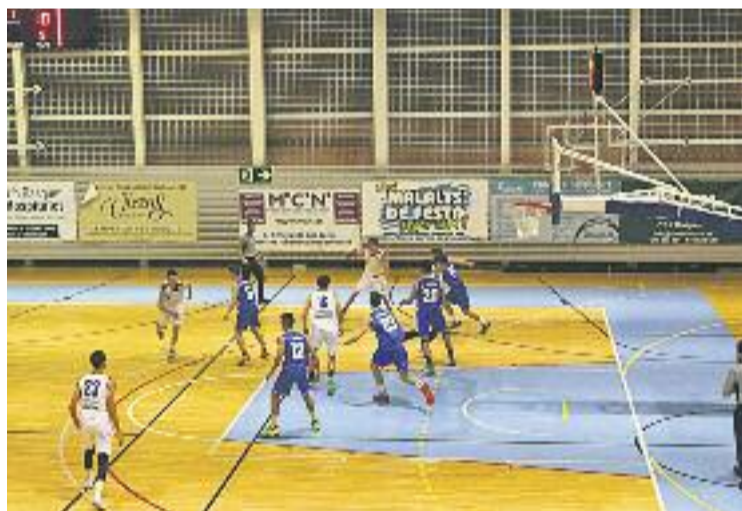
El BBA Castelldefels va ser l'última víctima del CB l'Hospitalet.