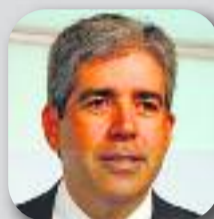
FRANCESC HOMS Democràcia i Llibertat

"El que acredita que el procés va en serio és que hi som nosaltres"