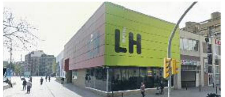
Edifici dels mitjans de comunicació municipals.

RESOLUCIÓ ▶ El Consell d'Administració de la Farga, en la seva darrera sessió, va instar l'Ajuntament a concloure el procés de nomenament del director dels mitjans de comunicació públics —que gestiona aquest ens—, a més de "donar-se per assabentat" de la moció sobre la reformulació dels mateixos, aprovada al Ple el passat 27 d'octubre.