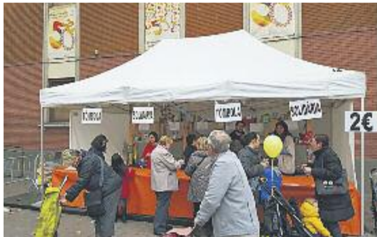
Un moment de la celebració.

Les activitats es van emmarcar sota el títol de Fem barri, fem La Marató 2105 . És el sisè any consecutiu que els veïns i veïnes de Santa Eulàlia s'aglutinen per col·laborar amb la jornada solidària, amb el suport de l'Ajuntament. L'objectiu era recaptar fons per a La Marató, enguany entorn de la diabetis i l'obesitat, del 13 de desembre.