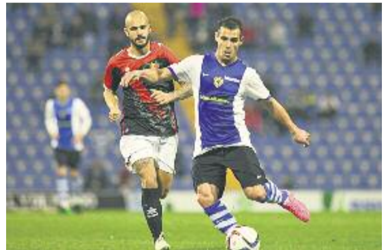
Els ribere-ncs van caure al José Rico Pérez.

Després de sumar 21 punts en 17 jornades, els homes de Cifuentes són més a prop de la zona baixa que no pas de les posicions que permeten lluitar per l'ascens a la Lliga Adelante.