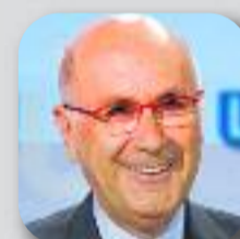
JOSEP A. DURAN I LLEIDA Unió Democràtica

"El 20 de desembre és el nostre gran moment pel canvi i ho hem de fer junts"