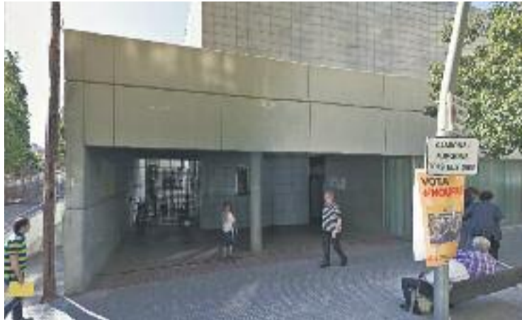
El CAP La Bòbila atén usuaris de diversos barris.

De fet, el passat mes d'octubre el Servei Català de la Salut (CatSalut) va posar en marxa les obres d'adequació del CAP de Bellvitge, on s'haurien de traslladar els actuals serveis de rehabilitació del municipi gestionats per l'Institut Català de la Salut (ICS), és a dir, el CAP de la Bò-