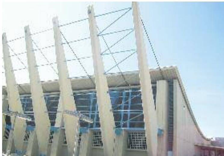
El serial per l'escàndol del Sergio Manzano segueix.

Davant d'aquest escenari, el grup municipal d'ERC ha criticat