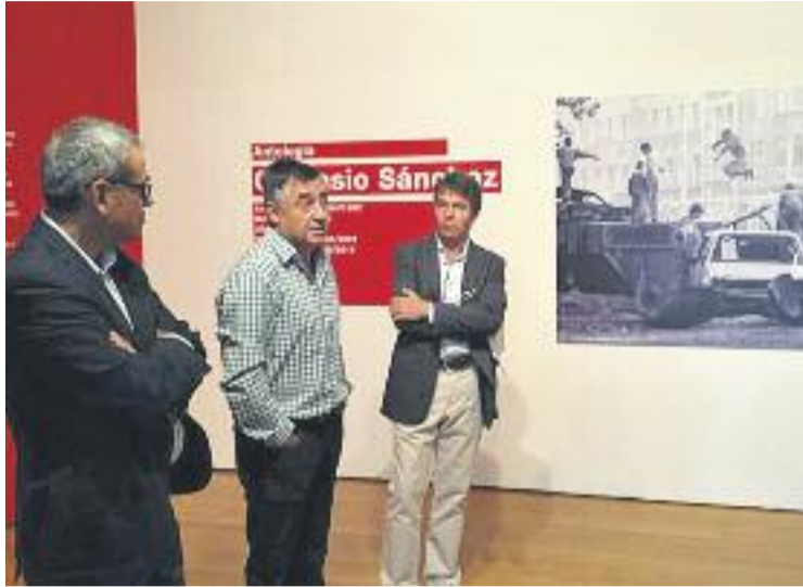
Una imatge de l'acte.

Les entitats solidàries del Districte I van celebrar el passat cap de setmana les quartes Jornades Sol'Hidàries a la Rambla Just Oliveras. Durant els dos dies, associacions solidàries del Centre, Sant Josep i Sanfeliu van recollir joguines, taps i diners que es van destinar a la Marató de TV3.