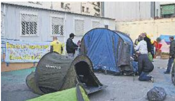
Famílies durant l'acampada a l'escola.

Ara han dit "prou". "Tots els nens i nenes tenen dret a créixer en un ambient educatiu com cal", reclamen. "Fa cinc anys