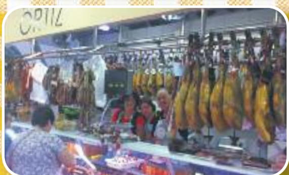
PARADA 4 TEL. 93 372 98 51