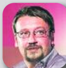
XAVIER DOMÈNECH En Comú Podem

"El 20 de desembre és el nostre gran moment pel canvi i ho hem de fer junts"