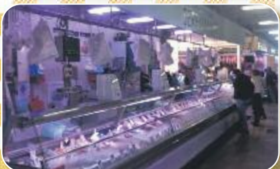
PARADA 12 · TEL. 93 473 96 77 www.servemar.es