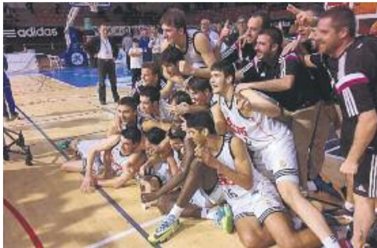
El Madrid defensarà el títol aconseguit aquest any.

Els millors equips sub-18 del continent lluitaran per endur-se un dels campionats més prestigiosos del circuit Euroleague Basketball Adidas Next Generation. A més dels amfitrions, Barça, Penya, Reial Madrid, Baloncesto Sevilla, Olimpija de Ljubljana, Maccabi de Tel-Aviv i Brose Baskets Bamberg desplaçaran el bo i millor dels seus planters