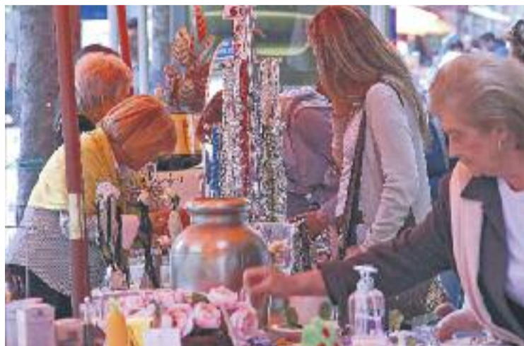
Els comerciants de la ciutat organitzen diversos actes.

El Tió popular també és un element que no pot faltar per aquestes festes. El proper dissabte 19 de desembre s'instal·larà un al mercat de La Florida; el dimarts 22 de desembre ho farà a la plaça de Pius XII, a càrrec del