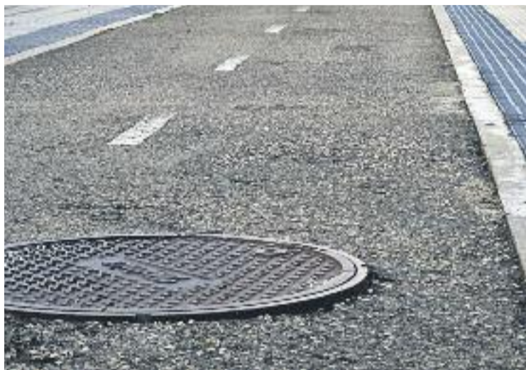
Les obres han tingut un cost de 12 milions d'euros.

ALTRES BARRIS ON S'HA ACTUAT La renovació de la xarxa de clavegueram ha afectat també als