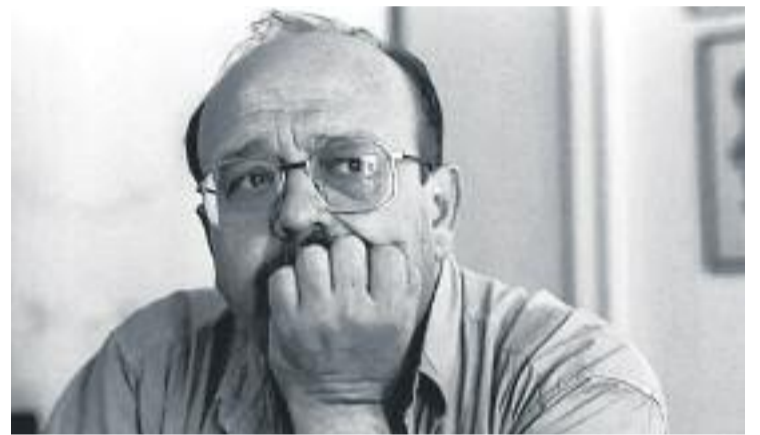
La Bòbila ha acollit tres jornades dedicades a l'autor.