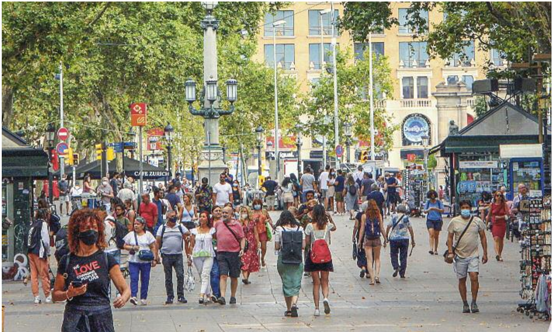
Un avantatge de la renda és que permet evitar l'estigmatització dels perceptors.

» Es farà una prova pilot durant dos anys per veure com es podria aplicar a tota Catalunya aquesta ajuda universal, individual i no condicionada a cap requisit