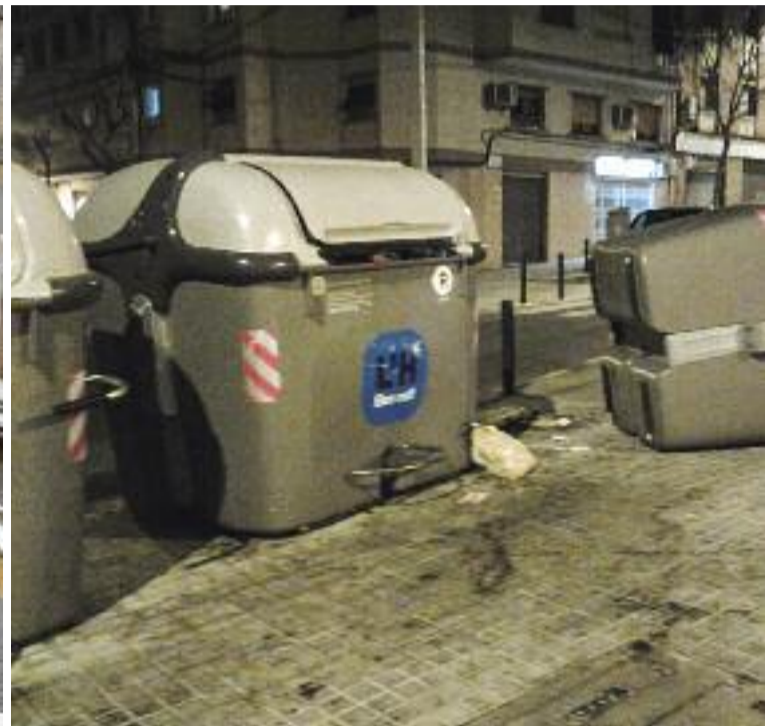
Dues imatges del carrer Laurel que exemplifiquen les queixes veïnals.

La qüestió va ser debatuda al Ple de setembre, arran de la presentació per part del PP d'una moció que reclama més agents de policia al barri. “La Florida s'ha convertit en els últims anys en una de les zones més conflictives del municipi”, va etzibar la portaveu popular, Sonia Esplugas.