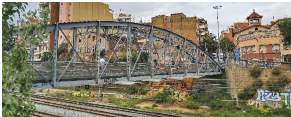
El pont que uneix Santa Eulàlia i la Torrassa és diàriament transitat per centenars de veïns.

Des de l'Ajuntament argumenten que l'estructura “és perfectament segura” i informen que s'estan portant a terme “petites accions de manteniment” prèvies a l'elaboració d'un pro-