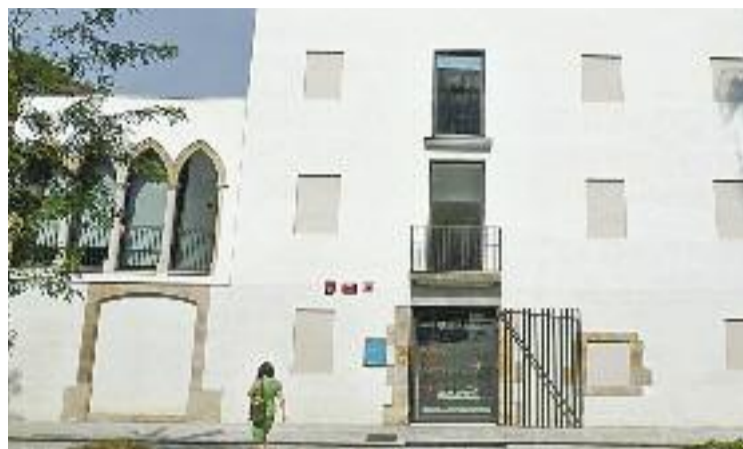
El CAID està ubicat a la masia de Can Colom.

Durant la pandèmia, el CAID va atendre unes 1.800 dones, un 40% de les quals acudien per primer cop al centre. “Pensa que durant mesos hi va haver dones tancades a casa amb el seu agres-