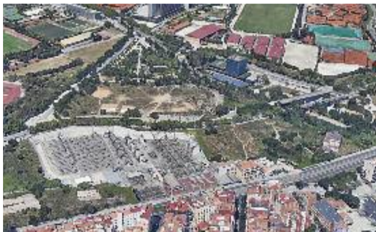
Vista aèria dels terrenys de Can Rigalt.

A priori, la possibilitat de fer l'ampliació del Clínic a l'àmbit de Can Rigalt lliga amb el projecte de pol esportiu i sanitari que l'alcaldessa Núria Marín vol impulsar en aquesta zona. Des de l'Ajuntament han comentat a aquesta publicació que no han rebut cap proposta oficial del Clínic, però a ningú se li escapa que la possibilitat d'ampliar l'hospital barceloní a l'àmbit de Can Rigalt seria benvinguda pel govern local, ja que encaixaria amb