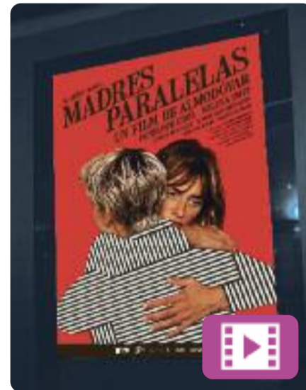
Madres paralelas Pedro Almodóvar

Dues dones coincideixen a l'habitació d'hospital on han de parir. Totes dues són solteres i es van quedar embarassades accidentalment. La Janis (Penélope Cruz), de mitjana edat, no se'n penedeix i està exultant. L'Ana (Milena Smit), una adolescent, està espantada, penedida i traumatitzada. La més gran intentarà animar la jove i crearan un vincle molt estret.