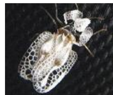
El molest insecte.

SALUBRITAT ▶ Alguns veïns de la zona de la Rambla Just Oliveres van alertar a mitjans de l'estiu l'alta presència d'un insecte molt petit i relativament poc conegut, el tigre del plataner ( corythuca ciliata ), que té especial predilecció per adherir-se a les peces de roba.