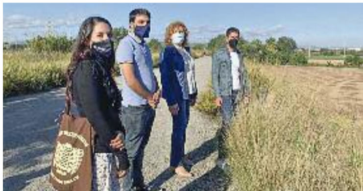
Els comuns a Cal Trabal explicant el darrer episodi judicial.

L'escrit de la providència de l'alt tribunal, al qual ha tingut accés Línia L'H , destaca que la