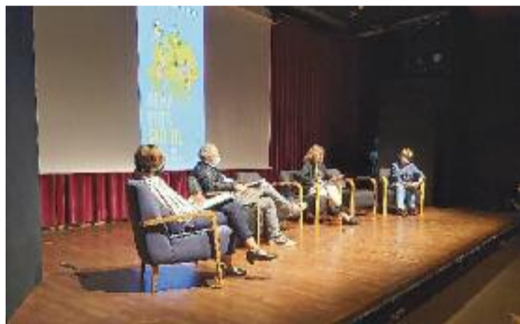
La trobada es va celebrar a l'Auditori Barradas.

Els professionals van reconèixer que el confinament va perjudicar tothom, però més directament els malalts afectats per trastorns mentals. El distanciament social imposat va impedir un seguiment cara a cara de les malalties en un àmbit en el qual