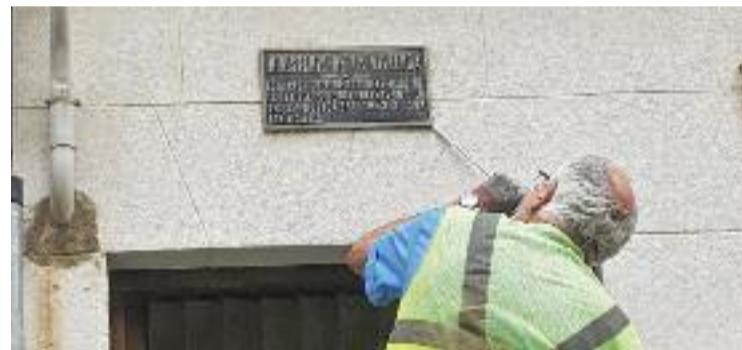
La retirada no suposa cap cost per a la comunitat de veïns.