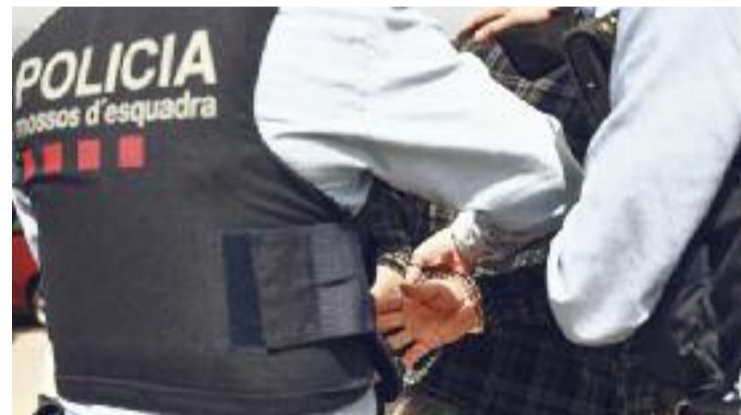
Un dels implicats a la baralla es va entregar hores més tard.

La plataforma No Més Blocs celebra la notícia i destaca que estan atents a la nova proposta de PDU: "Ens trobaran al davant".