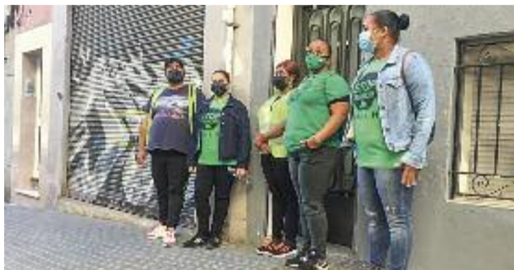
Concentració al carrer Aigües del Llobregat.

Segons publica LH Digital, l'Ajuntament i la Generalitat estudien si aquestes famílies po-