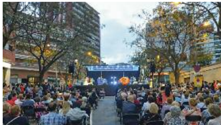
El Fòrum, a l'avinguda Masnou.

L'import màxim de la renda mensual s'ha d'ajustar, això sí, a l'índex de referència de la Llei 11/2020, de 18 de setembre, aprovada pel Parlament l'any passat per regular l'augment de les rendes.