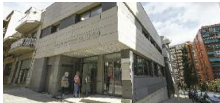
L'equipament està ubicat al carrer de la Carpa.

EQUIPAMENTS ▶ Estava previst que obrís les portes l'any passat, però la pandèmia va obligar a posposar la seva posada en funcionament. Ara, els veïns han pogut veure com és per dins el casal de gent gran de Can Serra, un equipament llargament esperat i reivindicat en un barri on viuen prop de 3.000 persones que tenen més de 65 anys.