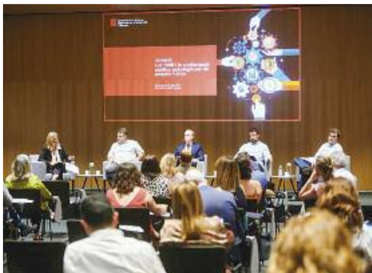
Jornada de les PIME i la contractació pública.

En aquest sentit, tot i que la covid-19 ha fet estralls en l'economia, no ha afectat especialment l'adjudicació de contractes a les PIME. I és que, tot i que se'n van adjudicar menys que el 2020, la mitjana de contractes adjudicats s'ha mantingut respecte els darrers cinc anys. Una xifra que cada vegada se situa més lluny de la dels contractes que s'adjudiquen a les grans empreses, que l'any passat només s'emportaven el 26% del total d'adjudicacions. Ara bé, per un import de més d'un bilió d'euros,