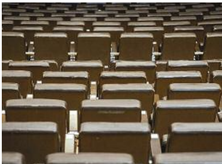
La Generalitat millorarà els equipaments culturals.

Entre les línies d'actuació principals, destaca la millora de l'accessibilitat dels equipaments i la fixació d'un percentatge mínim de representacions amb audiodescripció i subtitulació, i la transició cap a la sostenibilitat dels equipaments. Això pel que fa a la millora dels espais. Mentre que pel que fa a les accions que han d'impulsar la cultura en si mateixa, es donaran subvencions a aquelles actuacions que tinguin perspectiva de gènere, es donarà suport als projectes culturals dels joves, s'impulsaran les