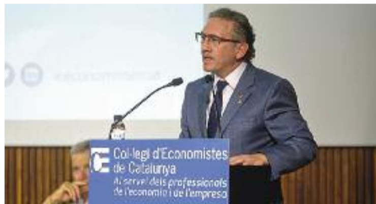
El conseller Giró presentant el pla d'ajudes.

Per això, els beneficiaris seran de tots els perfils. Principalment, persones desocupades, però també joves, adolescents, infants i famílies, i empreses, pimes i autònoms. En aquest darrer cas, per ajudar-los a adaptar-se "als nous reptes globals", diuen des de la Generalitat. Diferents col·lectius que ara ho tindran una mica més fàcil per cobrir les seves necessitats i que podran començar a demanar aquestes ajudes, sempre que compleixin els requisits, a partir de l'any que ve.