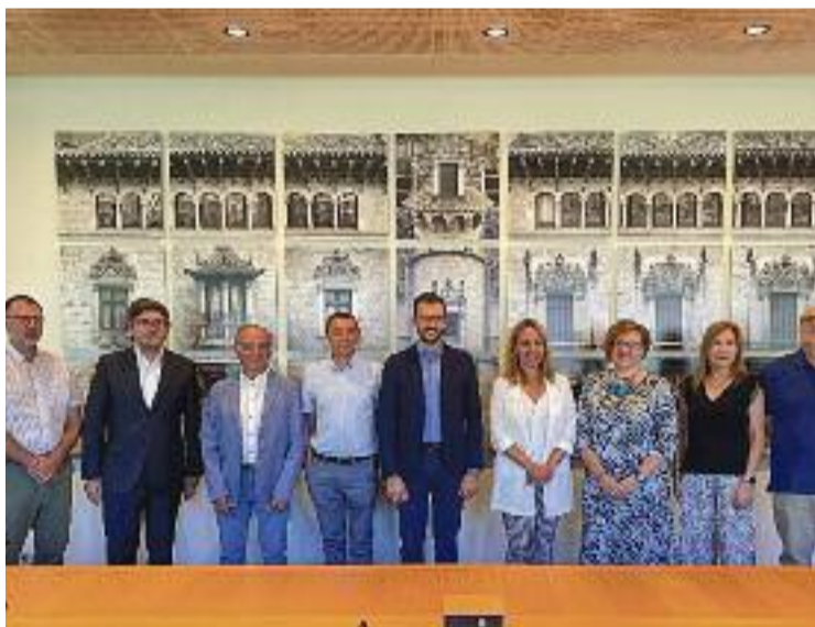
Imatge de la signatura de l'acord de col·laboració.