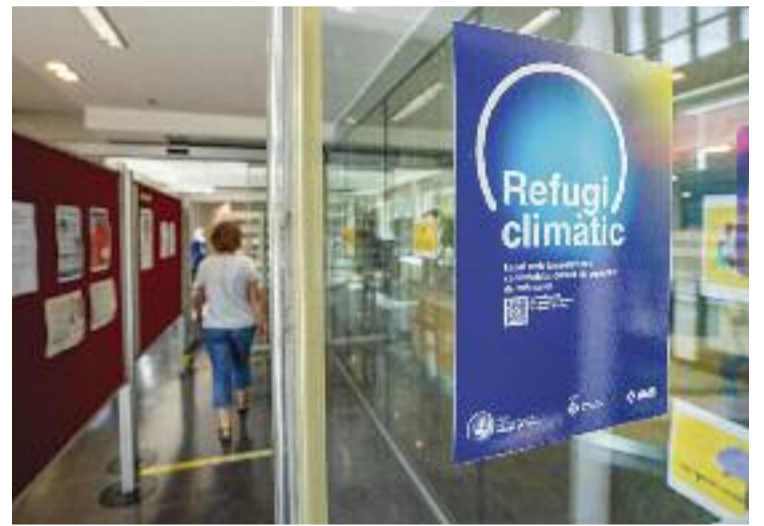
La Biblioteca Elisenda de Montcada i Reixac.

L'AMB duu a terme tallers per a persones de més de 65 anys per explicar l'impacte del canvi climàtic sobre la salut i s'informa com suportar la calor.