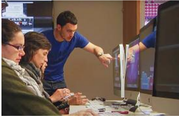
Un dels cursos formatius de la Diputació.

Els CLSE van atendre l'any 2021 a 57.780 persones emprenedores i van assessorar gairebé 47.200 empreses. D'entre els principals serveis oferts l'any passat destaquen les 2.366 formacions empresarials a 16.500 participants, que suposen més de 10.000 hores impartides. També es van fer 2.422 accions de foment de la cultura