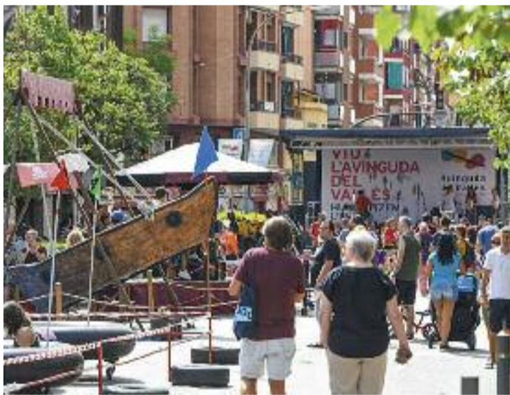
La ciutadania ocupa l'N-150 en defensa de la pacificació.