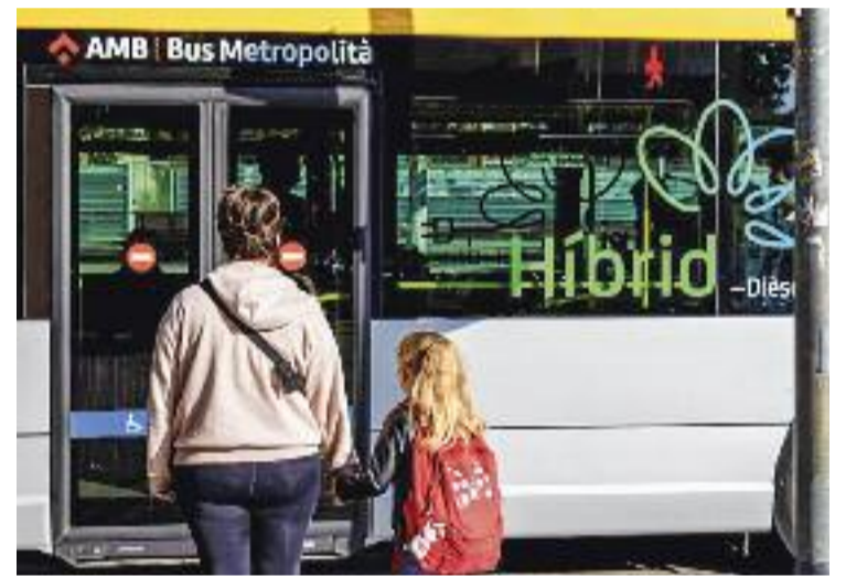
Imatge d'un dels busos híbrids en circulació.

Actualment, als serveis de Bus Metropolità de gestió indi-