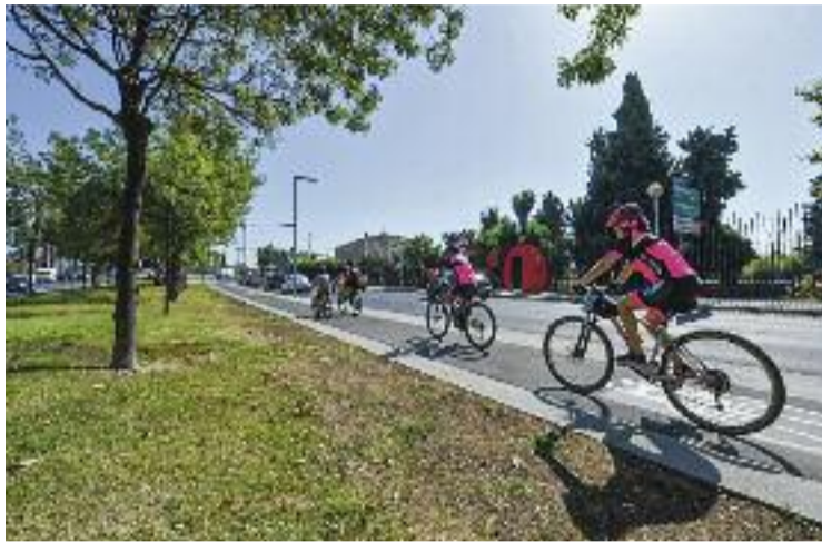
Imatge del nou tram de carril bici de l'eix Bicivia 3.

Aquesta és una de les principals connexions metropolitanas per facilitar la circulació en bi-