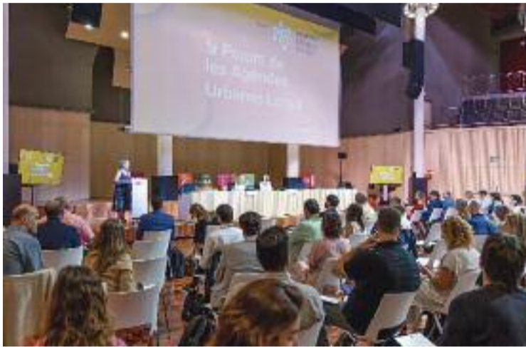
Imatge del Fòrum de les Agendes Urbanes.

Els participants van tenir l'oportunitat de conèixer les experiències d'altres territoris, i així descobrir una visió variada sobre la implementació d'es-