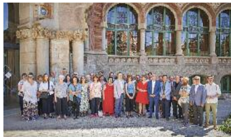
Una cinquantena de professionals han creat aquest pla.

L'objectiu final de tot això, però, és redactar un document que marqui quines han de ser les prioritats del sector públic i privat per fomentar la lectura, especialment en català. Un full de ruta que reculli les necessitats i les propostes de millora, a curt i a mitjà termini, per aconseguir capgirar la situació, fer de la lectura un hàbit atractiu per a tothom i posar el sector del llibre a l'alçada del de l'audiovisual. Tot plegat, per començar a veure els resultats de tot això entre l'any 2025 i el 2030.