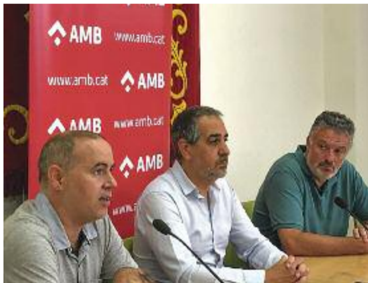
Imatge de la presentació de l'informe.