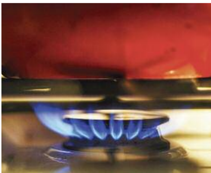
La pobresa energètica afecta una part de la població.

DESIGUALTATS ▶ El Govern va aprovar fa pocs dies el primer pas per tirar endavant un projecte de decret que té com a objectiu blindar jurídicament el reglament per combatre la pobresa energètica.