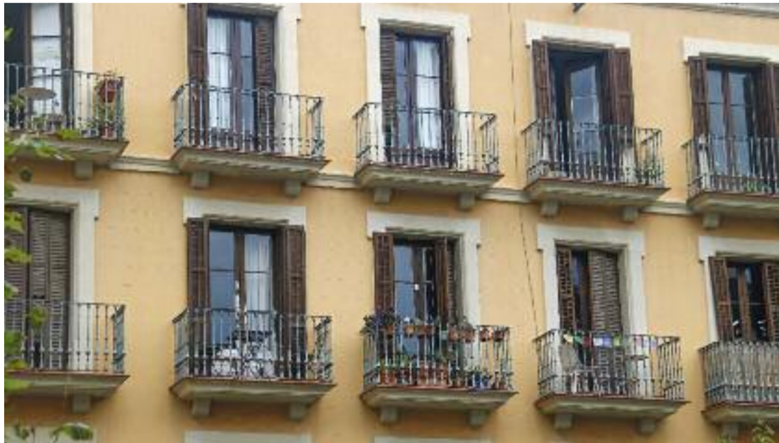
El Govern prepara un registre de grans tenidors i un altre de pisos buits.

» El Govern vol tenir més control de la realitat del mercat immobiliari » L'objectiu és tenir més eines per resoldre el problema de l'habitatge