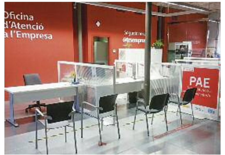
Imatge del PAE de Terrassa.

A banda, la valoració del servei per part dels usuaris és molt bona, les empreses que van utilitzar els PAE durant el segon trimestre de 2022 van valorar el servei amb un 9,71 de mitjana.