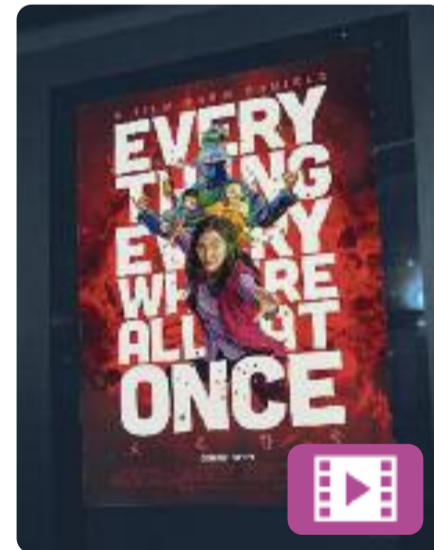
Todo a la vez en todas partes Dan Kwan i Daniel Scheinert

Quan una ruptura interdimensional altera la realitat, l'Evelyn, una immigrant xinesa als Estats Units, es veu involucrada en una aventura salvatge en què només ella pot salvar el món. Perduda en el multivers, aquesta sobtada heroïna haurà de fer servir els seus nous poders per lluitar contra estranys perills mentre el destí del món penja d'un fil.