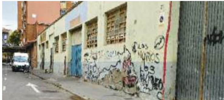
Imatge exterior de la nau ocupada al carrer Salamina.