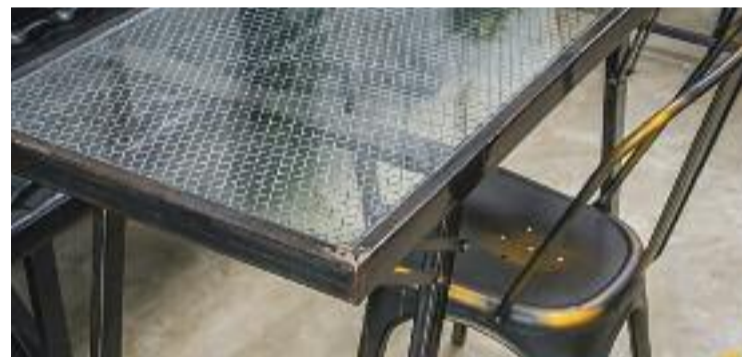
Hi ha moltes terrasses a la ciutat que incompleixen els usos.

CONVIVÈNCIA ▶ L'any passat el consistori va tramitar 142 expedients sancionadors a un centenar d'establiments de la ciutat per infraccions relacionades amb les terrasses. Ara, l'Ajuntament ha anunciat que intensificarà les accions contra els vetlladors sense llicència i que més infraccions cometen. En general estan relacionades amb molèsties al veïnat i incompliments de les condicions d'ús.