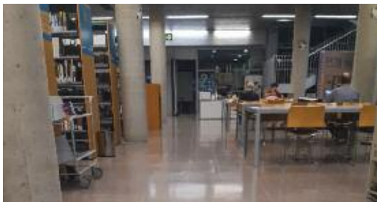
El de Bellvitge és l'únic districte que compleix amb els estàndards.

Tot i que el consistori va respondre als requeriments de la sindicatura, en el seu escrit només feia referència als motius del tancament de la biblioteca de Santa Eulàlia –problemes de seguretat i accessibilitat–, però en cap cas va deixar clar si recuperaria l'equipament. Per tot plegat, la síndica recomana