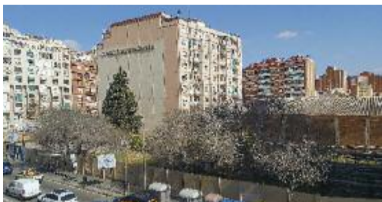
El solar on ha d'anar el centre mèdic.