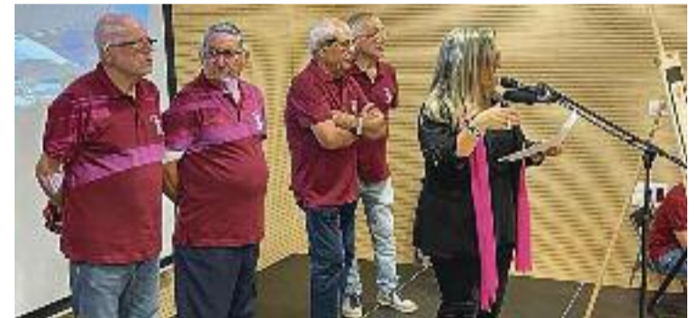
La regidora va acabar fent el pregó al Casal de Gent Gran.

Malgrat això, la regidora va expressar la seva satisfacció per haver pogut llegir el pregó a la sala del casal. "Millor escenari no vam poder tenir", va escriure a les seves xarxes socials. "I amb totes les comoditats d'un nou equipament de nivell", va afegir. No va fer cap referència a la polèmica amb la parròquia, que finalment es va sortir amb la seva.