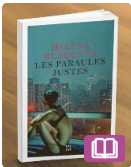
Les paraules justes Milena Busquets

La protagonista d'aquest dietari és una escriptora amb una capacitat inesgotable de renovar la seva mirada sobre el món. Directa, apassionada, intel·ligent i una mica desastre, cerca les paraules justes per capturar una realitat complexa i canviant, sense renunciar a l'elegància i a l'honestat de la concisió. L'obra més íntima i alhora vital de Milena Busquets.