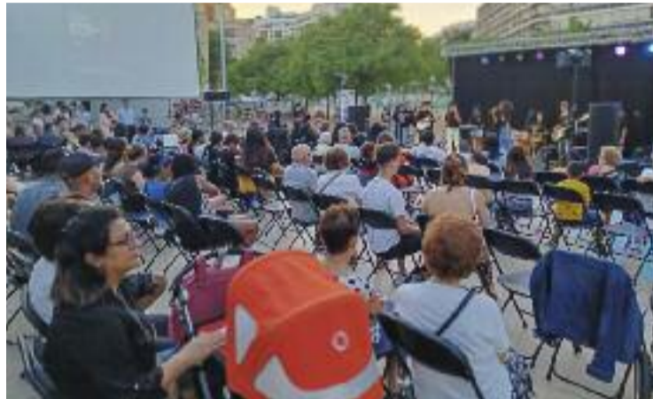
Una de les sessions del festival a l'aire lliure, el 27 de maig.

El festival s'ha celebrat a diferents equipaments i espais del districte, del 23 de maig fins al 2 de juny, quan es va celebrar l'entrega de premis al Centre Cultural la Bòbila.