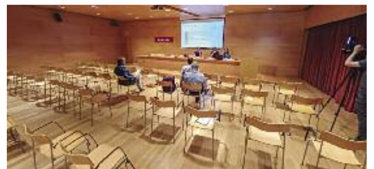
Aspecte de la presentació de les conclusions.

Sigui com sigui, el Consorci per a la Reforma de la Gran Via ampliarà el calendari de participació per aconseguir més consens ciutadà.