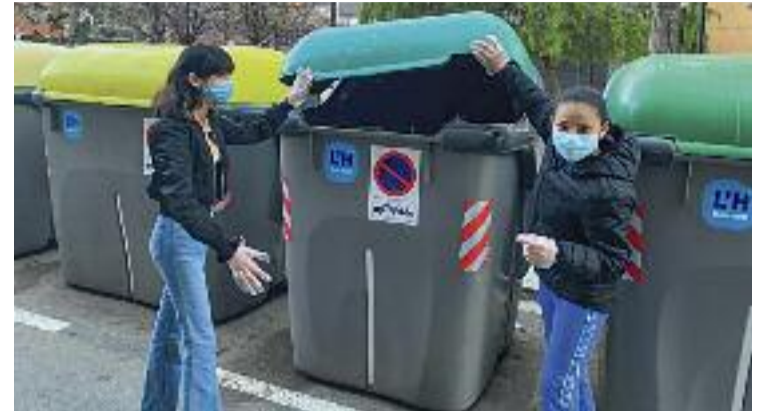
Els joves han fet propostes per fer un món més sostenible.

Sigui com sigui, Salazar recorda que situacions com aquesta són "habituals" a la ciutat. De fet, moltes de les persones que viuen a la nau del carrer Salamina havien estat desallotjades amb anterioritat d'una altra de l'avinguda Vilafranca, al barri de Sant Josep.