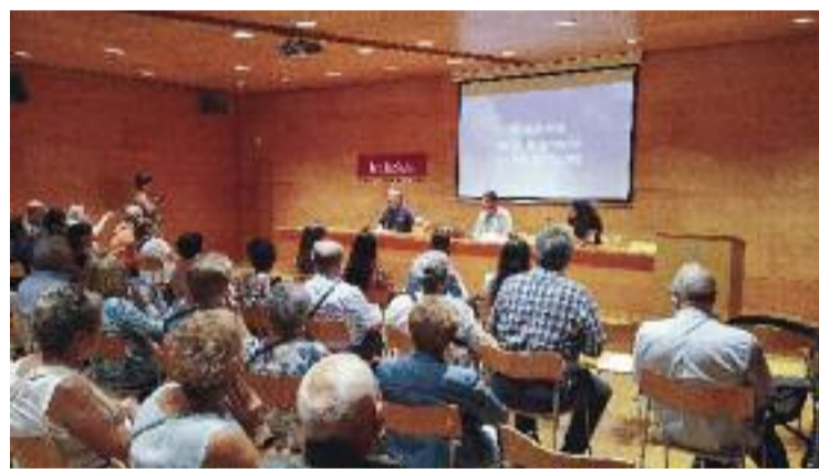
Un centenar de persones van assistir a la presentació.