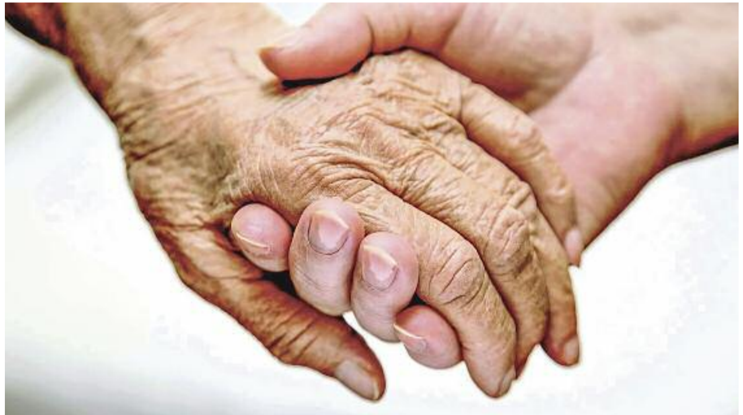
La soledat no desitjada és un dels motius que poden portar al suïcidi en la gent gran.

El mateix Quiles afirma que a la seva associació hi ha moltes persones grans que comenten les seves ideacions suïcides, i fins i tot casos de persones que acaben