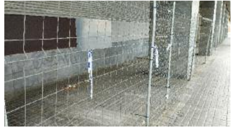
La policia ha tancat els porxos on eren els acampats.

El jurat social, per la seva banda, ha premiat Cuidate , mentre que el premi al millor curt segons els veïns ha anat a parar a Re-Animal , de Rubén Garcerà.