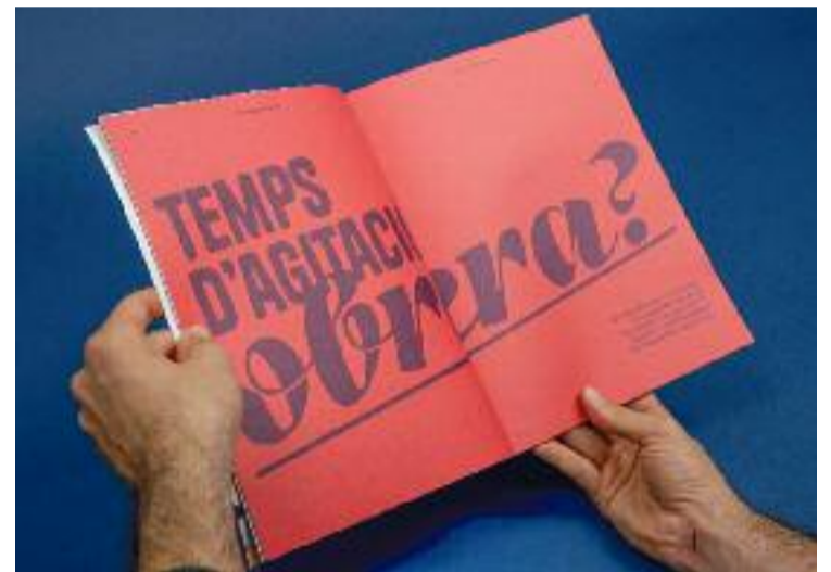
La revista es va estrenar dilluns.

Amb tot, el primer número de la revista tracta sobre el moviment llibertari de les Corts i la de l'any que ve anirà sobre la industrialització de la zona.