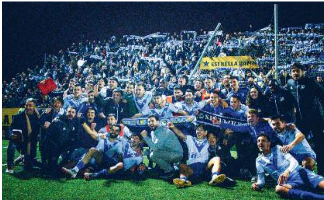
La química entre els jugadors i jugadores del CE Europa i la seva afició és absoluta.

El CE Europa-UE Sant Andreu és el clàssic entre barris per excel·lència, i continua fent història, ara a la Segona RFEF, la quarta categoria estatal. El partit de la primera volta, disputat el passat 17 de setembre, és, amb 3.840 espectadors, el segon amb més públic des de la inauguració del Nou Sardenya, el 4 de maig de