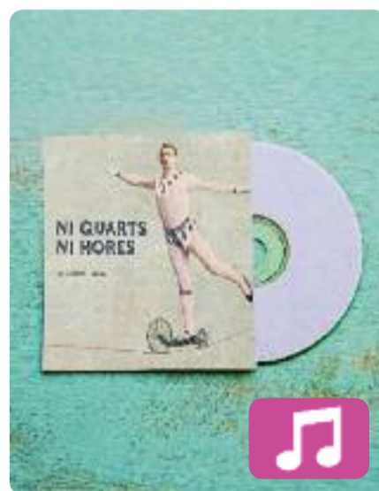
Ni quarts ni hores La Corda Fluixa

És el tercer treball del grup, en aquest cas autoproduït. Al més pur estil pop-rock, hi predominen els ritmes alegres i les lleteres senzilles en català i també en castellà sobre temes diversos, entre els quals destaca l'amor. Entre totes les cançons en resalta una dedicada al cantant de Strombers, Ferran Gallart, que moria de càncer l'any passat.