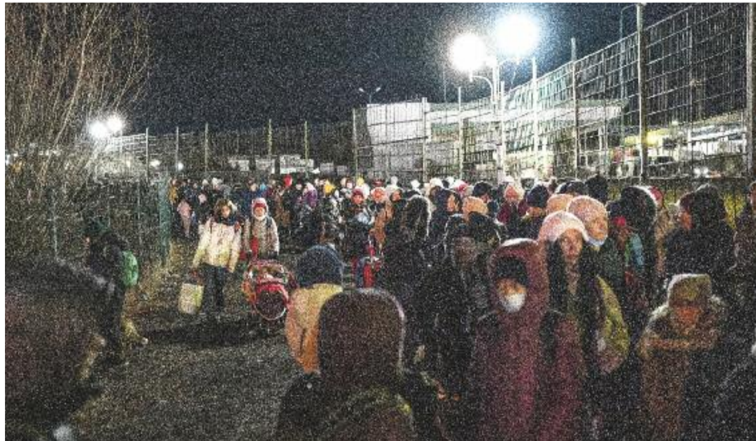
Una munió de persones a la frontera d'Ucraïna el març del 2022, fugint de la guerra.

Pel que fa a les persones refugiades ucraïneses, Catalunya és el segon territori de l'Estat espanyol, per darrere del País Valencià, en nombre de resolu-