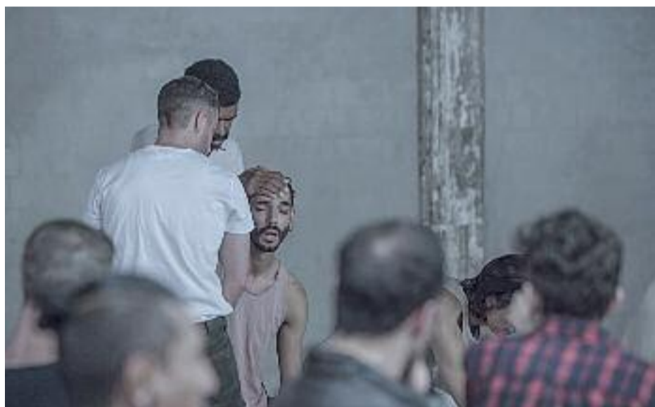
Aquest estiu el jazz i la dansa són protagonistes a les Corts, on la gent gran pot gaudir d'un casal.

► Per a molts comencen les vacances d'estiu. Els infants ja no tenen escola, els joves han acabat els estudis i alguns i algunes afortunades ja gaudeixen de les esperades vacances. Però a les Corts, aquest juliol, no ens aturem! I els equipaments municipals segueixen oferint moltes activitats, a la fresca, i ben entretingudes!