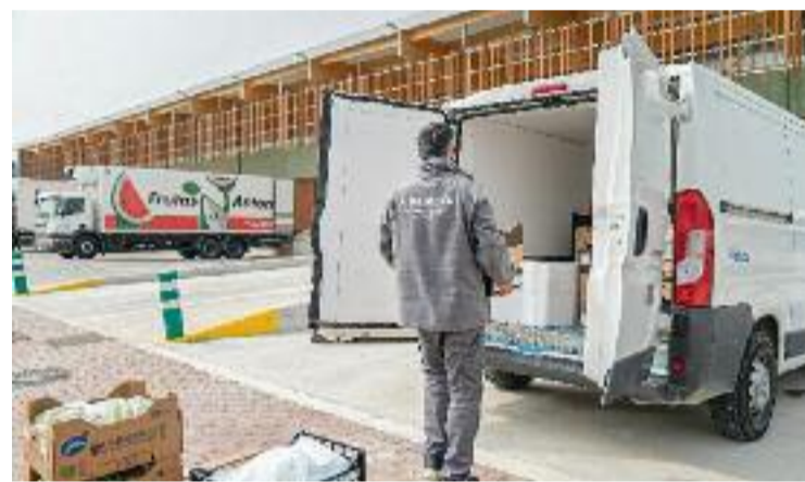
L'Ajuntament aposta pels vehicles sostenibles al comerç.

D'entrada, la prova pilot es farà al Mercat de Provençals i el consumidor, després de comprar els productes, podrà escollir si els vol rebre al seu domicili a través de mitjans de repartiment convencionals o bé a través d'un sistema de lliurament de logística verda, com s'ha anomenat als vehicles sostenibles per al comerç. Això inclourà bicis elèctriques i furgonetes elèctriques.