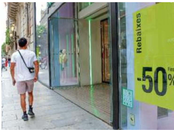
Una botiga de roba amb rebaixes.

En aquest sentit, des de Pimec Comerç asseguren que, tot i que l'1 de juliol continua sent el