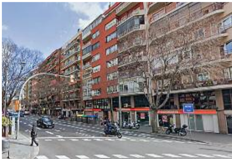
El lloguer a les Corts i a la ciutat està batent rècords.