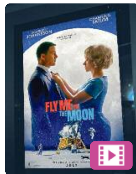
Fly Me to the Moon Greg Berlanti

La pel·lícula està ambientada en l'històric allunyatge de l'Apol·lo 11, el 1969. Està protagonitzada per Scarlett Johansson i Channing Tatum, que viuen un romanç enmig d'aquesta missió espacial. Ella és la directora de màrqueting de la NASA i ell el director del llançament, i la seva història es veurà marcada per la pressió d'evitar el fracàs de l'allunyatge.