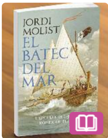
El batec del mar Jordi Molist

Es tracta d'una novel·la basada en fets reals que recrea una de les aventures més sorprenents de les croades a Terra Santa i a la guerra pel domini del Mediterrani entre França i la Corona d'Aragó. Explica la història de la Blanca, una bella dama que ho perd tot després de la derrota de la seva família. Per conservar el seu fill amb vida ha de patir els abusos dels vencedors.