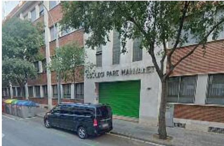
Porta principal del Col·legi Pare Manyanet.

Les afectades han constatat que aquests fets eren una pràctica habitual que va durar anys. De fet, les denunciants han de-