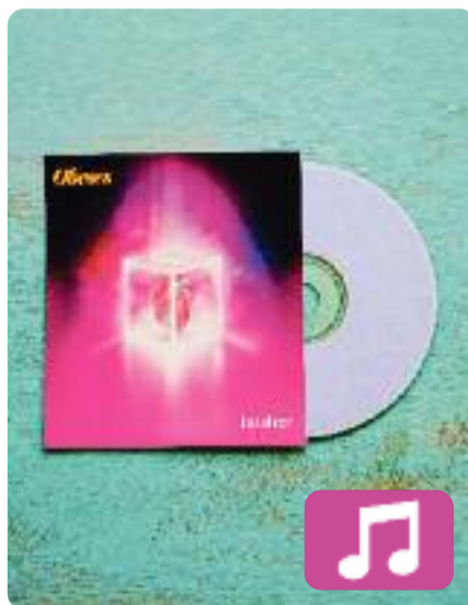
L'ai al cor Obeses

És el sisè disc d'estudi d'Obeses, amb el qual el grup retorna als seus orígens i a la música que sempre ha fet al llarg dels seus gairebé quinze anys de trajectòria. Les cançons, al seu pur estil pop-rock, parlen d'experiències passades amb gran detall en relació amb temes comuns com l'amor, la llengua, la pau, el pas del temps o la mort.