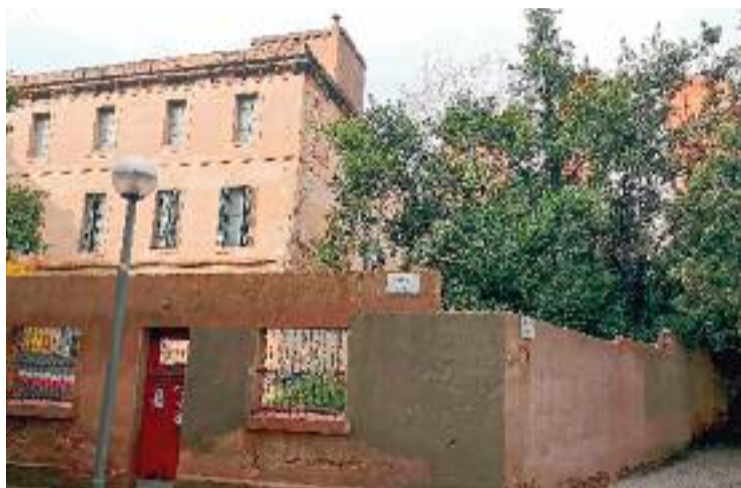
La solució definitiva per Can Capellanets està més a prop.

Per la seva banda, des de la plataforma veïnal Salvem el Patrimoni de les Corts afirmen que la sentència és una "molt bona notícia", però remarquen que són cautelosos i que continuaran lluitant "fins al final per la con-