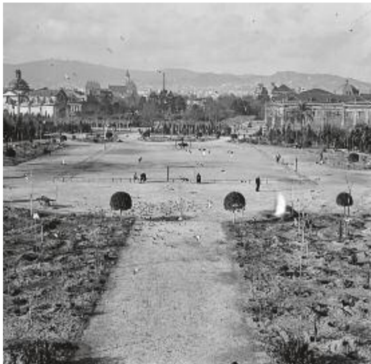
Un camp de futbol a la Ciutatella de fa uns 100 anys i Campa a l'acte que va fer fa uns dies al barri de la Sagrada Família.

El Boig de Can Fanga ha aconseguit milions d'interaccions a la xarxa social X amb fotografies molt curioses que desperten l'interès de tot barceloní –i dels que no ho són–. La gran pregunta que es fa el seu públic és com i d'on aconsegueix material tan curiós i inèdit que cap arxiu del país ha publicat. Algun exemple d'aquest impacte va ser quan va publicar una foto on es veia la bandera nazi al camp de les Corts del Barça, que va rebre un munt de visualitzacions i respostes. “Busco a arxius locals i nacionals de tot el món per aportar alguna cosa que els documentalistes d'aquí no tinguin”, diu. “He buscat a arxius d'Argentina, Alemanya, Anglaterra o Austràlia escrivint la paraula Barcelona i trobar fotos i vídeos que ningú té, tot i que a vegades són de pagament, però que pago encantat per fer públic un material amagat per a la meua audiència”, explica Campa.