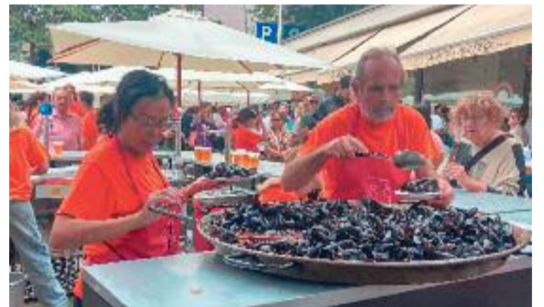
Els musclos van ser els protagonistes del Tasta'M .

La cita amb els mol·luscos ha format part de la programació de la Regata Cultural, el conjunt d'activitats organitzades per acompanyar l'arribada de la Copa Amèrica a Barcelona, que se celebrarà aquest estiu.