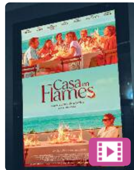
La casa en flames Dani de la Orden

El film explica la història d'una família que passa plegada el cap de setmana a Cadaqués. La mare, després de molt de temps sense veure tots els seus units, fa tot el possible perquè els problemes familiars quedin a un costat i tot surti rodó. Per fer-ho possible, però, ho haurà de cremar tot. Emma Vilarasau, Clara Segura i Alberto San Juan en són els protagonistes.