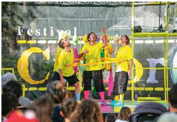
Espectacle de malabars al Circorts.