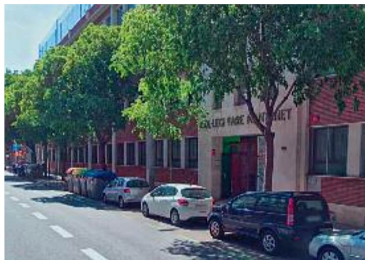
Entrada principal del Pare Manyanet, a travessera de Les Corts.

L'acció del docent es va convertir en una pràctica habitual, segons ha fet constar a la denúncia, que arriba dècades després dels abusos. De fet, la víctima no va explicar res a ningú fins que va complir 30 anys.