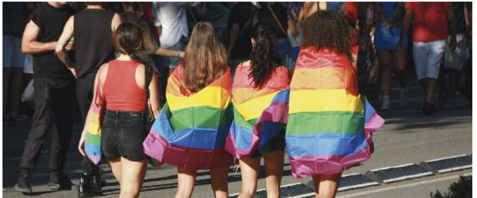
Com cada any, el 28 de juny es va celebrar el Dia Internacional de l'Orgull LGBTIQ+.

Així mateix, el col·lectiu considera que en els darrers anys hi ha hagut una visibilització més gran de les persones LGBTI i això les ha exposat més. "Si als noranta, en un