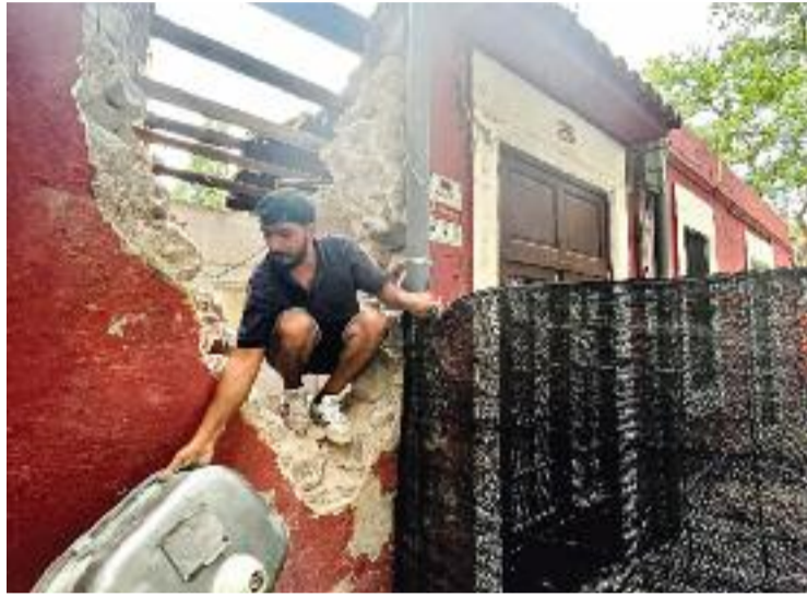
La casa singular a mig enderrocar.

Aquesta casa era un antic habitatge de finals del segle XIX, característic per les seves façanes de color grana. Allà, hi vivia una dona de 87 anys, que s'ha hagut de traslladar a un nou pis