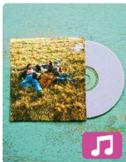
Tinc al cor el que no trobo al cap Marialluïsa

Tinc al cor el que no trobo al cap (Bankrobber) és el títol de l'EP que acaba de publicar el grup igualadí Marialluïsa i amb el qual la banda es vol acomiadar per sempre dels escenaris. Aquest últim treball discogràfic inclou sis cançons, entre les quals n'hi ha dues d'inèdites i una d'elles ha comptat amb la producció de Joan Pons, d'El Petit de Cal Eril.