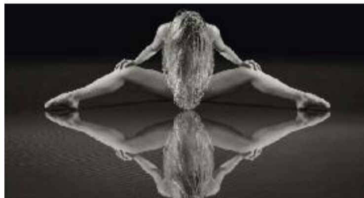
Una de les imatges de l'exposició 'L'etern femení'.

Fins ara, l'edició d'enguany ja ha ofert un taller d'exploració sensorial adreçat a dones, dues xerrades sobre la representació del desig al Japó i una entrevista a la sociòloga Júlia Sánchez, experta en educació afectiva i sexual integral. Durant el que queda de setmana, hi ha programades una xerrada sobre BDSM, una presentació via xarxes socials de la botiga eròtica Love-sexing, una xerrada sobre "intel·ligència eròtica", un recital de poemes eròtics i un taller sobre sexe en la tercera edat.