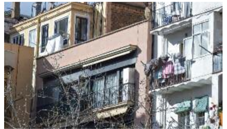
Al conjunt de la ciutat ha augmentat un 1,7%.

Entre els districtes on el preu de l'habitatge s'ha rebaixat, a més de les Corts, també hi ha Horta-Guinardó, amb un descens del 0,4%, i Sant Andreu, on s'ha produït la major caiguda, d'un 1,1%. A l'altra cara de la moneda hi ha Sant Martí, on hi ha hagut l'augment més gran del preu de l'habitatge, un 6,3%.