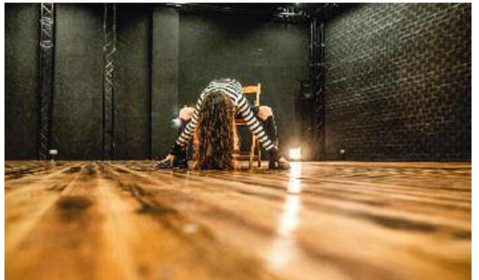
A les Corts, diferents equipaments programen activitats d'estiu i, a banda, la ciutadania també disposa de refugis climàtics.

► Arriba una època esperada per grans i infants. Els dies s'allarguen, pugen les temperatures, la canalla ja no té escola, i els qui no estan de vacances ja pensen en elles. A les tardes, els carrers i places del districte s'omplen de veïns i veïnes, però els equipaments de les Corts també ofereixen moltes activitats, a la fresca, i ben entretingudes!