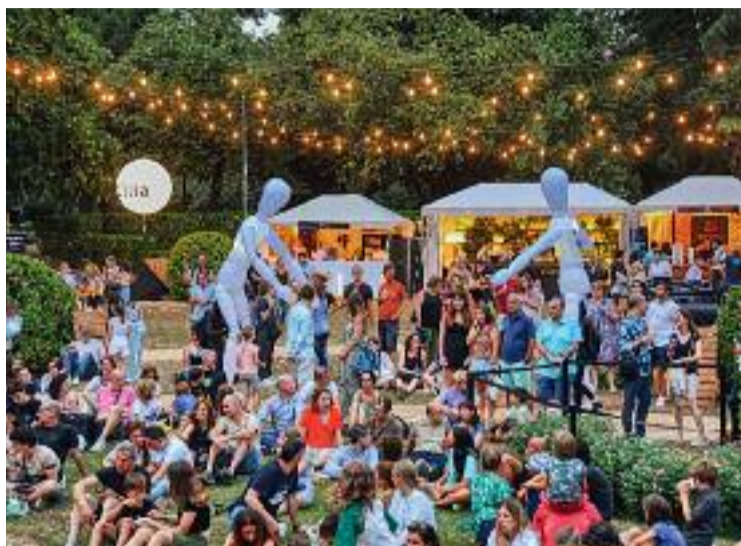
En marxa el nou festival dels jardins.

L'Associació de Veïns de Zona Universitària fa anys que denuncia que aquest esdeveniment (amb el nom i els organitzadors d'abans o amb els d'ara) "privatitza" el parc i afecta la seva vegetació, entre altres qüestions.