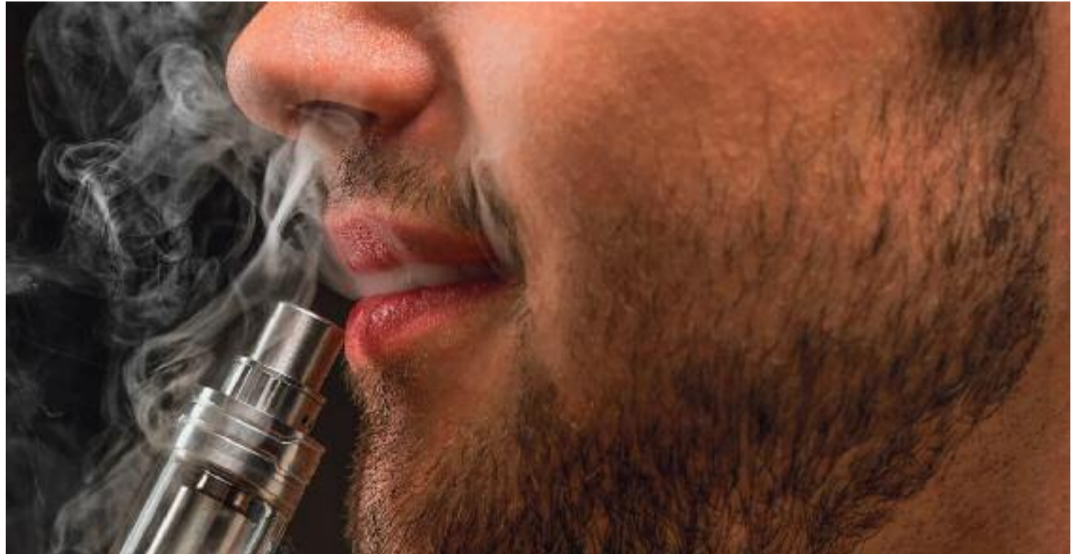
El consum de cigarretes electròniques ha augmentat entre els joves fins al punt de ser la porta d'entrada al tabac tradicional.

mador de tabac convencional, però fa uns mesos va començar a fumar vapes . "Una amiga en fuma i veus que fa bona olor, i em va venir de gust provar-ho", explica. Aquest jove relata que al principi consumia els que no tenen nicotina i sempre amb un ús recreatiu. "Ara no en faig un ús diari, però sí que en consumeixo unes tres nits a la setmana i intento no fer-ho mai de dia". Però finalment n'ha acabat comprant amb un 2% de nicotina. Tot i ser conscient dels components addictius, insisteix a definir el seu consum com el d'una catximba o pipes d'aigua.