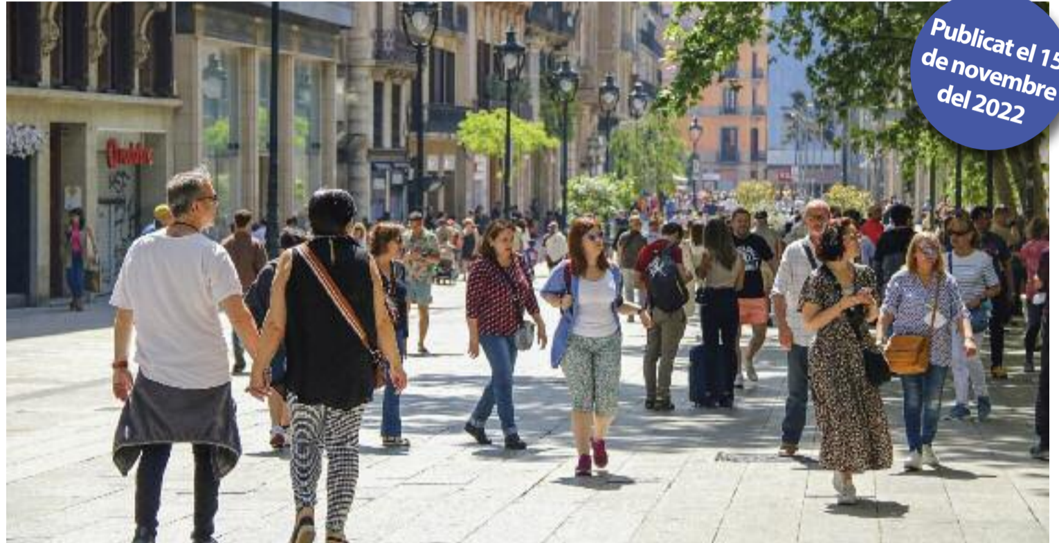
El català és la llengua minoritària entre els joves als deu districtes de Barcelona.