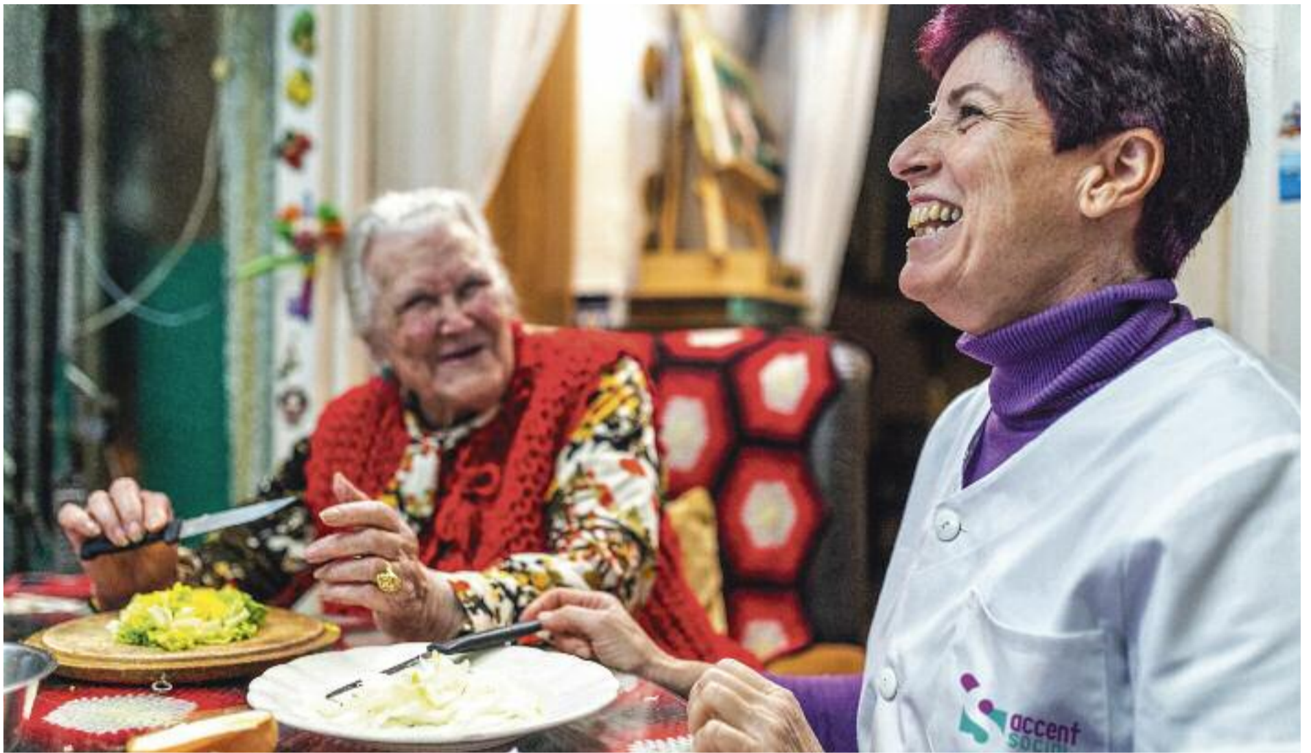
Els SAD proporcionen cuidadors i cuidadores professionals que atenen les necessitats de les persones amb dependència.

► Qui cuida la persona cuidadora? Aquesta pregunta, que ens remet a la famosa paradoxa del barber que no es podia afeitar, és la que es plantegen centenars de persones que tenen cura dels seus familiars dependents arreu del país. Es tracta de gent que dedica bona part del seu temps a cuidar els pares o parents que necessiten la seva assistència. Sovint, a costa de reduir la jornada de treball o, fins i tot, renunciant-hi, per no parlar de la manca total de temps per fer encàrrecs del dia a dia o gaudir d'un moment de lleure i desconnexió.