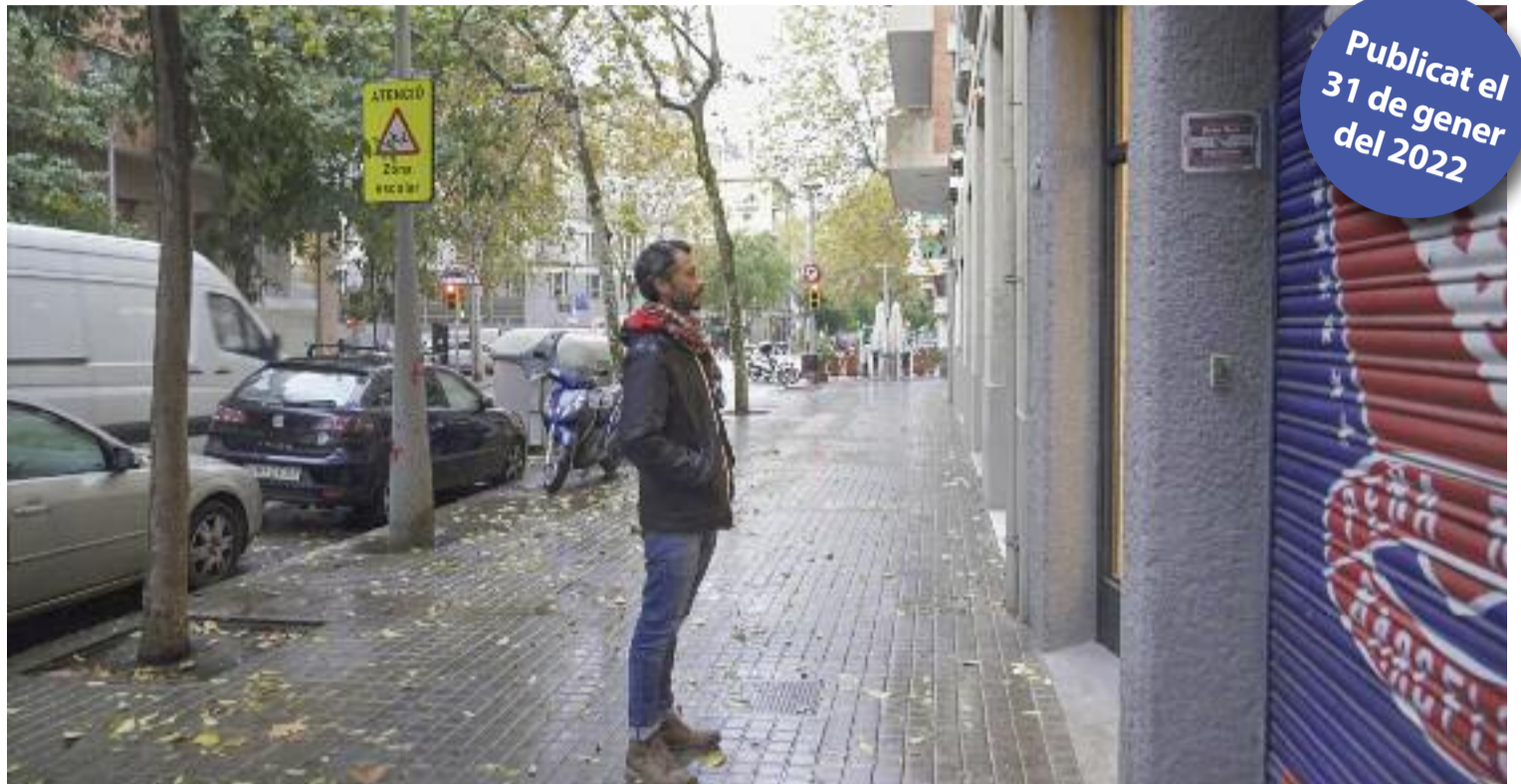
De les 350 immobiliàries incloses a l'estudi, només el 10% es van negar a excloure llogaters immigrants.

En tots els casos, això sí, es tracta d'una "pràctica a l'ombra", tal com diu la investigació.