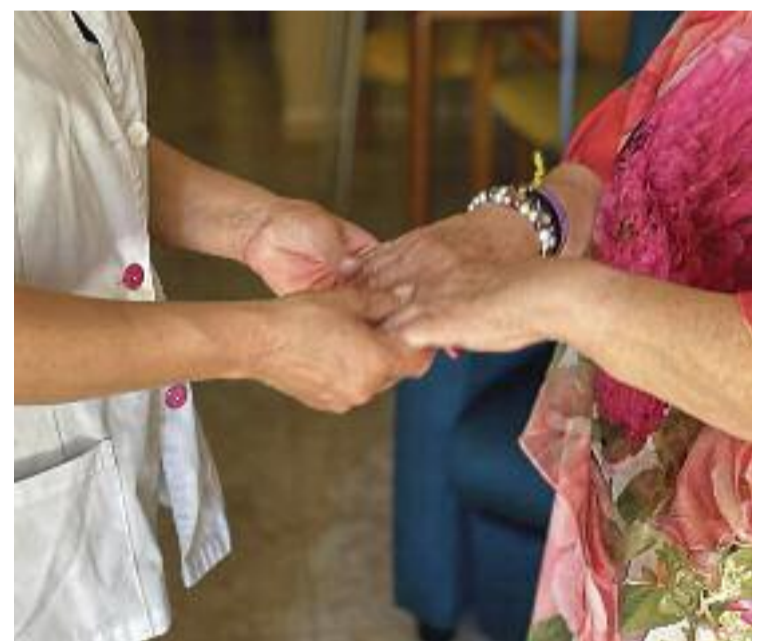
L'atenció és personalitzada, propera i empàtica.

Per tant, aquests serveis s'erigeixen en un ajut indispensable no només per a les persones usuàries, sinó també per als cuidadors no professionals, que solen ser els familiars més pro-