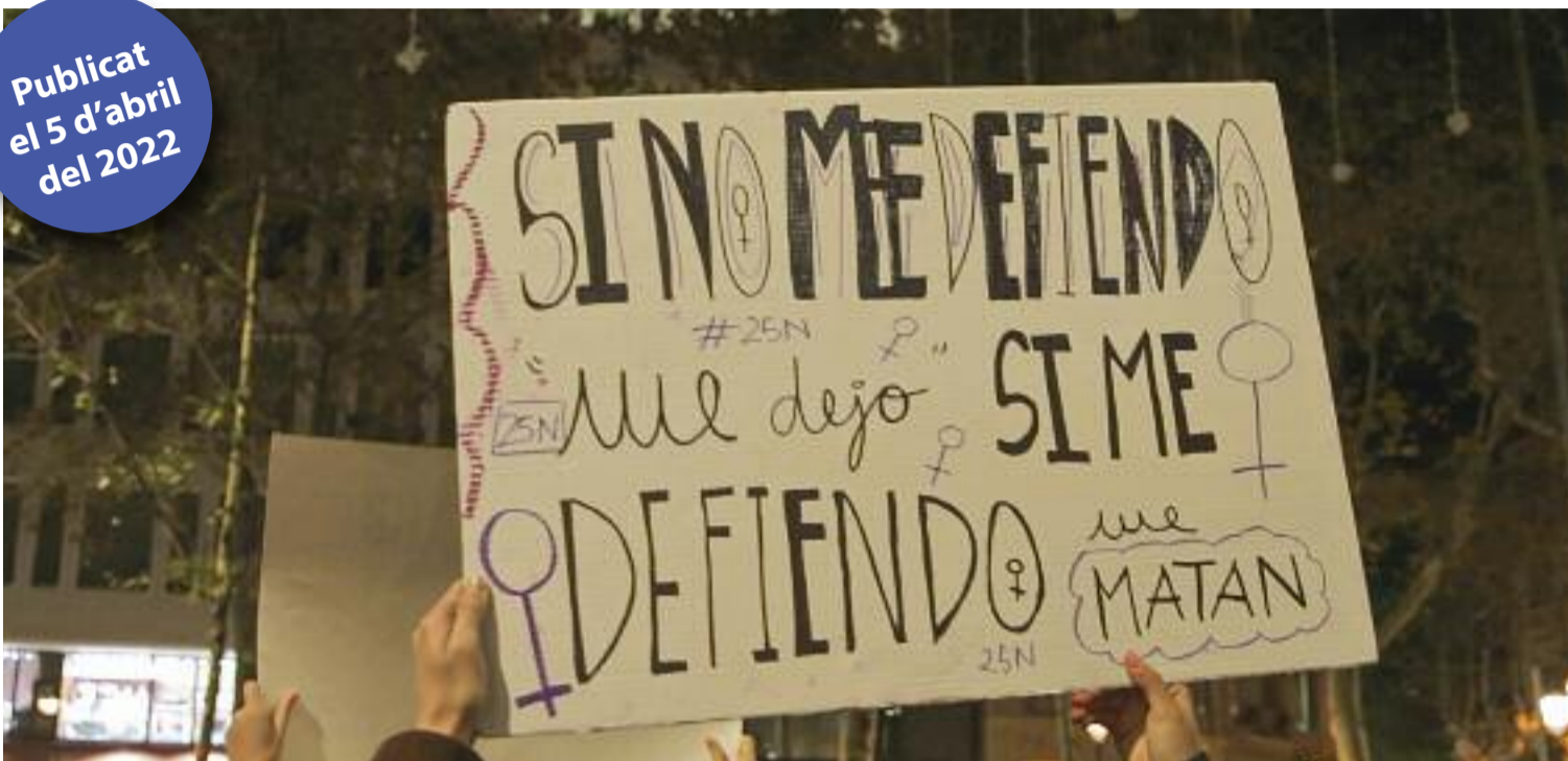
Una pancarta en una manifestació del 25N que apareix al documental 'Jo sí que et crec'.

» El documental 'Jo sí que et crec' repassa el tràngol que ve després de patir una agressió sexual » L'Ajuntament de Barcelona ha anunciat un nou servei d'atenció a la violència sexual de cara al 2024