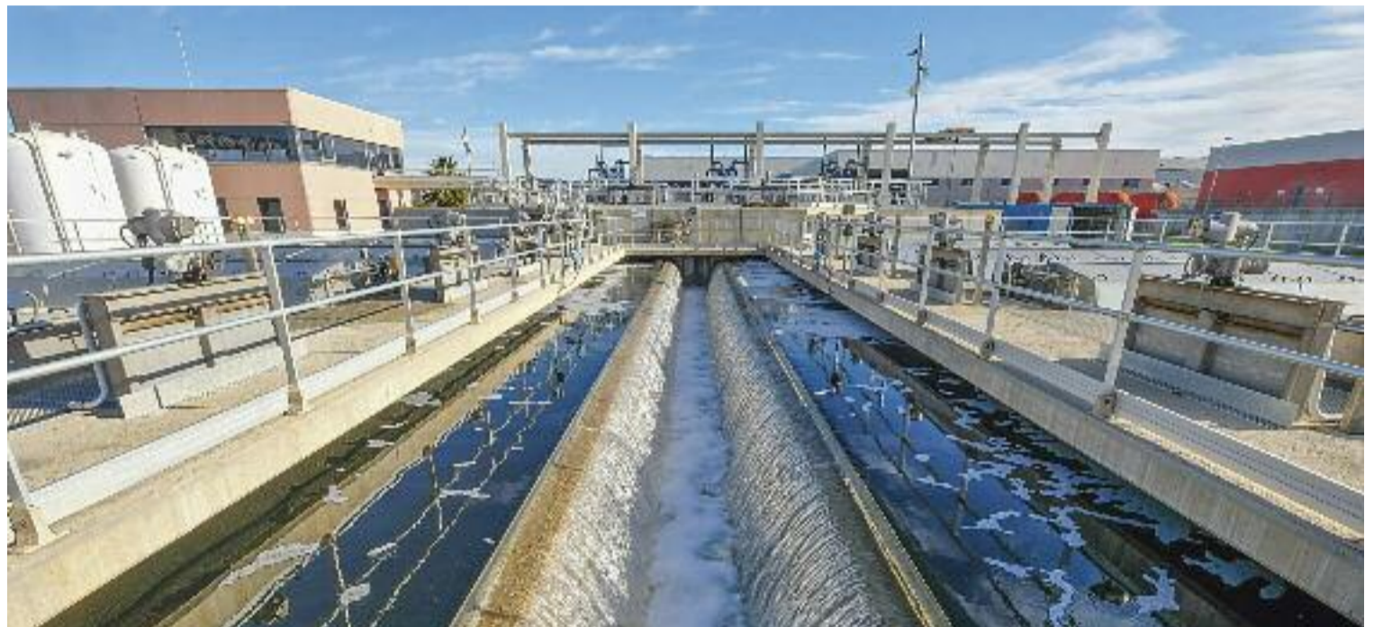
L'aigua regenerada, com la que s'obté a la depuradora del Baix Llobregat, és clau per a la resiliència de les ciutats.

Això inclou la implementació de plaques solars i pèrgoles de captació fotovoltaica a les instal·lacions de la companyia, així com la valorització dels fangs (un residu ric en matèria orgànica) generats a les estacions de depuració d'aigua, per transformar-los en ecocombustibles com el biogàs. Tres d'aquestes instal·lacions uti-