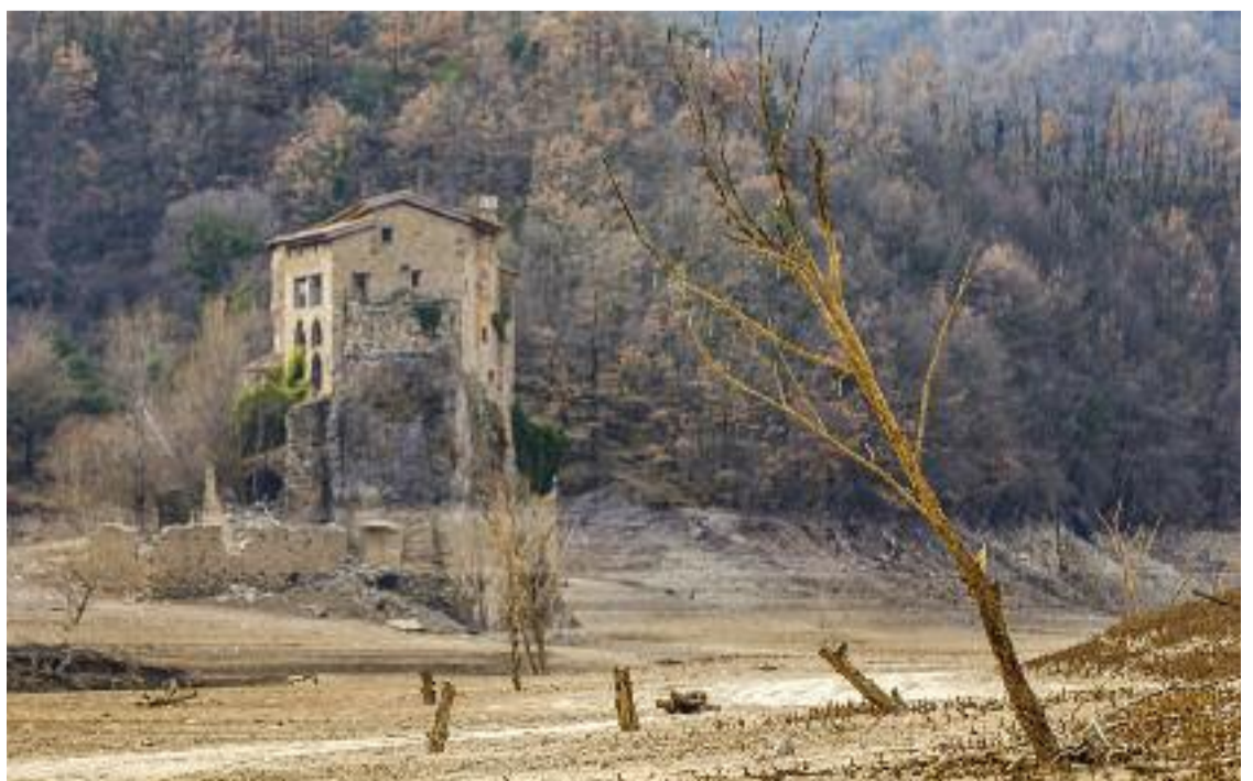
El pantà de la Baells (Berguedà) evidencia la manca de pluges dels darrers mesos.

El canvi climàtic ens aboca a tots a col·laborar. Cada gest compta.