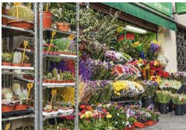
Una floristeria de la ciutat.

L'entitat també lamenta que s'hagin aplicat mesures per altres agents de la societat i que no s'hagin aplicat per al comerç, "que és un pal de paller econòmic amb més del 13% del PIB de la ciutat". És per aquest motiu que apel·len a les diverses administracions públiques a pren-