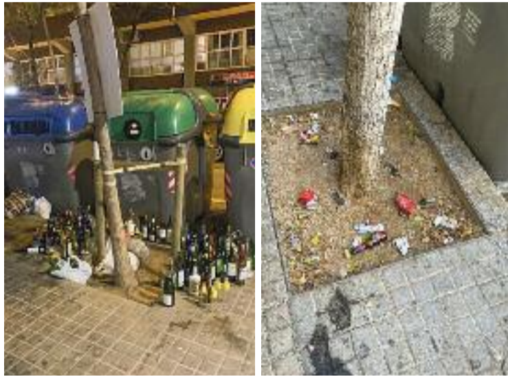
Brutícia als carrers de les Corts.