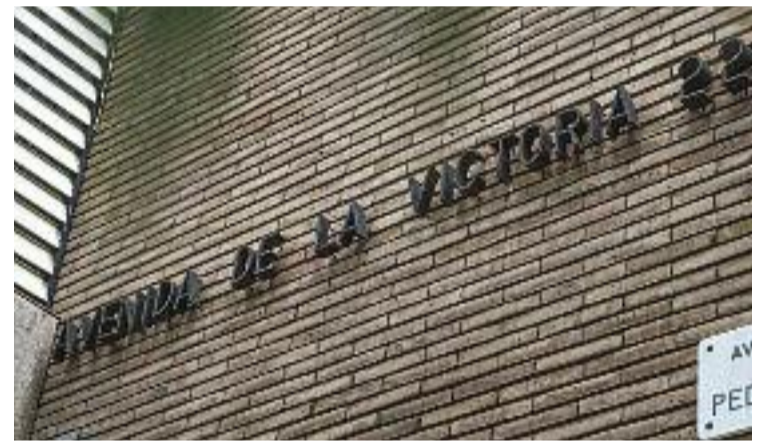
'Avenida de la Victoria 22', el rètol franquista.

En tot cas, és un cartell que no té cap valor oficial, ja que just a sota hi ha el rètol municipal que diu 'Avinguda Pedralbes'.