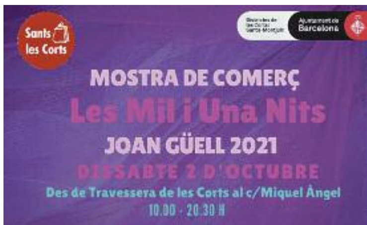
El cartell de la fira d'aquest dissabte.

Així doncs, la jornada arrencarà a les 10 del matí i s'allargarà fins a dos quarts de nou del vespre. Al llarg de tot el dia la gent podrà gaudir d'un programa amb diferents activitats. Hi haurà tallers de fanalets, serps, tamborins, catifes voladores i manualitats, entre altres, al mateix temps que també es podran trobar carpes amb jocs, una ruleta de premis, contacontes, a banda de tota l'oferta de productes dels comerciants, que seran al voltant d'una seixantena.