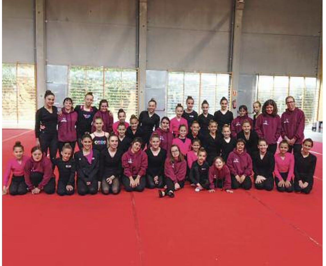
El club és tot un exemple d'integració social.

El club fa una aposta pels entrenaments de gimnàstica rítmica i també organitza exhibicions, competicions normalitzades, estades esportives, experiències d'aprenentatge-servei o intercanvis amb altres entitats. En aquests 10 anys de trajectòria ha aconseguit obrir portes noves cap a un esport més inclusiu, participant activament de la creació d'una nova categoria i reglament a la Federació Catalana de Gimnàstica, on han competit amb normalitat persones amb i sense discapacitat. Tot un exemple.