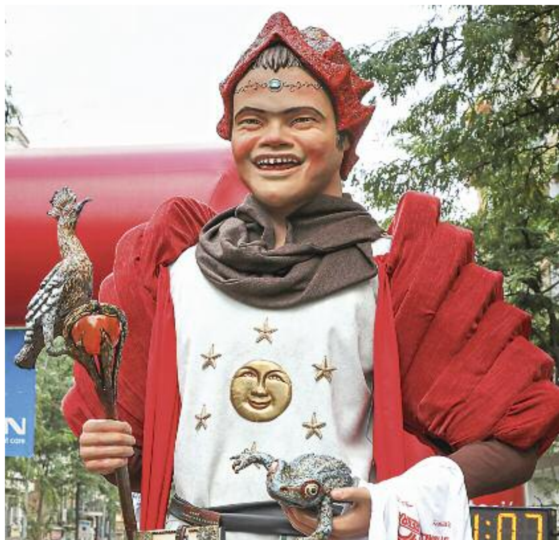
La cursa 'En marxa per la paràlisi cerebral' del 2019 va ser tot un èxit.