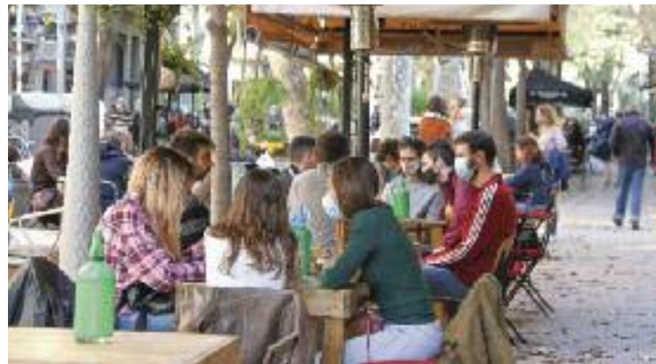
Amb la pandèmia les terrasses s'han ampliat.

D'altra banda, de la Corte explica que la fira del passat 18 de setembre celebrada al carrer Vallès va ser "tot un èxit", tot i que durant algunes hores el temps no va acabar d'acompanyar. "La gent va estar molt contenta, vam tenir molt de públic", afegí.