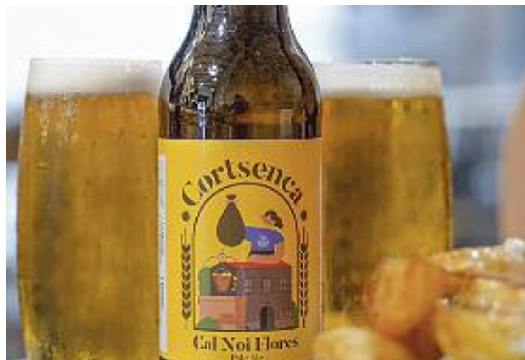
La primera cervesa recordarà Cal Noi Flores.