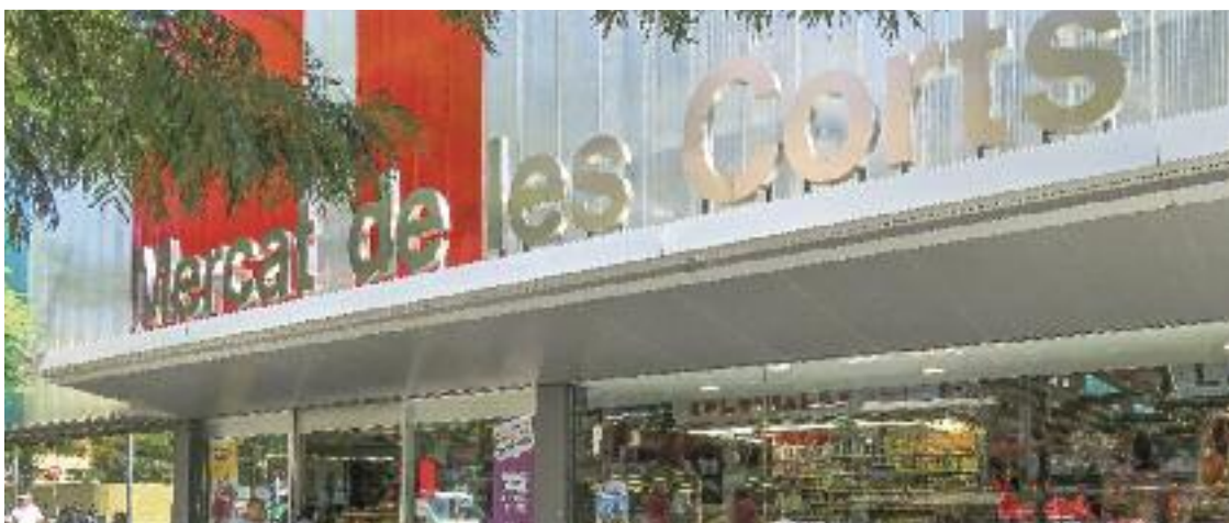
El dia 11 s'homenatjarà les entitats i s'entregaran els guardons del Cortsenc/a d'Honor.