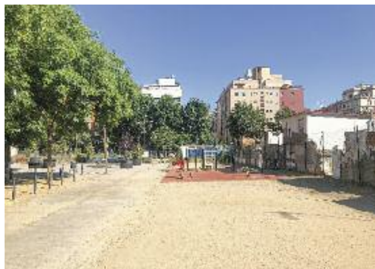
Una de les zones de l'antiga colònia on hi haurà el parc.

És per aquesta raó que des de l'entitat veïnal es van presentar unes al·legacions contra la manca d'espais verds del futur equipament, que, tal com indica Agelet, ara han estat rebutjades. "Amb aquests paràmetres el parc no pot ser una zona verda. Ens van vendre que seria com El Turó Park", assegura decebuda.