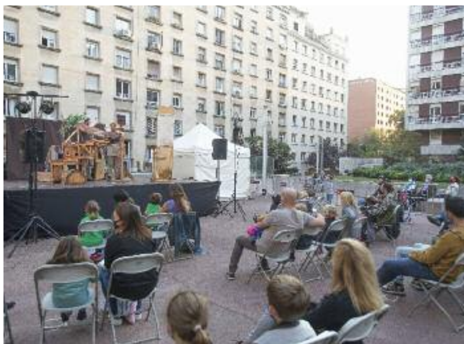
La Festa Major d'enguany tindrà un programa molt similar al de les edicions d'abans de la pandèmia.