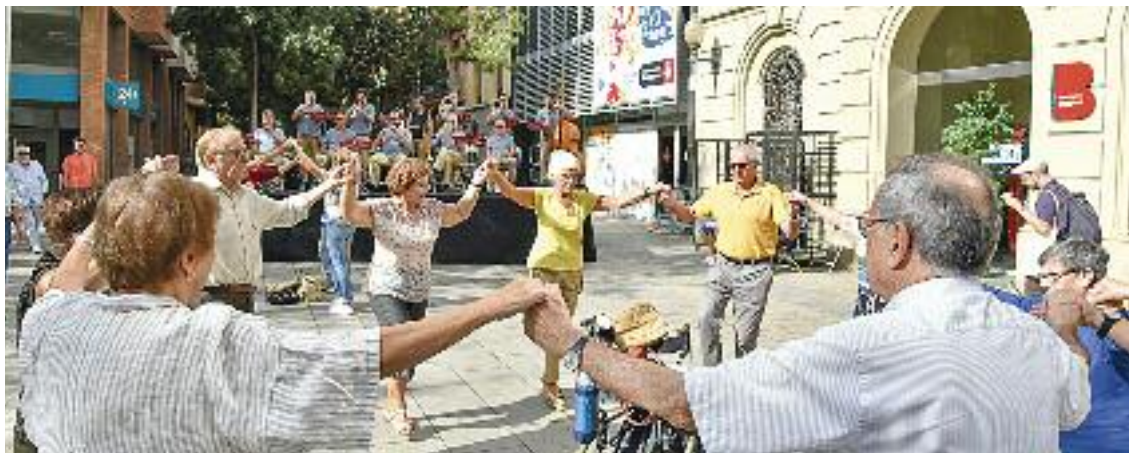
La plaça Comas serà l'escenari d'una ballada de sardanes diumenge 10 a les 12 h.