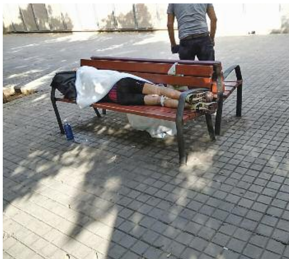
Els veïns denuncien que el local per a drogodependents està degradant el seu entorn.