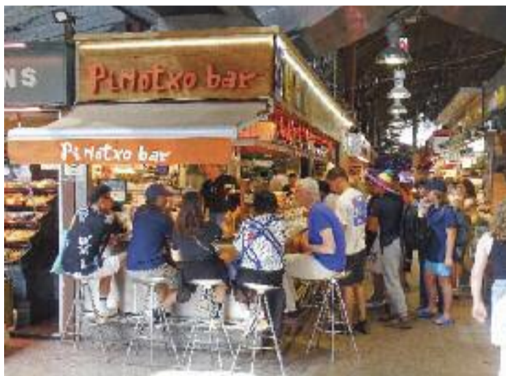
El Bar Pinotxo de la Boqueria torna a lluir el rètol original.

Però les coses han canviat, últimament. Després d'analitzar el cas, la magistrada, Montserrat Morera, ha retirat les mesures cautelars i ha permès al bar de la