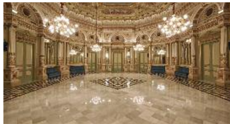
El Liceu compartirà la seva programació amb les escoles.

La iniciativa també preveu la creació d'itineraris temàtics a partir de les programacions de L'Auditori, el Liceu, el Mercat de les Flors, el Palau, el Lliure i el TNC. Un altre dels eixos centrals de laCultivadora és la formació per a docents, sessions exclusives amb experts, creadors i artistes de primer nivell per experimentar el poder de les arts i proporcionar recursos útils per aplicar a l'aula.