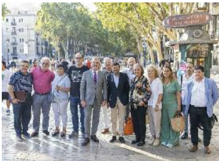
Jaume Collboni, durant la visita a la Rambla.

Segons va explicar l'alcalde, el Pacte per Ciutat Vella serà l'eina que transformarà i revitalitzarà la Rambla, i també el barri mitjançant un pla integrador que ajudarà a promoure i millorar el centre de la ciutat i a retornar la centralitat de la vida ciutadana i de l'activitat econò-