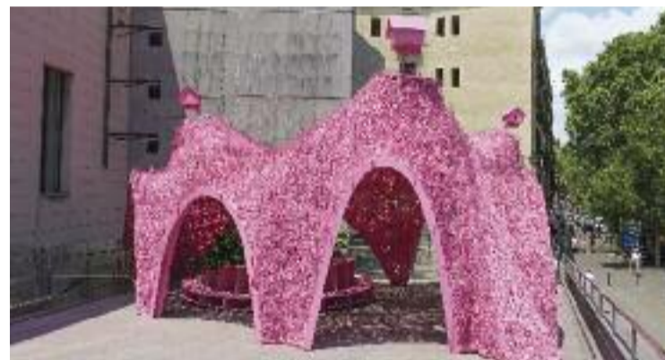
Una imatge del refugi climàtic artístic.

És el tercer any que es posa en marxa aquest projecte comunitari al Raval, liderat pel Grup d'Educació Comunitària i dinamitzat per la Fundació Tot Raval, en el qual participen, de mitjana, 600 infants i joves del barri. La llista completa dels refugis es pot consultar al mapa #RavalEstiuEducatiu i se suma, gràcies al treball conjunt d'una quarantena d'entitats socioeducatives, a l'habitual programació d'activitats per passar-ho bé i no passar calor al barri fins al 15 de setembre.