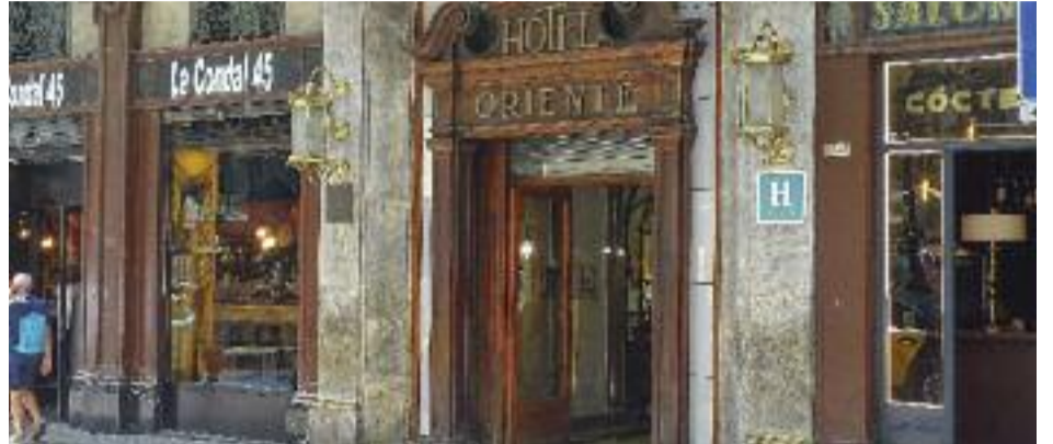
L'Hotel Quatre Naciones i la Sala Chopin, l'estàtua d'Alexander Fleming i l'Hotel Orient, quatre espais emblemàtics de la Rambla.