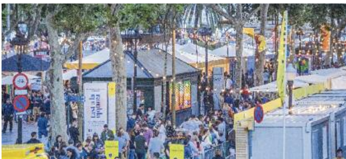
El Tast a la Rambla congrega cada any milers de barcelonins.

A l'hora de tancar aquesta edició estaven confirmats 30 restaurants i pastisseries, cadascun amb el seu tastet. Entre ells hi ha alguns dels establiments de referència de la Rambla. Com la Cerveseria Canaletes, amb el seu xef, Adrián Vega, que cuinarà costella ibèrica en salsa BBQ catalana. O el Moka,