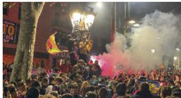
Una imatge de la celebració a Canaletes.

L'origen de la Font de Canaletes com a lloc de celebració de les victòries del Barça es remunta als anys trenta del segle XX. Llavors, els aficionats al futbol s'acostaven a la redacció del diari La Rambla , ubicada al passeig, per saber els resultats dels partits, que es publicaven en una pissarra davant de la font. Era allà, doncs, on els barcelonistes descobrien que el Barça havia guanyat i on començava la celebració col·lectiva de les victòries i els títols de campió.