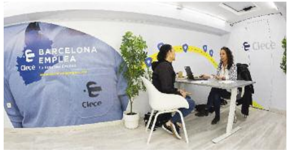
La voluntat de la companyia era seleccionar un centenar de candidats a cada parada del bus de Barcelona Emplea.