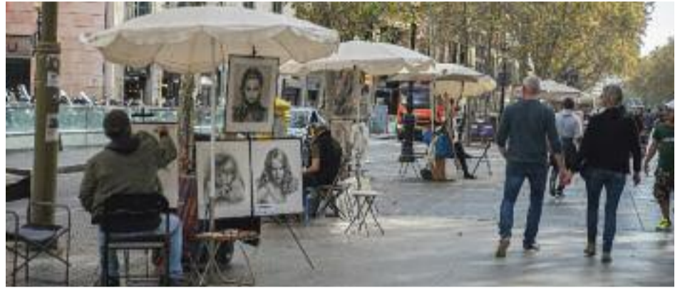
Els jardins de l'Ateneu, el Tablao Flamenco Cordobés, la Reial Acadèmia de les Ciències i les Arts i artistes treballant a la Rambla.