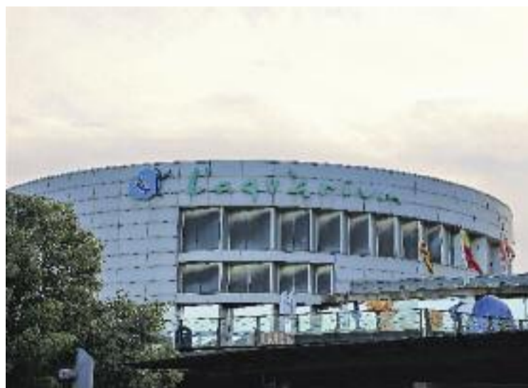
L'Aquàrium acollirà experiències immersives.

La previsió és acabar les obres abans de l'inici de la 37 edició de la Copa Amèrica, l'agost de 2024, i entre els objectius del projecte destaca el relançament d'aquest centre de recerca, conservació i divulgació de l'ecosistema marí, tant en l'àmbit local com internacional; el reforç del seu posicionament com a centre