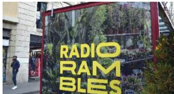
Ràdio Rambles emet des d'un antic quiosc de flors.