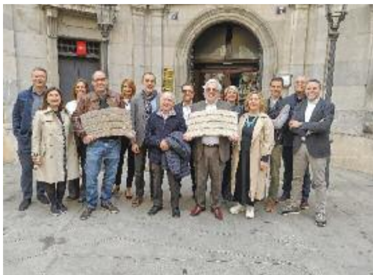
Una imatge de l'entrega dels primers panots.

L'actual paviment de la Rambla data de 1968 i està format per peces de terratzo de la casa Escofet. El disseny és d'Adolf Florensa, amb la col·laboració de Jordi Ros, dissenyador industrial d'Escofet. Cada rajola està decorada amb un motiu de línies ondulants que es va repetint per representar una alternança de