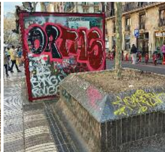
Dos exemples de les mancances de la Rambla: desperfectes al paviment i grafitis.

pintades. Finalment, l'estat de l'arbrat i alguns escocells també requereixen l'atenció de Parcs i Jardins, segons els Amics de la Rambla.