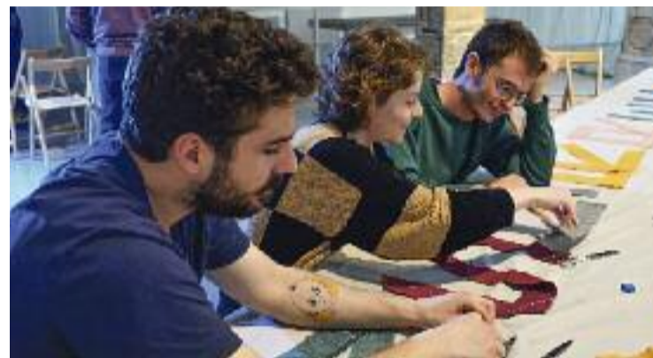
La creació col·lectiva és un dels reptes del centre.

Les residències artístiques s'entenen com a estades temporals d'onze mesos, de l'1 de setembre de 2023 al 31 de juliol de 2024, al Santa Mònica. Durant aquest temps, els residents engeguen i participen en processos de recerca que s'acaben materialitzant en diversos prototips de dispositius de mediació artística. El model implica una experiència de treball en un espai compartit per propiciar l'intercanvi de co-neixement entre els participants.