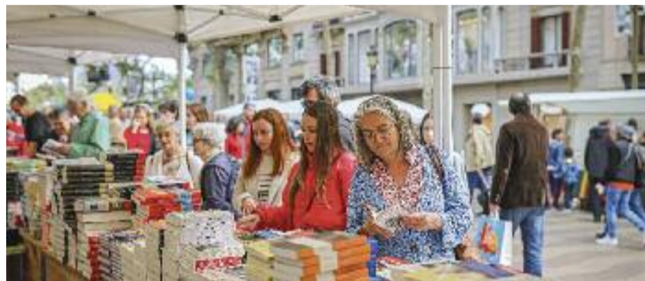
Diversos moments de la Diada de Sant Jordi a la Rambla, protagonitzada per les parades de llibres i de roses.