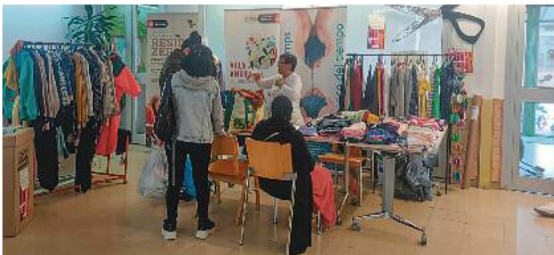
Punt d'intercanvi de roba al districte de Sant Andreu de Barcelona.

El tèxtil és un sector que genera a la Unió Europea 12,6 tones de residus l'any, cosa que suposa uns 12 quilos per persona. El mercat de segona mà o l'intercanvi de productes són algunes de les al-