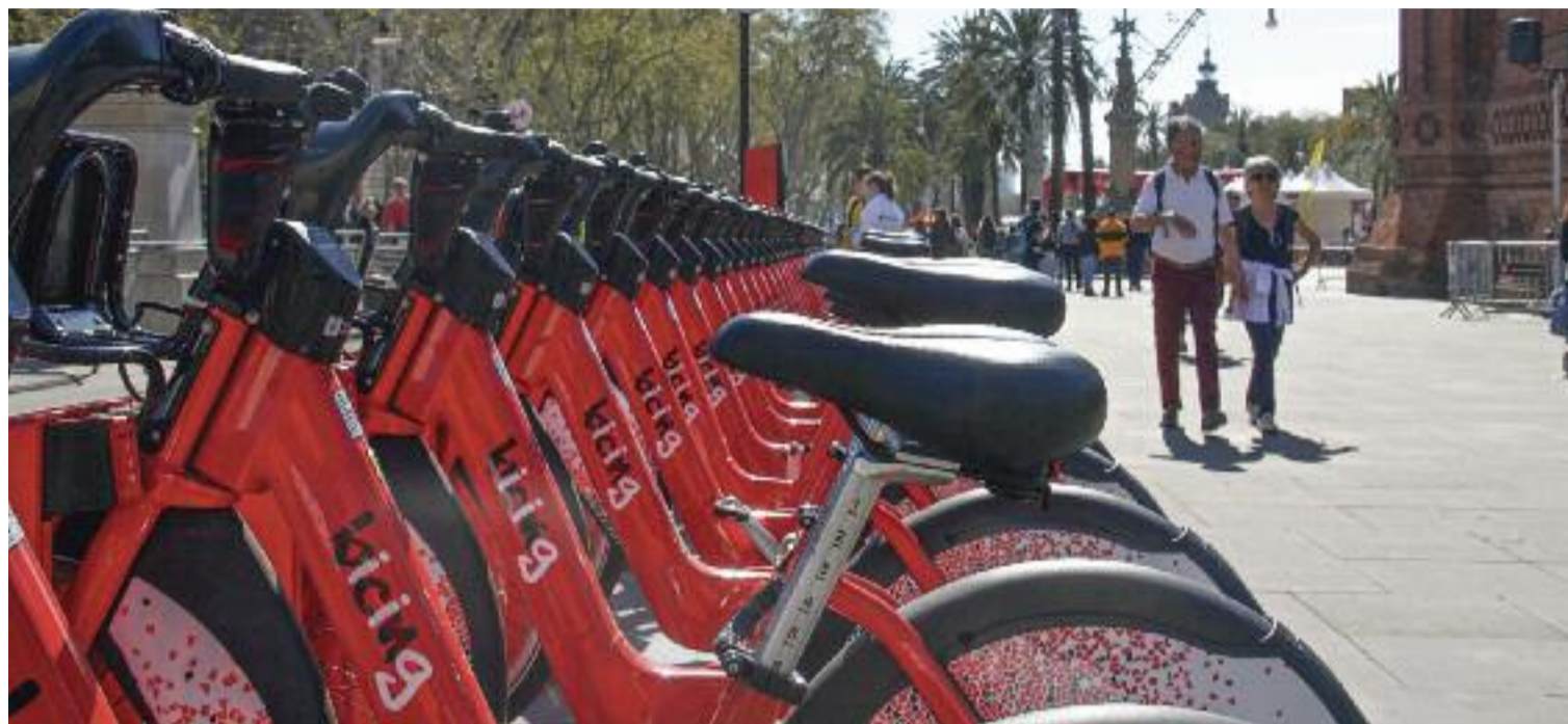
Imatge d'arxiu d'una parada del Bicing, a Barcelona.

D'altra banda, els que vulguin fer servir aquest mitjà de transport fora de Barcelona disposen del servei de bicicleta pública metropolitana AMBici, que funciona en onze municipis metropolitans i que, pròximament, arribarà fins a un total de quinze localitats. Des que al gener es va posar en marxa, s'han