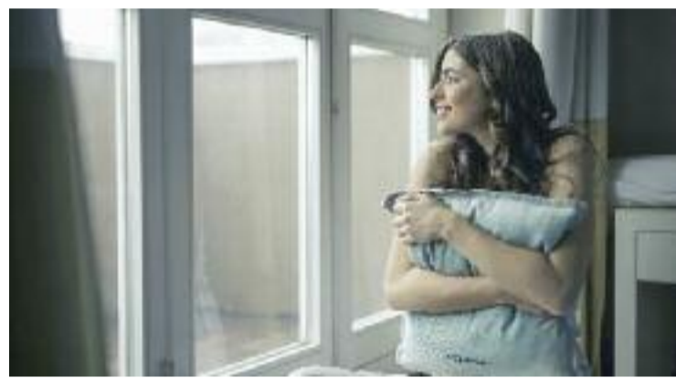
Canviar les finestres és un pas per tenir una llar més sostenible.

Amb els fons europeus Next Generation, i en col·laboració amb l'Institut Català d'Energia, els propietaris –particulars, empreses o administracions– d'habitatges unifamiliars o blocs de pisos ubicats en municipis catalans de menys de 5.000 habitants poden accedir a un ajut per rehabilitar els seus immobles. Gràcies a la campanya #EstrenaEdifici, els beneficiaris poden aconseguir el finançament d'entre un 40% i un 100% de la inversió que requereixi la rehabilitació.