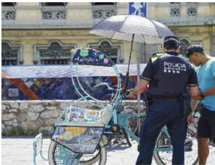
Els bicitaxis han d'estar inscrits en un registre municipal.