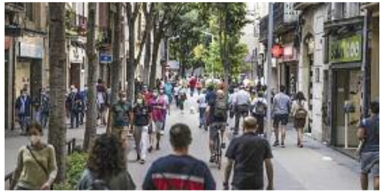
Estiu, restaurants i botigues locals són una bona combinació.

COMERÇ ▶ A Barcelona hi ha més de 61.000 comerços i restaurants que estan al peu del canó durant tot l'any, posant a l'abast de la ciutadania una oferta variada i de qualitat. A l'estiu, lluny d'aturar-se, es converteixen en espais ideals per gaudir del temps d'oci, refugiar-se de les altes temperatures i descobrir productes i serveis que potser, per falta de temps, no tenim presents durant la resta de l'any.