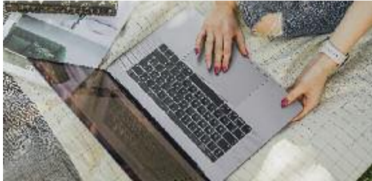
Moltes de les activitats són en línia.

En molts casos, es tracta d'activitats per a emprenedors o persones que estiguin en procés d'em-