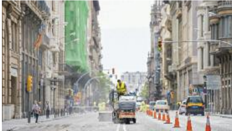
La Via Laietana, una de les avingudes que es reforma.

Per altra banda, es posen en marxa les obres d'urbanització del carrer Menéndez Pelayo i de l'avinguda de Joan XXIII, que formen part del conjunt d'actuacions emmarcades en l'impuls de l'Espai Barça. En aquesta línia, durant juliol i agost, i fins al setembre, continuen les obres ja iniciades a la Via Laietana i el carrer de Pi i Margall, per convertir-lo en una via més amable i amb un carril de circulació per sentit. Aquest estiu, a més, comencen les