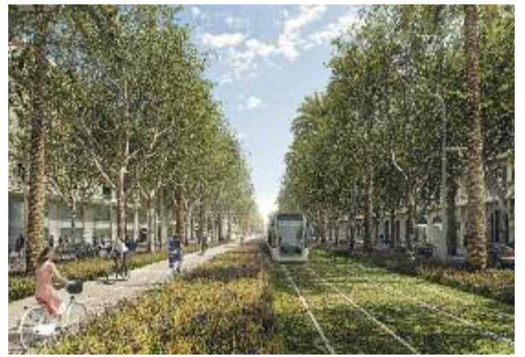
Una projecció de la Diagonal amb la unió dels tramvies.

Per altra banda, el projecte executiu de la segona fase de la unió dels tramvies haurà de coordinar-se amb les obres de desdoblament del col·lector de la Diagonal, en concret entre el carrer Girona i la plaça de Francesc Macià. De fet, el col·lector s'haurà de fer abans d'implantar la nova xarxa de tramvia i reurbanitzar l'avinguda.