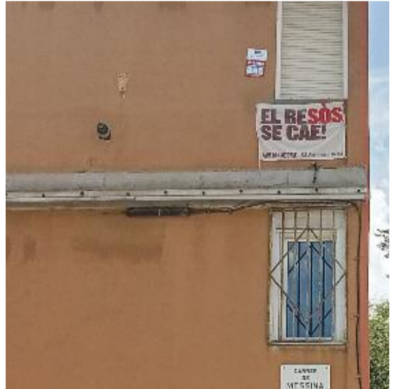
El barri del Besòs i el Maresme és un dels llocs de la ciutat on hi ha pisos amb més mal estat.

edificis; hem de tenir la política de refer-los”, va assenyalar.