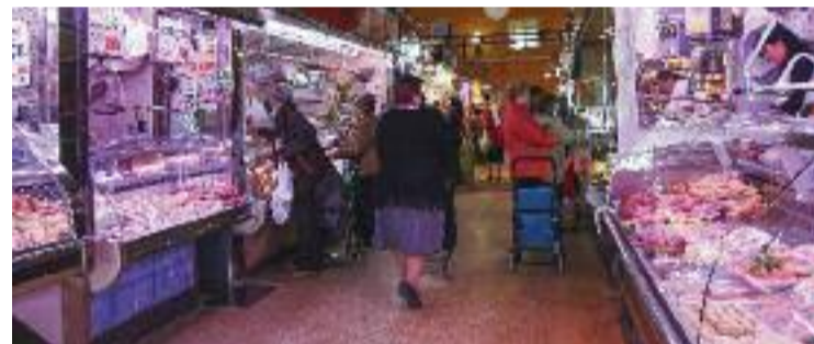
El Mercat d'Horta fa temps que espera la seva reforma.

Aquest retard farà, indiquen des del Mercat d'Horta, que les ob-