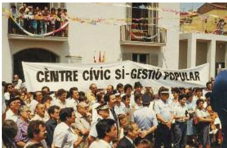
El centre es va inaugurar el 1982.