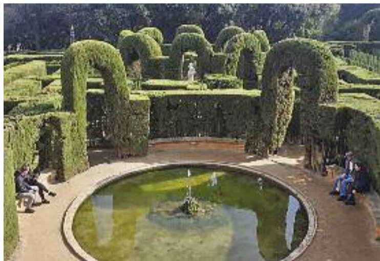
El Laberint Horta, un dels indrets del Mapamic.