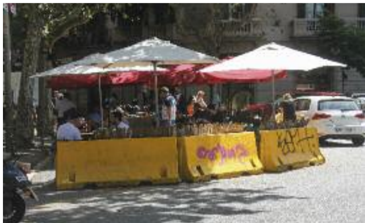
S'han denegat el 80% de sol·licituds denegades.