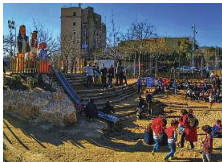
L'únic centre d'ensenyament públic d'Horta.

D'altra banda, afegeixen, també és important tenir en compte que amb els nous habitatges que s'estan construint a prop d'Horta, creixeran el nombre d'infants. "Aquesta és una altra raó per construir més escoles bressol i de primària i instituts públics", assenyalen des de l'entitat veïnal.