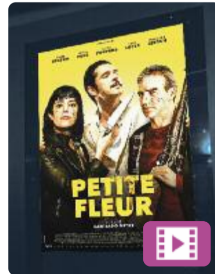
Petite fleur Santiago Mitre

El José, un ciutadà argentí que recentment s'ha mudat a França amb la parella i la filla, coneix un nou veí. En un impuls, mentre escolta la peça de jazz Petite fleur , el mata. L'endemà, però, se'l troba i veu que està més sa que mai. Decideix matar-lo de nou. A partir d'aquí, la rutina del José serà aquesta: cuidar del seu fill, tenir cura de la casa... i matar el veí.