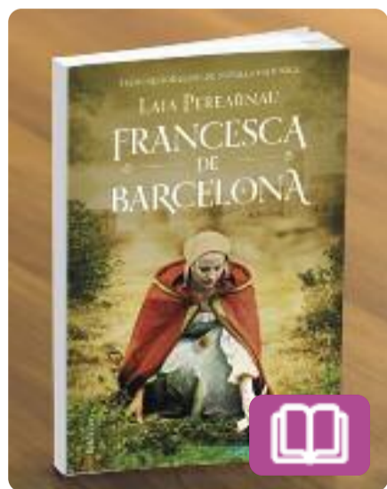
Francesca de Barcelona Laia Perearnau

Barcelona, 1382. La Francesca és una noia cristiana de quinze anys que ajuda la seva àvia Bonanada a fer de llevadora. L'àvia li ensenya els secrets de l'ofici i la introdueix en el domini de les plantes remeieres, però ella no en té prou, i malgrat que viu en un entorn molt humil, té la ferma determinació de convertir-se en metgessa i cirurgiana. Premi Nèstor Luján.