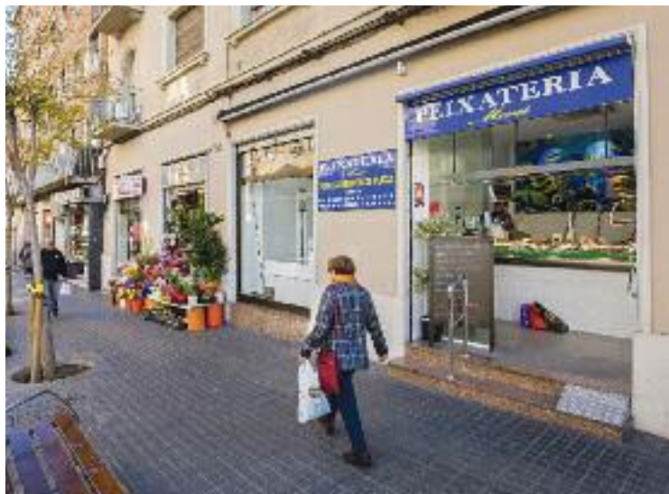
Els establiments ja no tenen límit d'aforament.