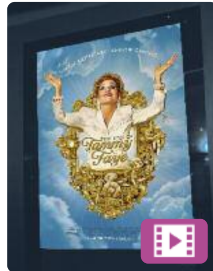
Los ojos de Tammy Faye Michael Showalter

Tammy Faye Bakker (Jessica Chastain) va ser una telepredicadora molt popular als Estats Units dels anys 70 i 80. Ella i el seu marit, Jim Bakker (Andrew Garfield), van crear un imperi del no-res, amb una xarxa de cadenes de televisió religioses i, fins i tot, un parc temàtic. Però les irregularitats financeres, les rivalitats i els escàndols els van fer caure fins a l'infern.