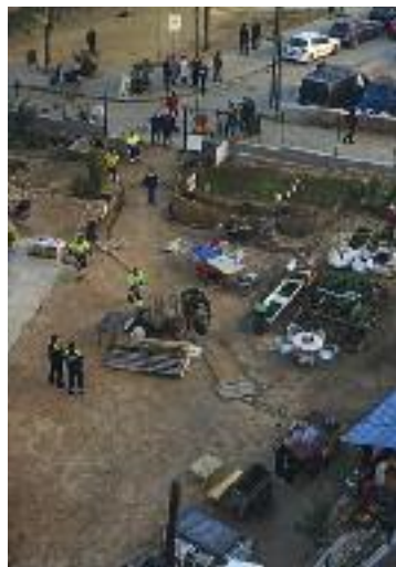
El desallotjament.

Per part seva, des de la plataforma veïnal Obrim Torre Garcini valoren positivament que es rehabiliti la masia i es conservi part del seu patrimoni. Afegeixen, però, que de moment no poden dir el mateix de tot el projecte, ja que donar el vistiplau o no donar-lo "dependrà de com acabi sent". A més, també recorden que troben a faltar que l'edifici tingui un espai destinat a conservar la memòria del Guinardó.