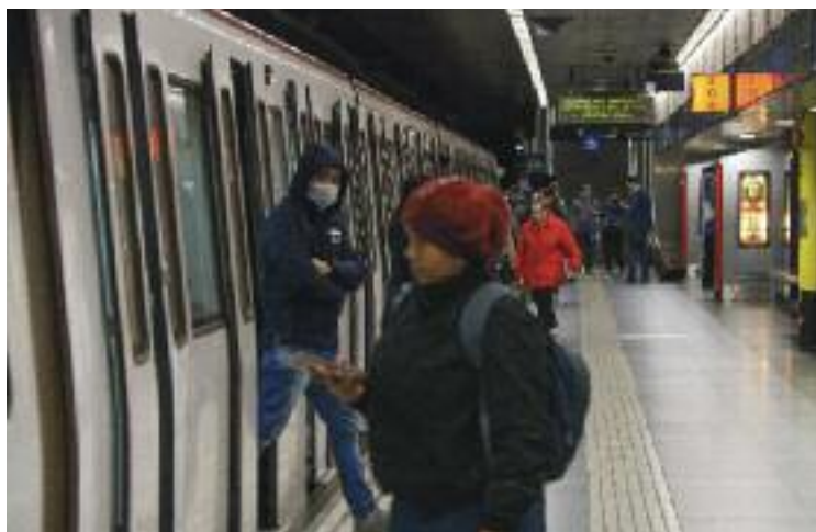
Les obres acabaran el pròxim mes de setembre.