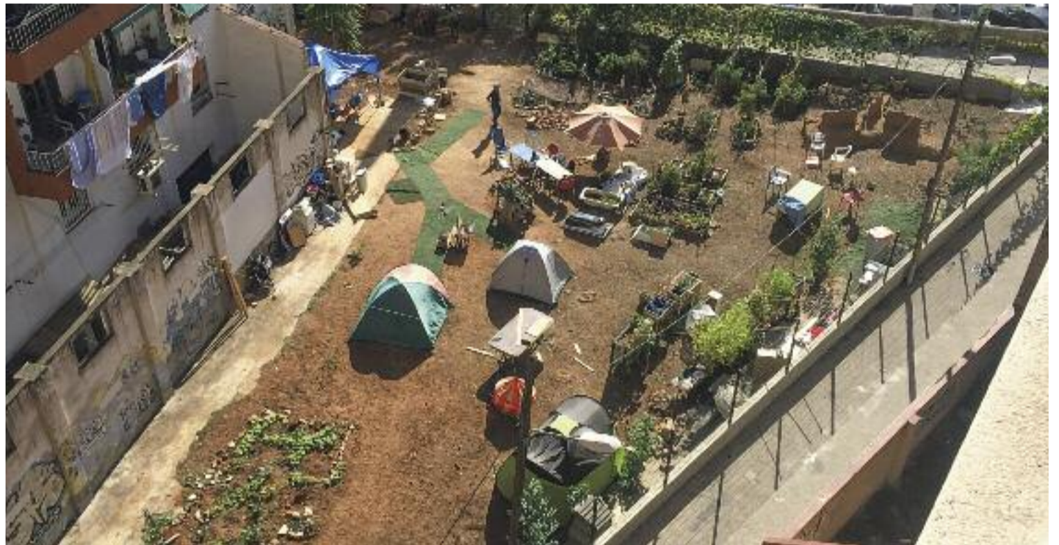
El solar municipal, situat al torrent de Lligalbé del barri del Baix Guinardó, que ha marcat un abans i un després en la zona.