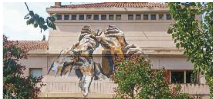
L'edifici on es troba el casal és del 1928.

EQUIPAMENTS ▶ El Casal Font d'en Fargues compleix deu anys aquest curs. L'equipament públic està situat a l'edifici Font d'en Fargues del 1928. En aquests moments, el casal és molt més que un equipament públic i, tal com diu el seu compte de Twitter, és "un espai de convivència de les entitats i grups del barri". També és, tal com afegeix, "un lloc per teixir xarxes". Per als veïns, és a més, segons indica l'espai web del casal, "un espai de trobada, de tallers, de formacions socials i