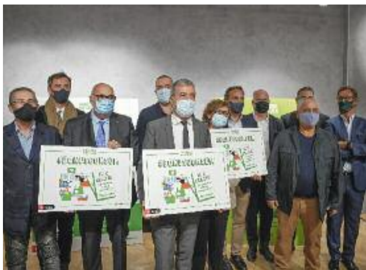
La campanya Bonus Consum es pot fer servir al BCNMarket.

Així doncs, aquesta eina digital permetrà als comerços donar-se a conèixer i vendre online els seus productes i serveis. "BCNmarket és tot allò que el comerç de proximitat havia re-