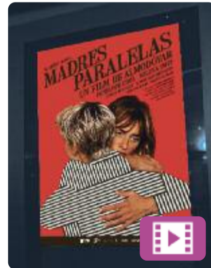
Madres paralelas Pedro Almodóvar