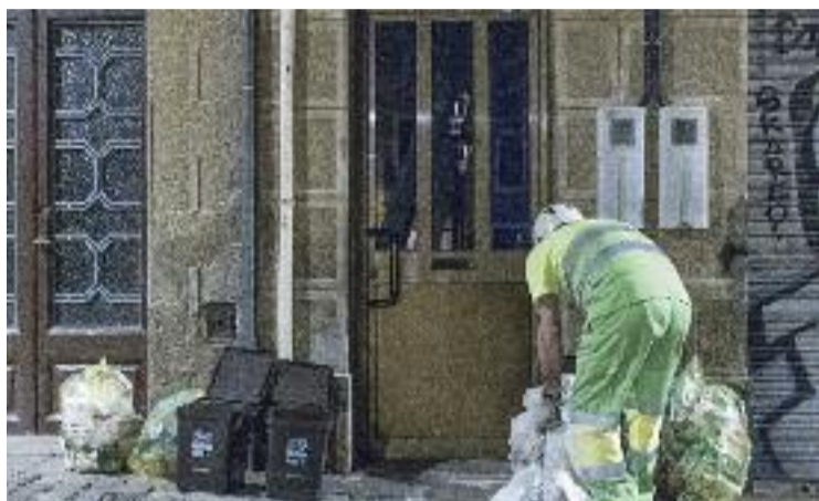
L'aplicació del sistema estava prevista per aquesta tardor.

Les paraules de Collboni signifiquen que el Porta a Porta no es començarà a aplicar a Horta aquesta tardor, tal com en un primer moment estava previst. A més, Collboni va fer aquest anunci quan el responsable de la qüestió és el regidor de Barcelona En Comú d'Emergència Climàtica i Transició Ecològica, Eloi Badia.