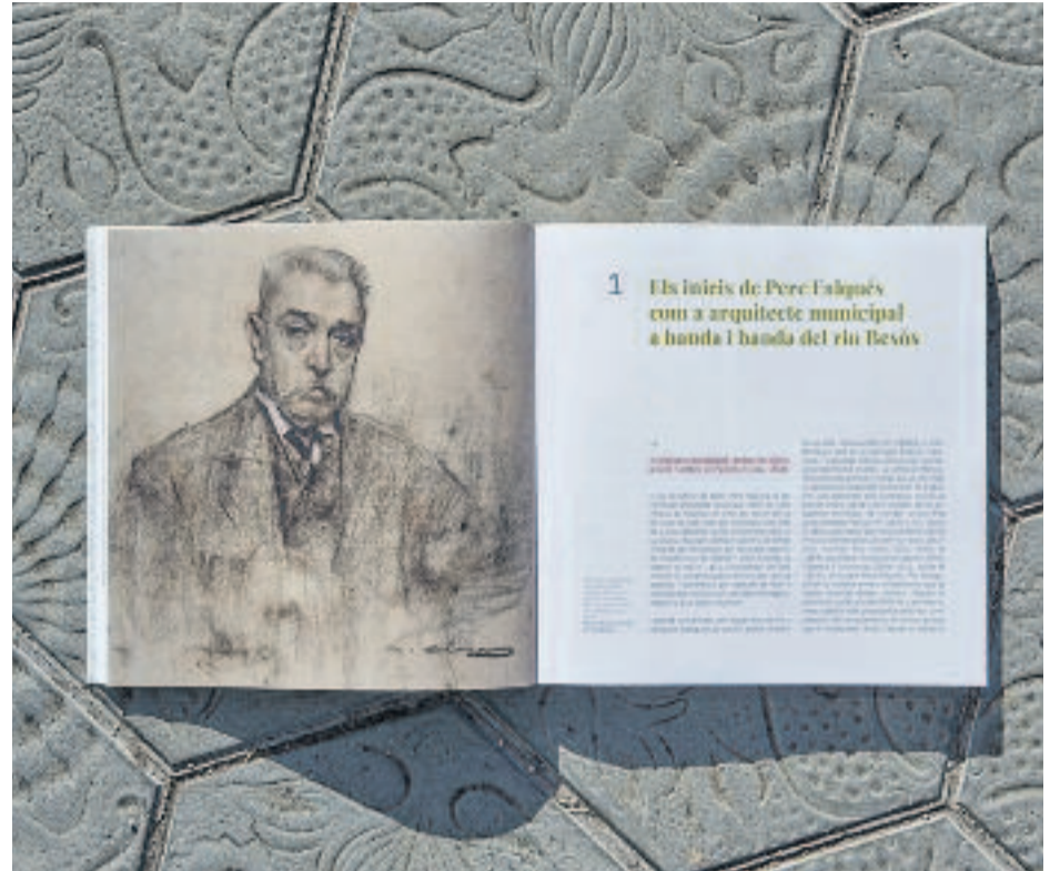
Falqués és un dels responsables de la modernització de la metròpoli.