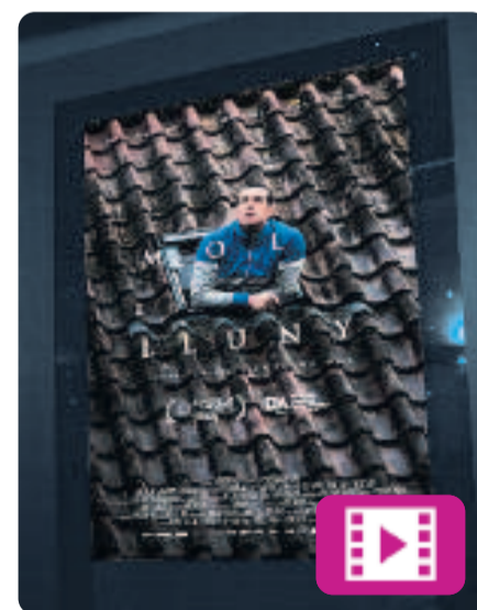
Molt lluny Gerard Oms

El film narra la història d'en Sergi, que viatja a Utrecht amb la família. Però abans d'agafar el vol de tornada a Barcelona, pateix un atac de pànic i decideix quedar-se a Holanda. Incapaç de donar una explicació lògica als seus, talla el contacte amb el passat. A partir d'aquell moment, haurà de sobreviure sense diners, sense casa i sense parlar l'idioma.