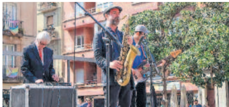
Diversos músics van actuar durant l'homenatge.

MEMÒRIA ▶ La Vila de Gràcia ha homenajat Víctor Nubla, destacat músic, escriptor i activista cultural, amb una placa commemorativa al portal del número 50 del carrer Milà i Fontanals, on va residir. L'acte, que es va celebrar el passat 5 d'abril, va incloure la Verbena per a Missantrops , una celebració amb música, lectures i escenes surrealistes que reflectien l'esperit irreverent de Nubla.