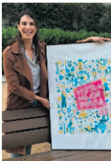
L'artista i el cartell.

L'homenatge va comptar amb la participació de veïns i artistes, que van recordar la figura de Nubla amb textos inèdits. La placa serveix com a record d'un home que va deixar empremta en la cultura del barri.