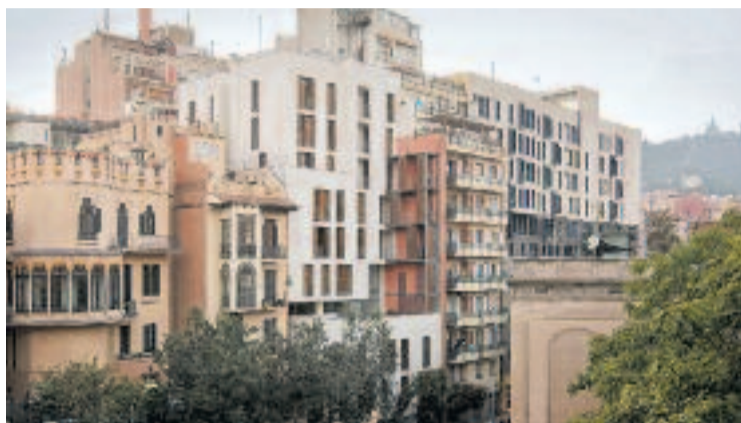
Vallcarca continua reivindicant la seva transformació.

El col·lectiu Heura va aprofitar per reclamar que l'Ajuntament compri l'edifici del número 24 de l'avinguda República Argentina, que considera apte per a ús social. L'entitat va alertar també de la situació de vulnerabilitat de moltes persones a Gràcia, xifrant en 57 els casos de sensellarisme al districte, als quals caldria afegir les 34 persones que viuen en assentaments precaris a Vallcarca.