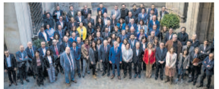
L'acte de presentació del pla Barcelona Impulsa.

La Fundació Barcelona Comerç, que va assistir a la presentació del pla, ha remarcat que en el futur "el comerç de proximitat ha de continuar sent motor de progrés, vida urbana i cohesió social".