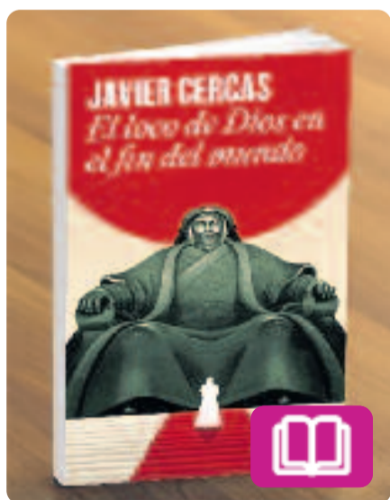
El loco de Dios en el fin del mundo Javier Cercas

Es tracta d'una novel·la que aborda una de les preocupacions fonamentals de la societat actual: el paper de la religió i de l'espiritualitat avui dia i la recerca de la immortalitat. Ho fa partint d'una proposta que li va fer el Vaticà, que, de forma insòlita, li va oferir fer un viatge a Mongòlia juntament amb el papa Francesc.