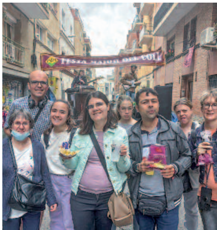
La coral (esquerra) és un dels projectes de més èxits de l'Ateneu Divers, que impulsa altres activitats.

El grup actualment està format per set persones que, com diu la directora, sovint conviuen amb sentiments com la inseguretat i la frustració, perquè hi ha cançons que els costa d'interpretar: "Em van demanar cantar Nочhentera, però com que vam veure que era molt complicada, la vam deixar i ara estem fent l'havanera d' El meu avi ". Malgrat que les necessitats especials del grup impliquen escurçar les