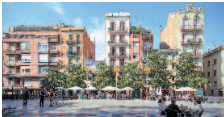
El conflicte per les terrasses a la plaça del Sol no s'atura.

Melissa Privitera, membre de l'Associació de Bars i Restaurants