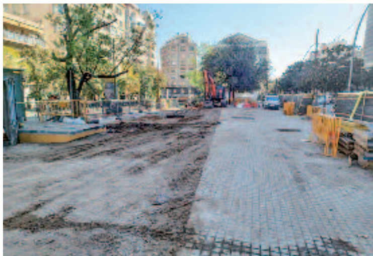
Les obres dels Ferrocarrils van començar fa mesos.