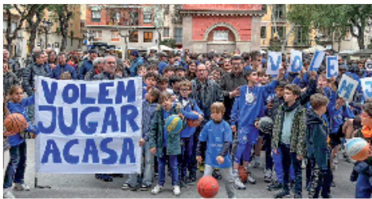
L'entitat s'ha manifestat per demanar una solució.

El principal contratemps per a solucionar la problemàtica és que els Lluïsos, tot i ser reconeguts com una entitat d'utilitat pública, és una associació privada. Per tant, finançar la construcció del nou espai esportiu requereix uns procediments especials, com l'obertura d'un concurs obert a altres entitats. En aquest sentit, l'Ajuntament "estudia la viabilitat d'una convocatòria de subvencions on entitats esportives en la mateixa situació que Lluïsos es puguin presentar. El govern municipal