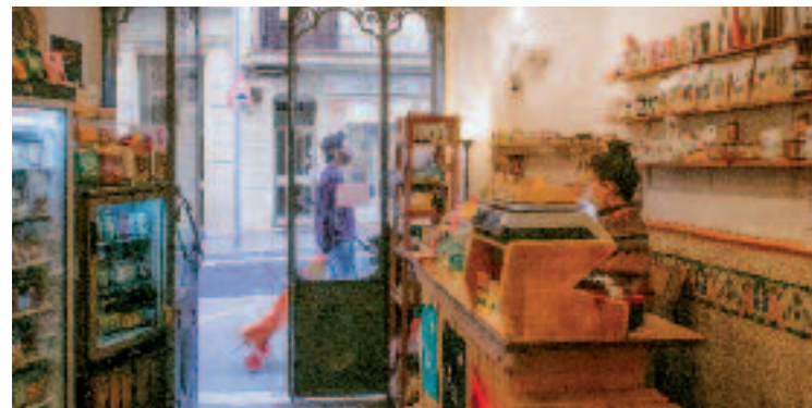
Una dona a darrere de la caixa d'un comerç.