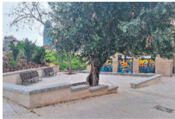
La nova placeta del carrer Castillejos.

També s'ha renovat completament la vorera del costat Besòs fins a la Gran Via. En total, la reforma ha renovat un total de més de 650 metres quadrats de la zona que recentment s'ha transformat per l'arribada del tramvia.