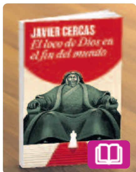
El loco de Dios en el fin del mundo Javier Cercas

Es tracta d'una novel·la que aborda una de les preocupacions fonamentals de la societat actual: el paper de la religió i de l'espiritualitat avui dia i la recerca de la immortalitat. Ho fa partint d'una proposta que li va fer el Vaticà, que, de forma insòlita, li va oferir fer un viatge a Mongòlia juntament amb el papa Francesc.