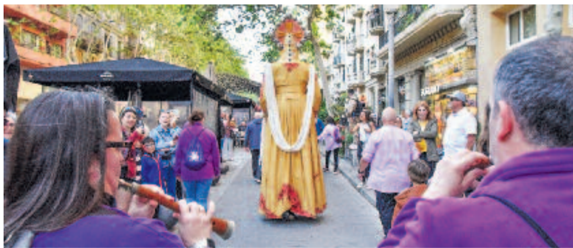
La gegantona Crespina de la Sagrada Família, a la cercavila de la Festa Major.

La cultura popular, com sempre, hi té un paper central. Són moltes les cites tradicionals que encara estan per arribar: el sopar i ball de la festa (11 d'abril), el teatre a la fresca i el concert de corals (12 d'abril), o la trobada gegantera (13 d'abril). Malgrat