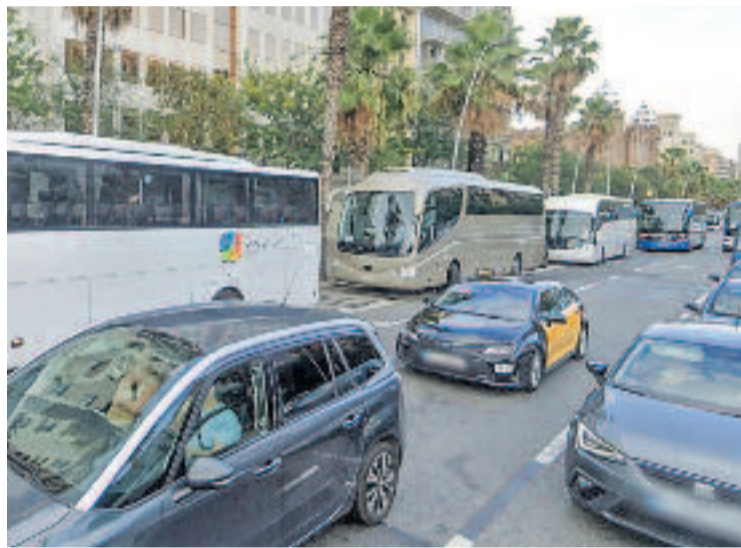
El carrer Marina, ple de trànsit i amb autocars.