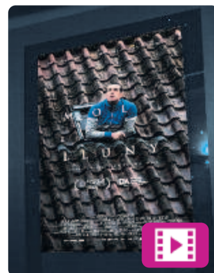
Molt lluny Gerard Oms

El film narra la història d'en Sergi, que viatja a Utrecht amb la família. Però abans d'agafar el vol de tornada a Barcelona, pateix un atac de pànic i decideix quedar-se a Holanda. Incapaç de donar una explicació lògica als seus, talla el contacte amb el passat. A partir d'aquell moment, haurà de sobreviure sense diners, sense casa i sense parlar l'idioma.