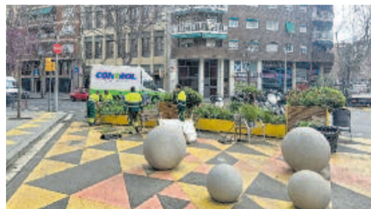
Operaris canvien la vegetació de la superilla.

Sala acaba dient que, tot i la satisfacció amb aquest espai, no volen que aquest ús del "mentrestant" s'allargui i els pisos i l'equipament triguin a arribar.