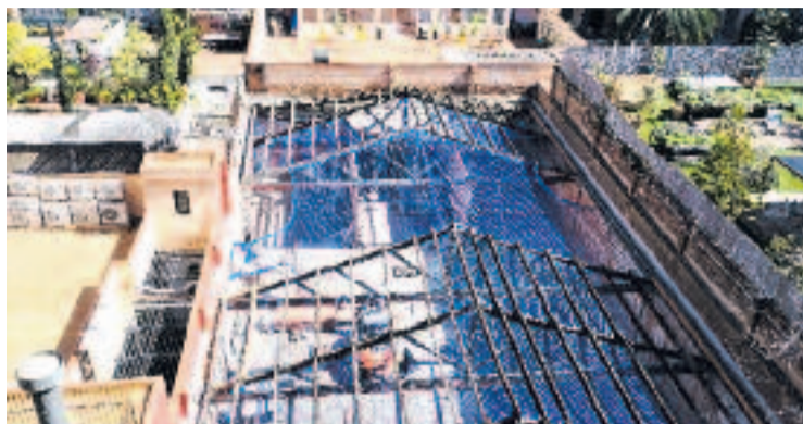
La cobertura d'amiant ja s'ha retirat del tot.

lla, ja s'ha començat a col·locar la nova. I és que ara, en lloc del pàrquing que hi va haver fa uns anys, i que va haver de tancar per una manca de permisos que va provocar queixes veïnals, les obres serviran perquè l'editorial que publica la revista Apartamento , que té la seu a la part del carrer Bruc d'aquesta illa, hi obri unes noves oficines.