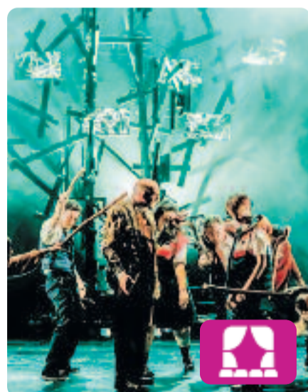
Un monstruo viene a verme

Arriba al Teatre Apolo de Barcelona l'adaptació teatral de la novel·la de Patrick Ness que Juan Antonio Bayona va portar a la gran pantalla. Explica la història d'en Conor, un nen de 13 anys que cada nit té el mateix malson des que la seva mare va caure malalta. Amb un monstre que se li apareix al jardí, viu diferents aventures, fins que decideix fer front a les seves pors.