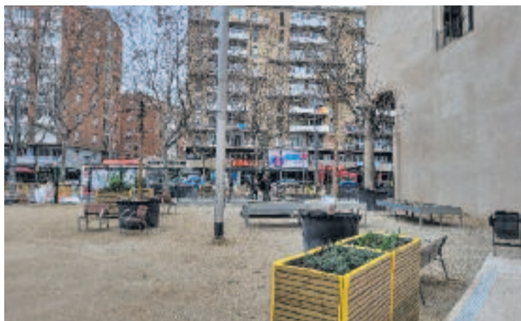
Al solar del Talia s'hi faran 54 pisos socials.