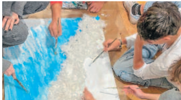
Els alumnes de l'escola durant el procés creatiu.

Un altre cas amb amiant, també molt recent, però que tampoc ha creat polèmica, és el de les obres del Taller Masriera.