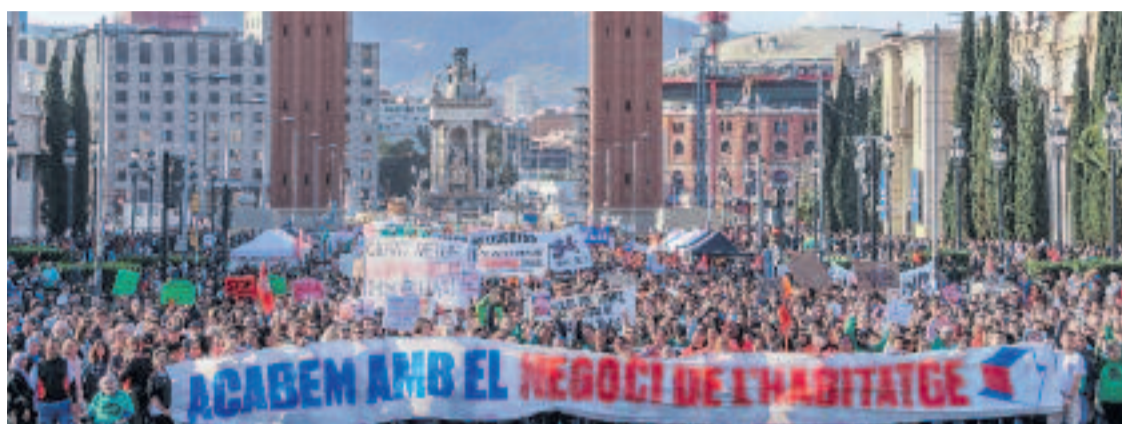
La manifestació per l'habitatge va acabar a l'avinguda Maria Cristina.

MANIFESTACIÓ PER L'HABITATGE Milers de persones –12.000, segons la Guàrdia Urbana i 100.000 segons els organitza-