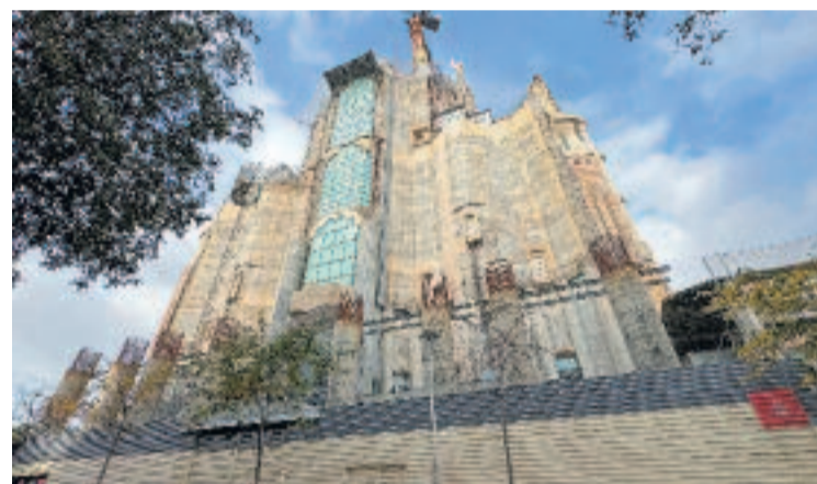
L'aspecte actual de la façana de la Glòria.

La notícia arriba tot just un dia després que s'hagi començat la instal·lació de les bastides que serviran per construir els primers elements de la façana: quatre torres i una filera de vuit columnes. Un cop s'hagin aixecat les bastides, l'espai es taparà amb una imatge de la futura façana, però sense les escultures.