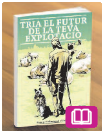
Tria el futur de la teva explotació La Xarxa pel Relleu Agrari

La Xarxa pel Relleu Agrari al Pirineu ha publicat aquest llibre per ajudar el relleu generacional de les explotacions ramaderes. És una publicació que planteja diferents opcions a un pagès que, després d'anys de dedicació, es vol jubilar. Amb un final obert, el lector hi trobarà diverses vies per dedicar-se a un sector envellit on manquen mans.