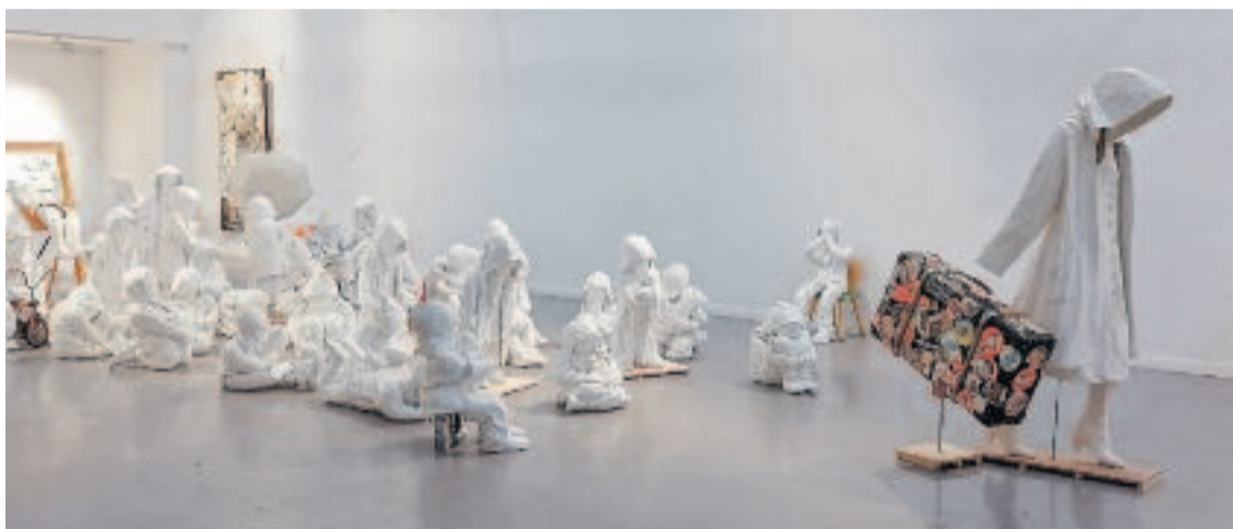
Un dels conjunts de figures de la instal·lació artística.

Gràcies al suport de la Fundació Atrium Artis de Girona, que ha facilitat el transport de les obres, l'exposició ha arribat a diversos espais culturals. Lucas destaca que l'art ha obert un espai segur on les persones han pogut compartir les seves pròpies experiències de l'exili i la mi-