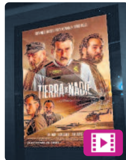
Tierra de nadie Albert Pintó

El film narra la història de tres vells amics –un Guàrdia Civil, un pescador convertit en narco a l'atur i un dispositari judicial a mig camí entre la llei i la delinqüència– en un escenari d'ascens del narcotràfic i d'augment del descontentament social, a Cadis. Una aventura amb un càrtel perillós posarà a prova la seva amistat i els portarà fins a l'extrem.