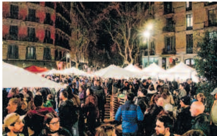
La cruïlla de Consell de Cent i Girona durant el vespre de la fira.