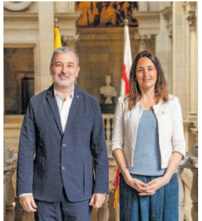
El futur de l'Escola Entença és a la llista de l'acord firmat entre l'alcalde Collboni i la consellera Niubó.