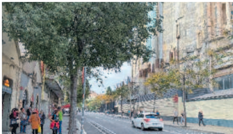
Eixample Respira vol que es pacifiqui el carrer Mallorca.

Així doncs, la proposta que Eixample Respira va fer al Districte és la de pacificar el carrer Mallorca al seu pas a l'altura del temple. Una idea que l'entitat compara amb la que fa temps va plantejar, batejada com a Nadal sense fum , que proposa restringir la circulació al centre de la ciutat durant Nadal. "Les acumulacions de gent que es fan al voltant del temple, on hi ha protagonisme del cotxe, provoquen que la