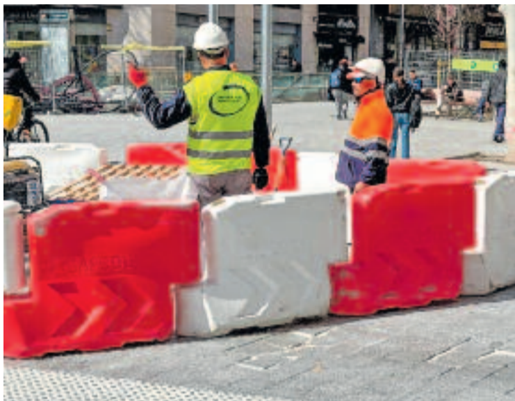
Operaris reparant les llambordes afectades.

Des de la plataforma han apuntat que els bonys que s'es-