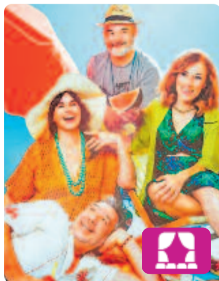
Cancún Jordi Galceran

Dues parelles, amics de tota la vida, es troben en un resort de Cancún, on han anat a passar les vacances. Tot respira relax, bona entesa i complicitat, però una nit, inesperadament, es plantegen què hauria passat si s'haguessin casat amb altres persones. Aquesta comèdia es pot veure al Teatre Gaudí de Barcelona fins al 17 de maig.