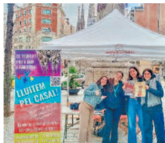
Les entitats han omplert el barri de cartells per promocionar la iniciativa.

vinculació de molts joves amb el barri per la falta d'opcions culturals, d'oci o associatives destinades específicament a ells. "Amb un espai comú podríem dinamitzar la gent jove, que està molt desconnectada de la vida local. Un lloc físic propi on trobar-nos fa molt més fàcil atraure la gent i permet poder-