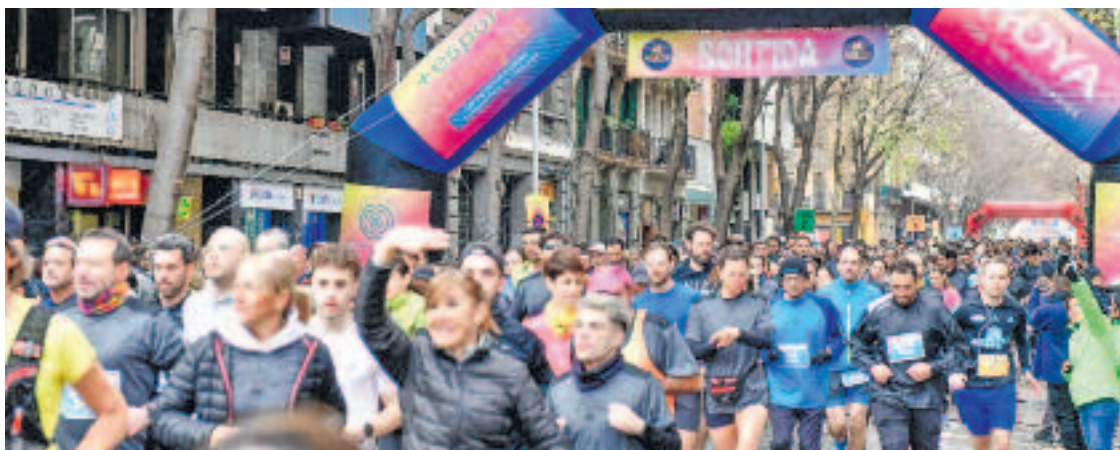
La cursa Moritz Sant Antoni és una de les que se celebren cada any pels carrers del barri.

El principal problema, expliquen els paradistes, és que els clients de fora del barri no poden arribar al mercat perquè "sem-