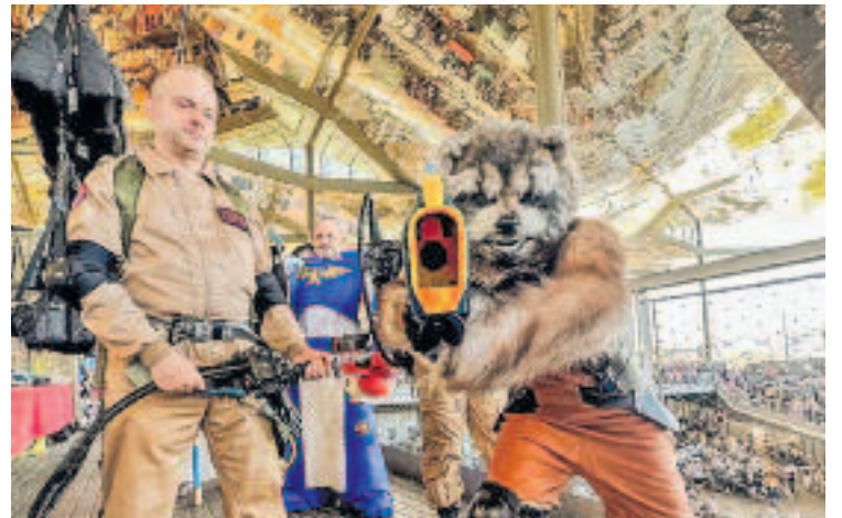
L'Encants Movies ha inclòs una desfilada de disfresses.

L'esdeveniment té finalitats solidàries i tots els fons recaptats es destinaran a la Fundació Ronald McDonald, una fundació solidària de la famosa cadena de restaurants que dona suport a famílies amb nens malalts. Els assistents poden contribuir adquirint material solidari o participant en activitats benèfiques.