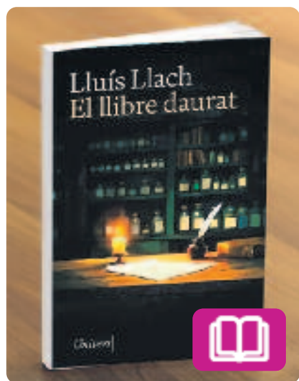
El llibre daurat Lluís Llach

El cantautor Lluís Llach ha publicat aquesta obra que posa el focus en temes com el coneixement, la supervivència i la saviesa oculta de les dones en una societat dominada pels homes. Ambientada entre els segles XIII i XVI, la novel·la ressegueix la història de dos homes i la seva voluntat de curar malalts combinant els remeis tradicionals amb el nou saber mèdic.