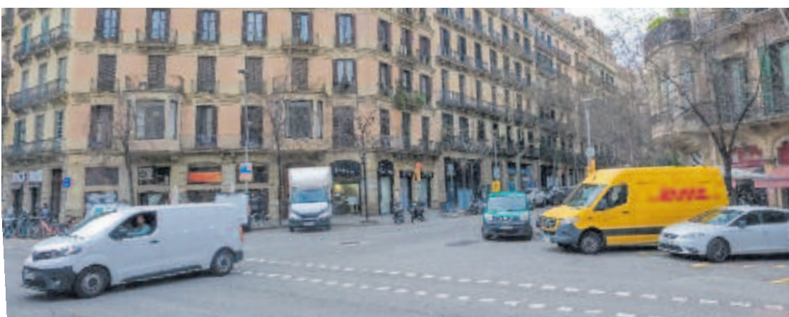
Els cotxes i la càrrega i descàrrega actualment tenen molt de protagonisme als xamfrans.

La iniciativa també defensa que un ús diferent dels xamfrans podria contribuir a la seguretat viària. “Reduir la distància entre els passos de vianants i la intersecció dels vehicles faria que aquests haguessin de reduir la velocitat, augmentant la visibilitat i la seguretat en els encreuaments”, argumenta l'entitat. A més, la proposta suggereix convertir aquests espais en zones de verd, estada i joc, seguint el model d'altres punts de la ciutat on ja s'han implementat mesures similars, com el passeig de Gràcia amb Aragó o Llançà amb València.