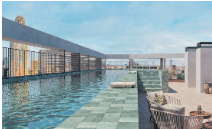
Imatge virtual de la futura piscina dels edificis.

Es preveu que els habitatges s'entreguin als compradors durant el 2027, però des de l'Associació de Veïns del Fort Pienc ja alerten sobre la "gentrificació"