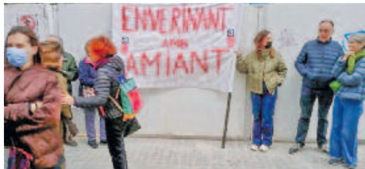
Pancarta contra la retirada de l'amiant.

Per la seva banda, l'Ajuntament ha anunciat que crearà la Taula de l'Amiant de la ciutat, que es reunirà després de Setmana Santa per treballar la seva composició i els objectius. I també que, conjuntament amb les entitats defensores de la llei de l'amiant, s'enviarà una carta al Parlament per accelerar la seva aprovació de la llei per a l'erradicació de l'amiant a Catalunya.