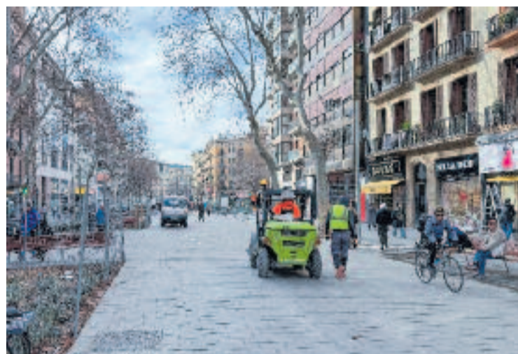
La ronda de Sant Antoni, al tram reformat.