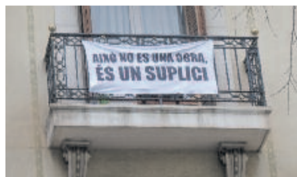
La retirada de la teulada d'amiant de l'antiga seu del diari El Periódico , a Consell de Cent, està generant queixes i polèmica.

miant, si els veïns tenen alguna queixa sobre la seva retirada és la Generalitat qui té la competència a l'hora de vetllar per la seguretat i protecció dels operaris i de la gent que viu en aquesta zona. Per la seva banda, des de l'oposició municipal, Junts ha registrat diverses preguntes sobre les obres i ha demanat que es compleixin totes les garanties de seguretat