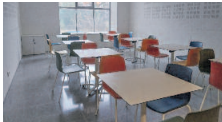
Una de les sales de l'Espai de Gent Gran de Germanetes.

Un cop desbloquejada la situació, l'edifici que allotjarà l'Espai de Gent Gran Germanetes i els 47 pisos tutelats estarà enllestit abans de finals d'any. Tot i això, l'espai obrirà les portes al públic el setembre, quan ja estaran en marxa els cursos i tallers.