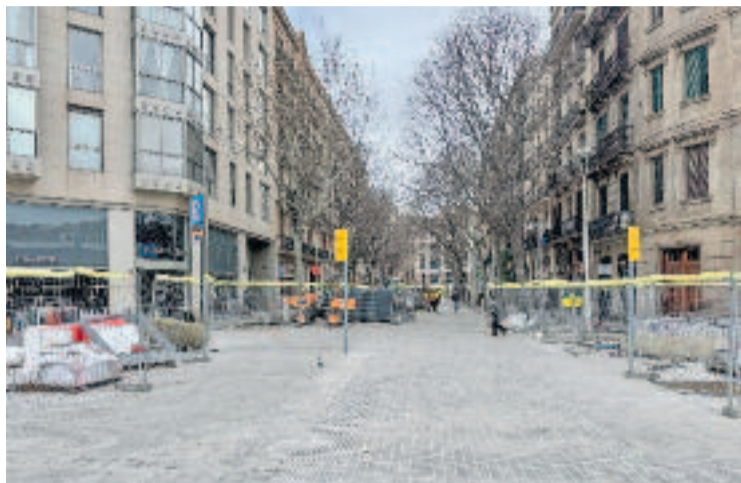
Les obres a Tamarit ja estan en el tram final.