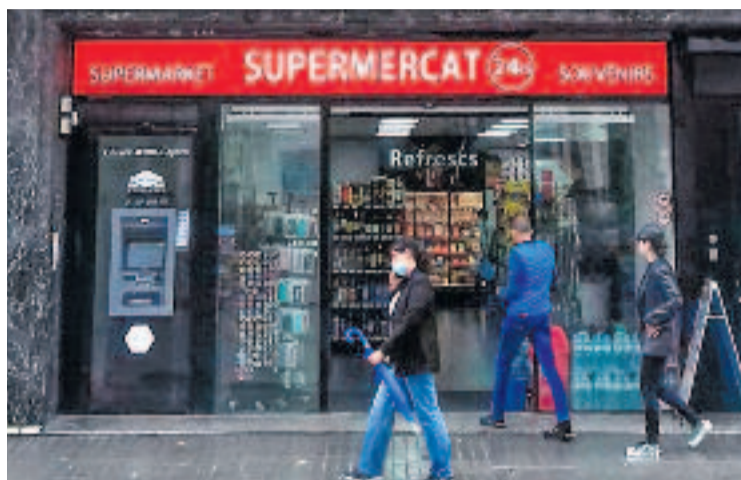
L'exterior d'un supermercat 24 hores.

Pel que fa als resultats de la inspecció del passat mes de desembre, de les 2.015 infraccions detectades als 109 locals inspeccionats, les més freqüents van ser les relacionades amb