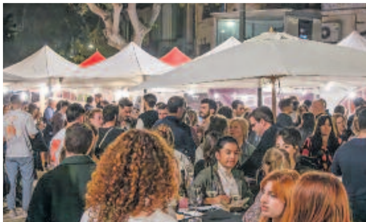
Imatge d'arxiu de la darrera edició de la fira.