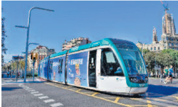
El tram, a la cruïlla Diagonal-Marina.

Durant el Consell de Districte, que es va celebrar el passat 6 de març, diversos representants