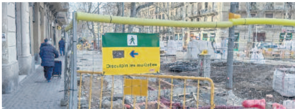
Les tanques metàl·liques ocupen encara bona part de la ronda.

Nou anys després de la construcció del mercat, es va retirar l'edifici temporal, però la llosa que servia de fonament es va mantenir més temps. De fet, no va ser fins al 2023 quan es va retirar l'estructura