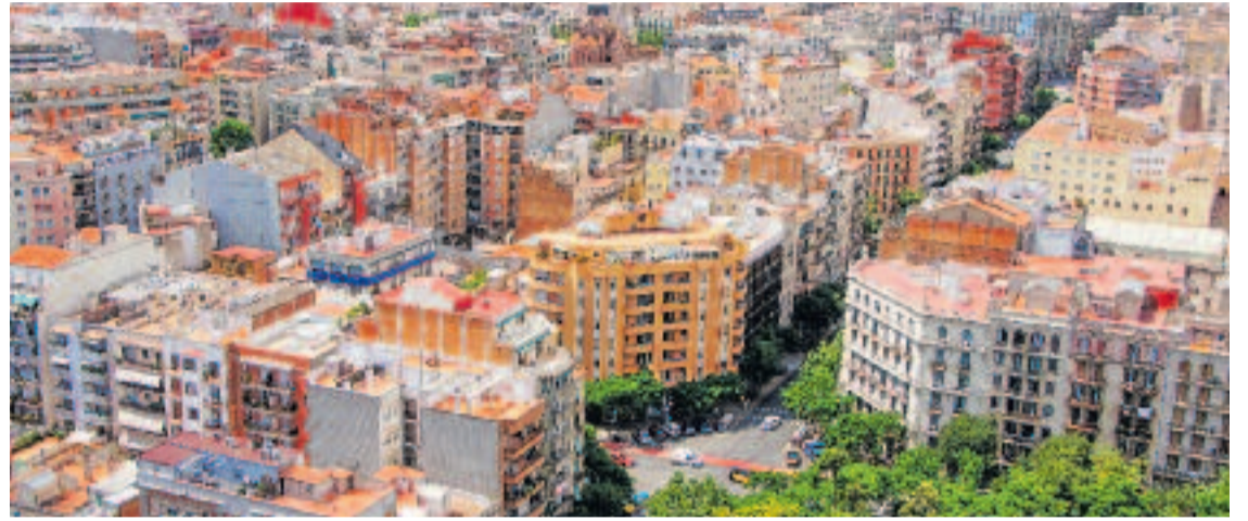
Els estrangers que tenen pisos a la Sagrada Família s'han multiplicat per cinc els últims quinze anys.

Aquest fet és una de les cares de la crisi de l'habitatge actual. Entitats i sindicats denuncien la falta de pisos públics i demanen la regulació de compra d'e-