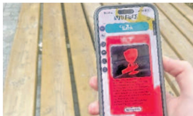
L'aplicació permet fer tres rutes pel barri.

Mitjançant una aplicació i codis QR repartits per diversos espais, els participants han pogut recórrer tres rutes que combinen elements físics i digitals per descobrir equipaments culturals i comerços. Malgrat que la campanya s'ha donat per finalitzada, l'aplicació es mantindrà activa i es podrà continuar gaudint de les rutes.