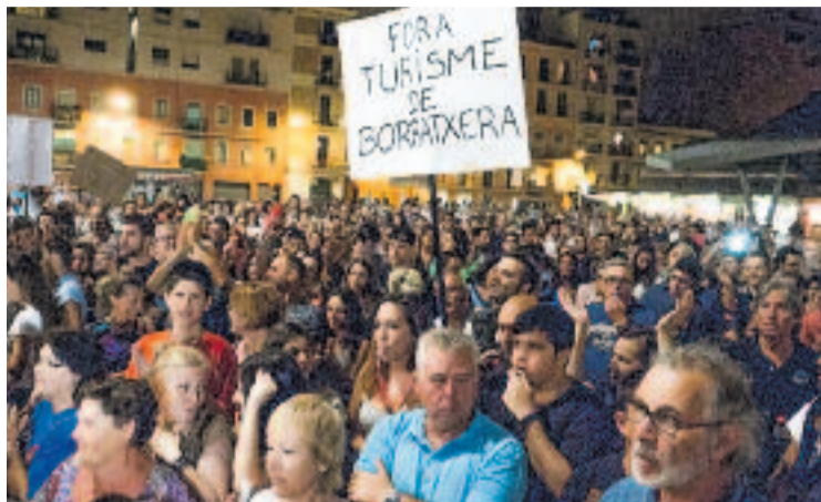
Les rutes per emborratxar-se es prohibiran al juny.

A banda dels problemes de convivència, la mesura també ataca el consum de risc d'alcohol que afecta espais públics concrets, especialment en zones tensionades, com els eixos verds o en zones de molts locals d'oci, com l'entorn d'Enric Granados.