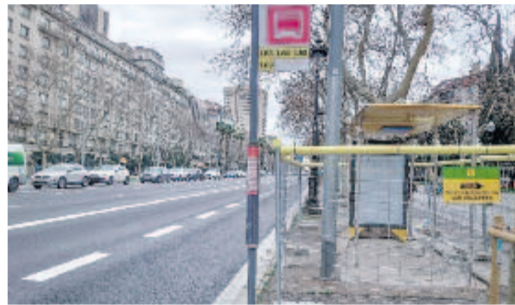
Cua a la Diagonal pel nou tall del carrer Urgell.

Amb tot, Eixample Respira, en declaracions a Betevé , ha demanat que el nou carrer d'Urgell tingui dos carrils bus, un per sentit.