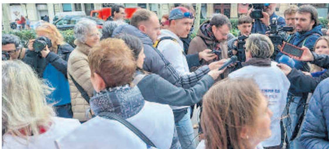
La Coordinadora de Familiars de Residències 5+1 atén als mitjans durant la protesta.