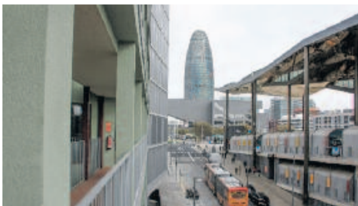
Les vistes des dels pisos públics de l'Illa Glòries.

Tot i que encara no ha finalitzat el període de resolució d'al·legacions, l'Ajuntament calcula que més de 10.000 ciutadans participaran en el procediment. Ho ha explicat la tinenta d'alcaldia d'Urbanisme,