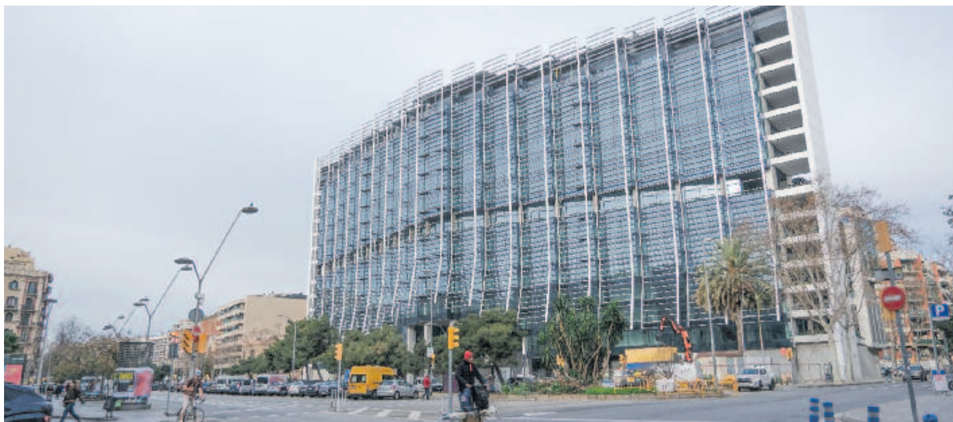
L'Edifici Estel ja està pràcticament enllestit.