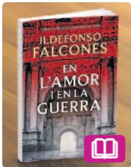
En l'amor i en la guerra Ildefonso Falcones

Es tracta de la tercera entrega de la saga de novel·la històrica Lesglésia del mar . La trama se situa al 1442 i explica com el net del protagonista del primer llibre, Arnau Estanyol, serveix el rei d'Aragó en la conquesta de Nàpols. Però durant la seva absència, els enemics de la família ataquen la seva fillastra a Barcelona, amb conseqüències devastadores per a tothom.