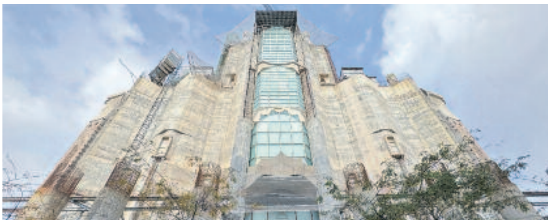
L'estat actual de la façana de la Glòria.

Però els veïns de la zona assenyalen especialment els responsables de la Sagrada Família. "Sembla que estiguin per sobre