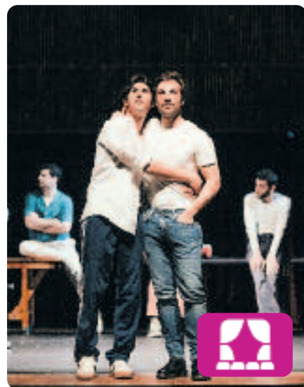
L'herència Matthew López

L'obra, inspirada en la novel·la Howards End , d'E. M. Forster, parla sobre com és ser un jove gai a Nova York una generació després del moment àlgid de la crisi de la sida. L'espectacle, que es pot veure al Teatre Lliure de Montjuïc fins al 16 de març, està dividit en dues parts que es poden veure en dies alterns, o bé seguides en format marató els caps de setmana.