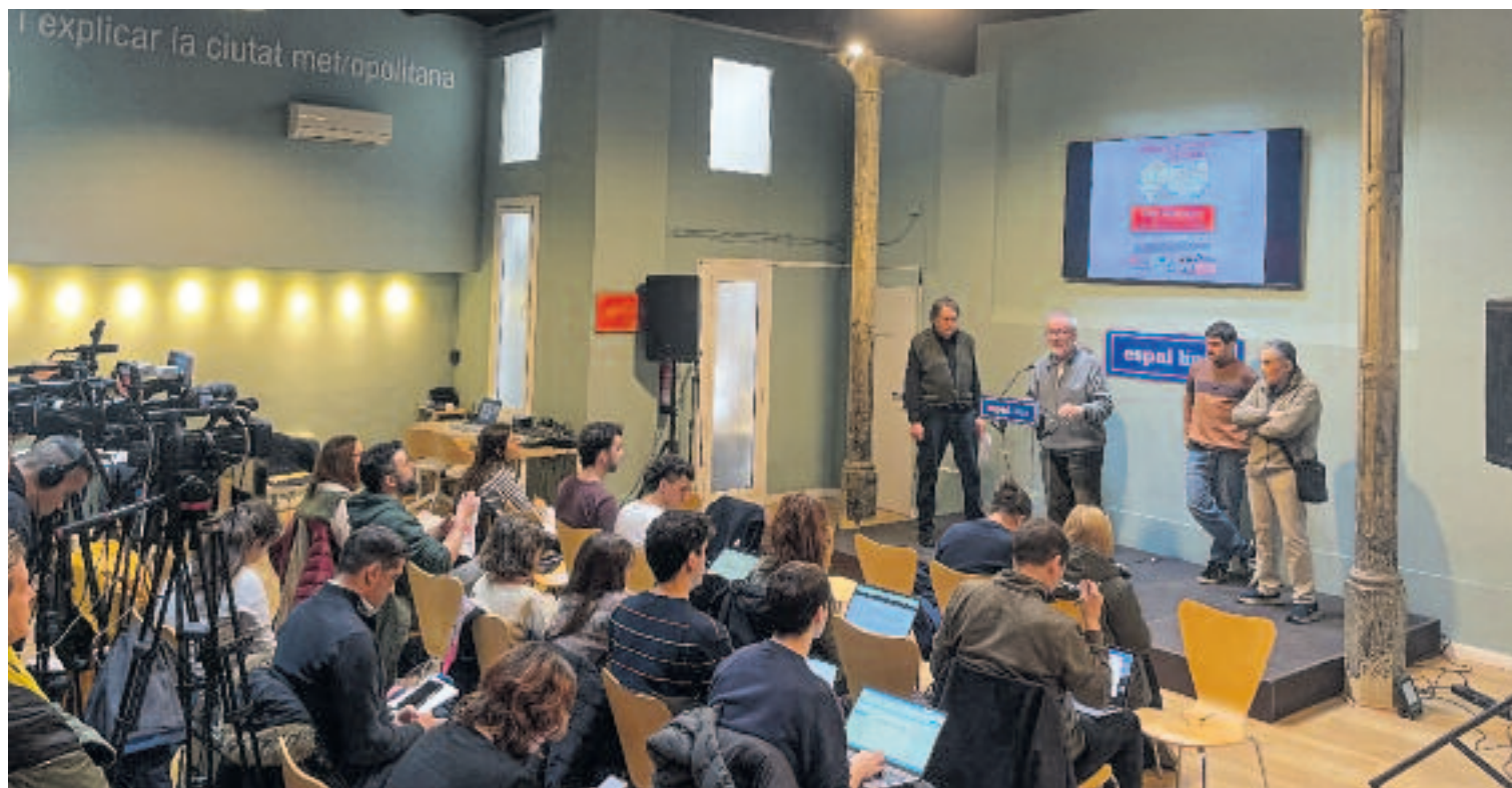
La presentació a l'Espai Línia de l'informe veïnal sobre l'habitatge va causar una gran expectació mediàtica.

I no es tracta només de pisos, diuen aquests veïns, sinó que la situació del mercat de l'habitatge també farà tancar una residència de gent gran. “Les Sa-