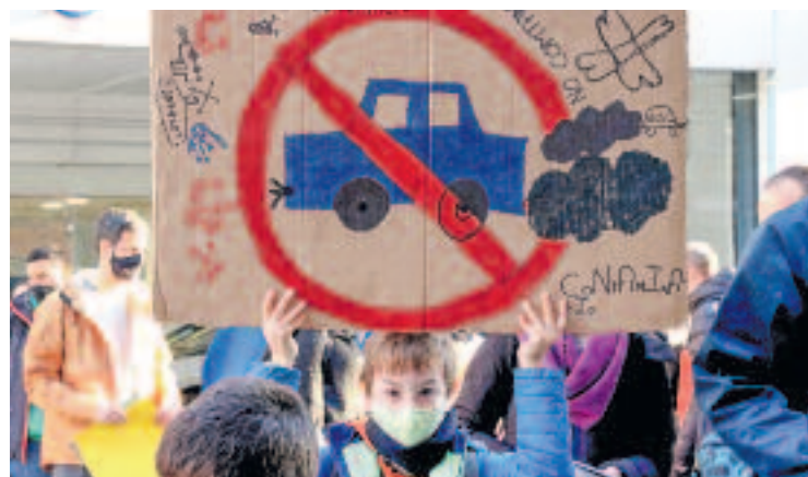
Un nen protesta contra els cotxes a l'entorn escolar.

Finalment, la plataforma ha exigit un compromís ferm des de les administracions públiques i la consolidació d'una inversió estructural.