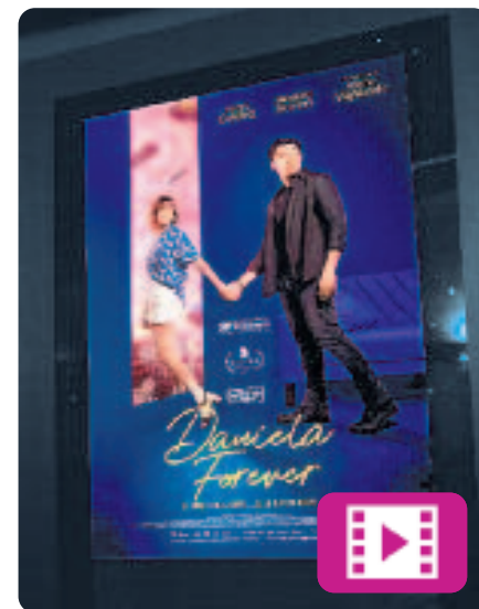
Daniela Forever Nacho Vigalondo

El film narra la història de Nicolás i de la pèrdua de la seva nòvia Daniela. Arran de l'incident, és convidat a formar part d'un assaig clínic que li permetrà controlar els seus somnis. Amb l'objectiu de poder somiar amb la seva xicota cada nit, accepta l'experiment. El que no sap és que corre el risc de perdre's per sempre en els seus somnis.