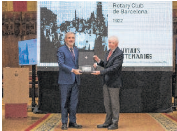
L'alcalde i el president del Rotary Club de Barcelona.

Han format part d'aquest club noms il·lustres. Expressi-