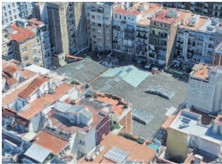
Imatge aèria de les teulades amb amiant.

La coberta de la finca es va fer durant els anys 50, una època en la qual les teulades de fibrociment de la marca Uralita eren molt habituals. La retirada d'aquest material s'ha de fer amb una cura extrema perquè quan s'inhala la pols de l'amiant es poden patir malalties greus