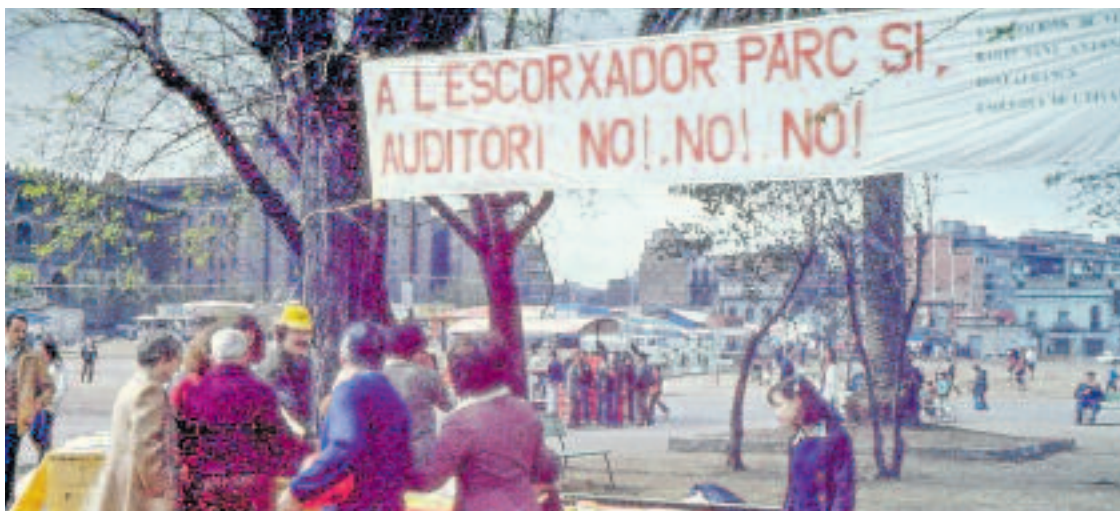
Manifestació per convertir l'antic escorxador en un parc –l'actual Joan Miró– per al barri.

El de la Model, però, és només un exemple dels projectes que l'associació lluita ara i lluitarà els pròxims anys. "Estem al peu del canó més que mai. Si volem viure al barri no podem deixar que ens expulsin, així que la lluita per l'habitatge és el camí per assegurar-ho", explica el portaveu. Riu afegeix que l'altre gran repte del futur és la mi-