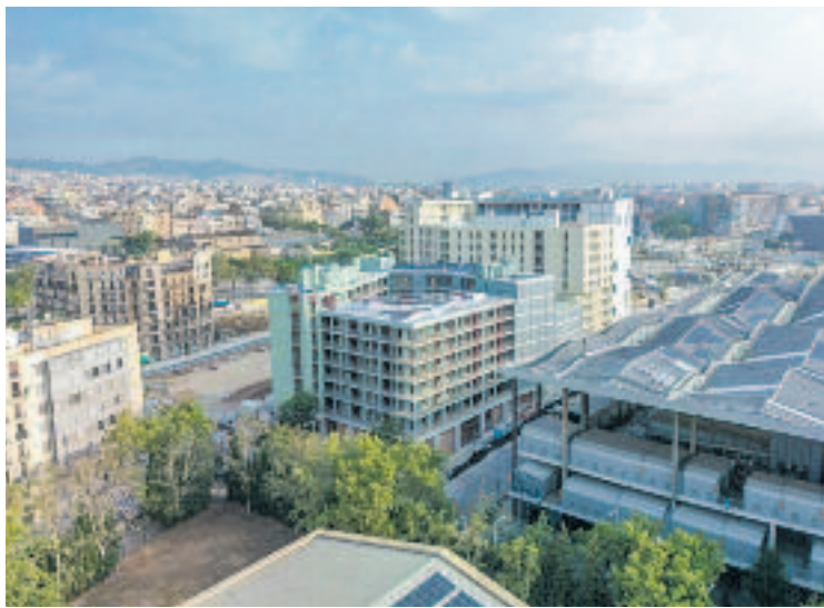
El bloc de pisos de protecció oficial de l'Illa Glòries.

Per donar més detalls sobre el projecte, l'Ajuntament ha organitzat una trobada amb els arquitectes responsables de l'o-