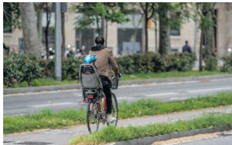
Un ciclista amb un infant pels carrers de l'Eixample.

Les actuacions previstes durant els pròxims mesos es faran a la majoria dels districtes de la ciutat i suposaran la construcció de 12,4 quilòmetres de nous carrils bici i se'n milloraran 9,4 més. Per exemple, al barri de la Sagrada Família, es faran millores al del carrer Provença.