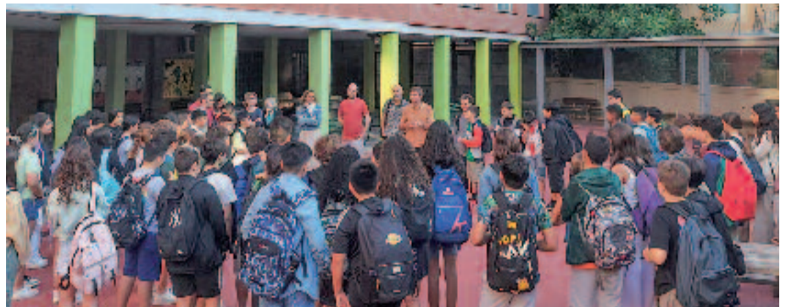
Alumnes i professors de l'Institut Fort Pius en l'acte d'inici del curs.

Més enllà de la gresca i les activitats d'aniversari, els 40 anys del centre també serveixen per fer balanç de la feina feta durant totes aquestes dècades i de la que queda per endavant. Una bona oportunitat per fer-ho serà la jornada de retrobament d'exalumnes i professors del 22 de març. "Obrirem l'institut, ensenyarem com ha canviat i ens convertirem en un espai de trobada", explica