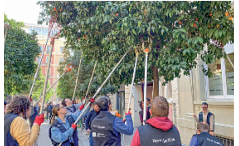
La recollida de les taronges a l'Eixample.

La recollida als passatges de Domingo i Mercadé ha estat una de les més destacades de la cinquena edició del programa Barcelona Espigola, que enguany ha arribat a set districtes de la ciutat. La iniciativa, impulsada pel programa Mans al Verd i dinamitzada per la Fundació Espigoladors, fomenta l'aprofitament alimentari i la gestió compartida dels espais verds amb la ciutadania.