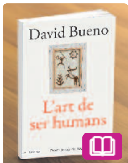
L'art de ser humans David Bueno

Es tracta d'un assaig que demostra com les arts són una expressió de l'essència de cada persona i, alhora, una eina imprescindible per a l'aprenentatge i el creixement humà. Cada capítol s'endinsa en un aspecte diferent, com la manera en com es percep l'art en el cervell, l'impacte emocional de la música o l'expressivitat del teatre i la dansa.