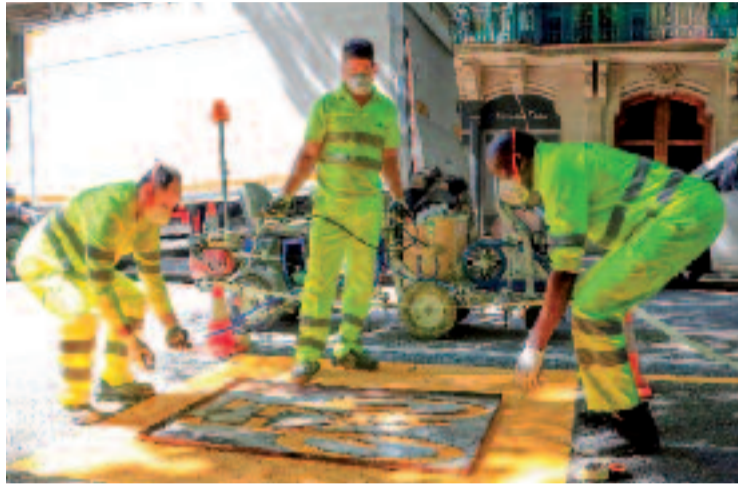
Treballadors pinten una senyal de bici al carrer.

Inicialment, la instal·lació del carril bici estava prevista per al 2022 amb l'objectiu de garantir una connexió còmoda i segura entre Ciutat Vella i l'Eixample. No obstant això, el projecte es va posposar per estudiar-ne millor la viabilitat, a causa de la complexitat circulatoria de la zona. A més, la presència de parades de transport públic i l'impacte de les obres de la Rambla han estat factors determinants per retardar-ne la