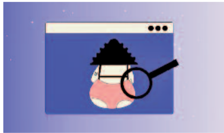
La sexualitat en el món digital és un gran repte social.

L'activitat, que està dirigida a famílies i educadors, és gratuïta, però cal inscripció prèvia, que està disponible des del 10 de febrer. Les persones interessades poden apuntar-s'hi a través del web del centre cívic, presencialment o trucant directament a l'equipament.