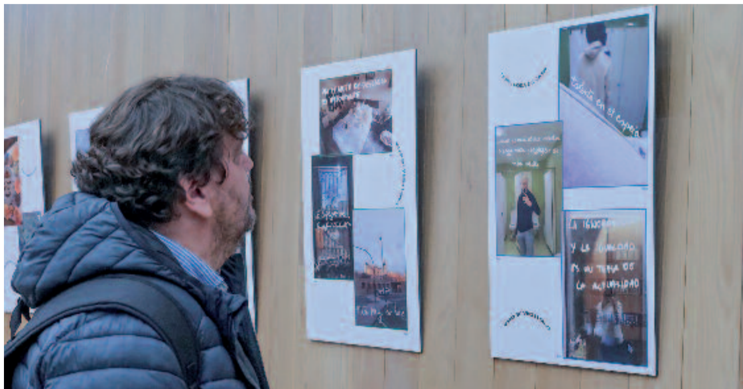
Els joves que protagonitzen l'exposició van estar fotografiant el seu dia a dia durant mig any.

Els perfils dels joves que han participat en l'exposició són força diferents entre si. D'edats dispars, gèneres oposats i orígens diversos, d'entrada podria