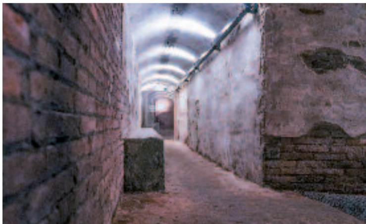
A Barcelona hi ha 1.400 espais que es consideren refugis.

L'expert, però, insisteix a dir que la seva conferència servirà per conèixer com era la construcció de refugis i per desmentir que "un cop vist un refugi, vistos tots".