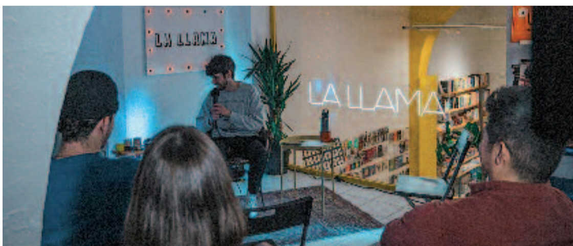
La botiga organitza actes i sessions humorístiques per a comedians emergents.

El més sorprenent és que el festival, que se celebra el març i encara no han anunciat el cartell, ja hagi venut gairebé totes les entrades. "Hem aconseguit que la