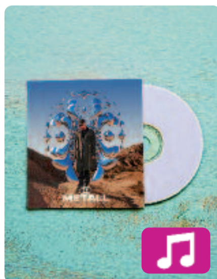
Metall Senyor Oca

En aquest nou disc, l'artista convida l'oient a un univers sonor relacionat amb el metall. De fet, les seves lletres reflecteixen les característiques d'aquest material, com per exemple la duresa, la brillantor i la resistència. El mateix Senyor Oca defineix l'àlbum, que consta de 12 cançons, com un treball fet "amb passió, compromís i col·laboració".