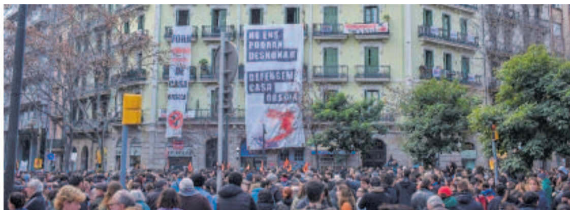
Finalment, l'Ajuntament comprarà la Casa Orsola.

Així doncs, l'operació farà que tots els llogaters que hi ha a l'edifici s'hi puguin quedar i que els habitatges, nou dels quals ara estan buits, es passin a llogar amb criteri social. "Es tracta d'una operació innovadora, extra-