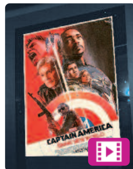
Capitán América: Brave New World Julius Onah

Es tracta de la quarta entrega d'un dels herois més destacats de l'univers Marvel. En el nou film, el Capitán Amèrica es troba enmig d'un incident nacional, amb el president dels Estats Units involucrat. Per salvar el país i també el món sencer haurà de descobrir l'origen del complot global que s'està coent per acabar amb tot.