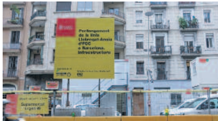
Cartell de les obres a la cruïlla de Consell de Cent i Urgell.

A la mostra també figuren les obres de fotògrafs destacats com Pau de la Calle, Elena Bulet, Eva Parey o Bruna Casas.