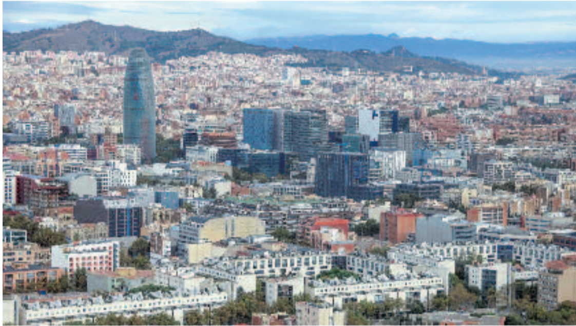
Barcelona ciutat és un dels punts més sorollosos de la metròpoli.

» La contaminació acústica és una de les grans problemàtiques de la ciutat i la regió metropolitana » A Barcelona, el 57% de la ciutadania està exposada a escales de soroll perjudicials per a la salut