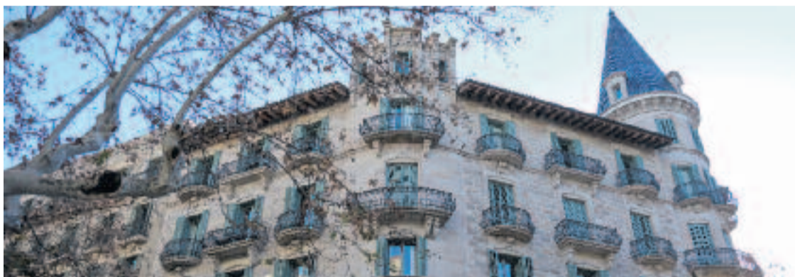
La Generalitat va vendre la Casa Burés al grup britànic Europa Capital per 18,8 milions d'euros.

Després de la seva adquisició per part d'Europa Capital, la Casa Burés va ser rehabilitada per fer-hi 29 pisos de luxe, amb superfícies que van des dels 100 fins als 500 metres quadrats. La rehabilitació va respectar els elements