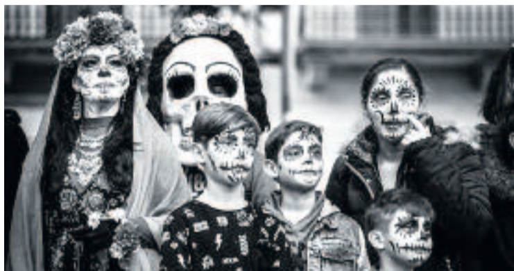
Una de les imatges que han format part del Clic.

Aquest reportatge, guanyador d'un dels premis del concurs del