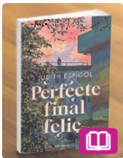
Perfecte final feliç Judith Espígol

Aquesta novel·la narra la història de l'Olivia, una jove que ha tancat la porta a l'amor des que la seva exparella la va deixar plantada a l'altar. Amb tot, les coses canvien quan el germà de la seva millor amiga torna a la ciutat. No té més remei que oferir-li una habitació al seu pis, fet que desencallarà una bonica i sobtada història d'amor entre tots dos.