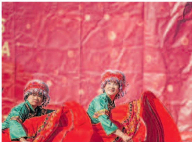
L'Any Nou Xinès és tot un espectacle per a la vista.

Durant tot el dia, el passeig Lluís Companys acollirà espectacles de cultura tradicional xinesa, a més d'una fira gastronòmica i tallers per a totes les edats. A les 12 h començaran les actuacions principals a l'escenari central sota l'Arc de Triomf.