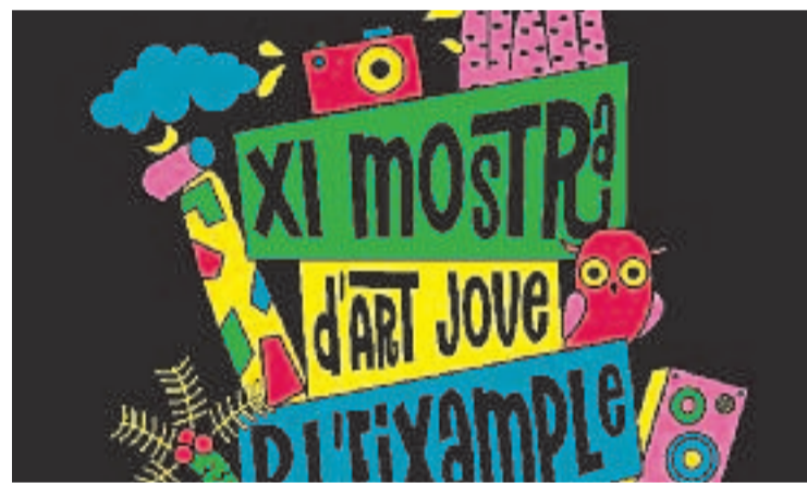
El cartell de la Mostra d'Art Jove de l'any passat.

El jurat valorarà especialment la qualitat, la idea i la coherència amb els conceptes proposats. Els premis es lliuraran durant l'Eixam 2025, en un acte que reconeixerà el talent dels joves artistes de l'Eixample.