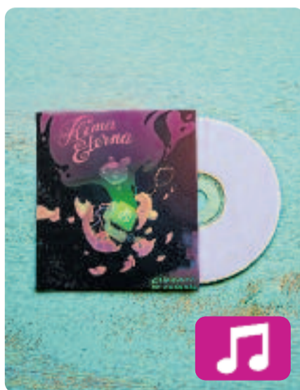
Flema eterna Chaqueta de Chándal