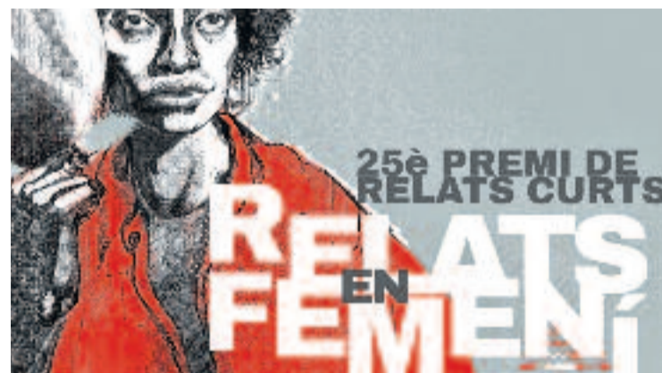
El cartell del concurs de relats.

meten als artistes Z a interpretar la seva música en directe, però també explicar les peces i els processos creatius, una experiència enriquidora tant per als músics com per al públic. A la resta de la ciutat també se celebraran altres concerts gratuïts.