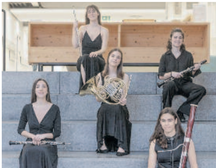
El grup Casiopea Quintet, que actuarà al Centre Cívic.

El dijous 27 de febrer es podrà gaudir del grup DJEM Quartet, formats a l'ESMUC, i el seu repertori farcit dels sons del jazz contemporani. Els encarregats de tancar el cicle al barri seran els components de Casiopea Quintet, del Conservatori Liceu, que el dijous 13 de març faran sonar les seves flautes, oboès, trompes,