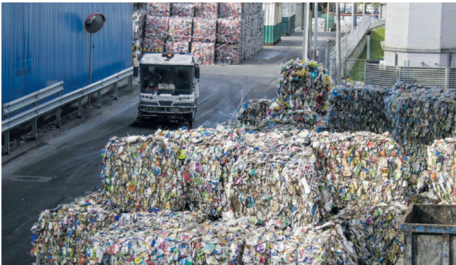
Muntanyes de residus a l'Ecoparc 2 de Montcada i Reixac.