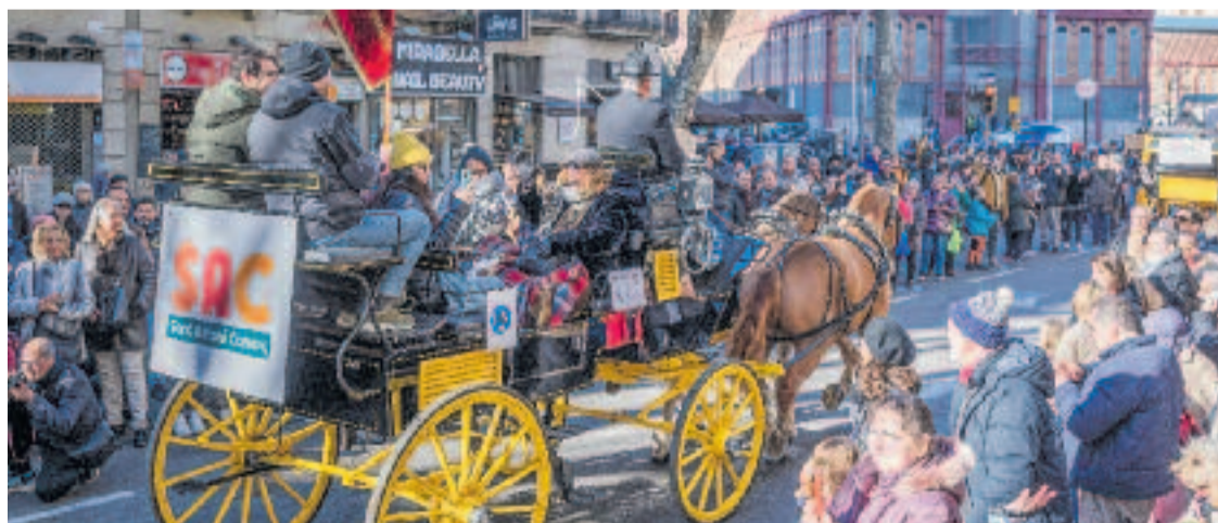
Un dels carros de cavalls a la desfilada de la festa dels Tres Tombs.

El darrer cap de setmana tancarà les festes amb una mas-