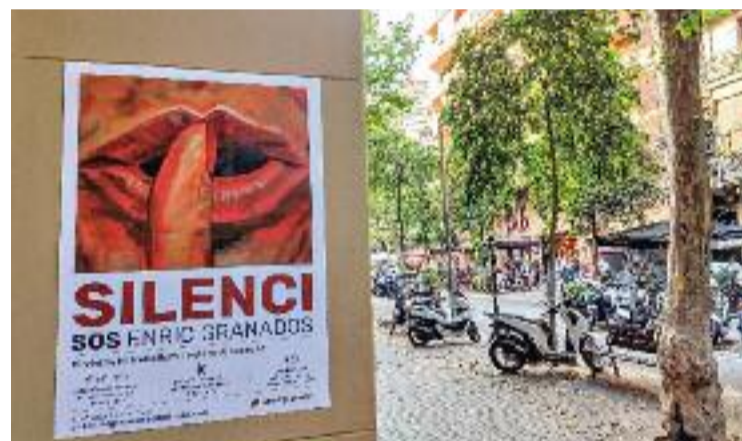
Cartell de protesta dels veïns d'Enric Granados.

I és que Badia es queixa que aquestes rutes de turisme de borratxera acumulen sempre entre 100 i 150 persones que van “de bar en bar, amb ‘xupito’ inclòs en cada parada i amb una hora de barra lliure a alguns locals”. És per tot això que esperen que amb la prohibició se solucioni un dels problemes que pateixen cada estiu al carrer Enric Granados.