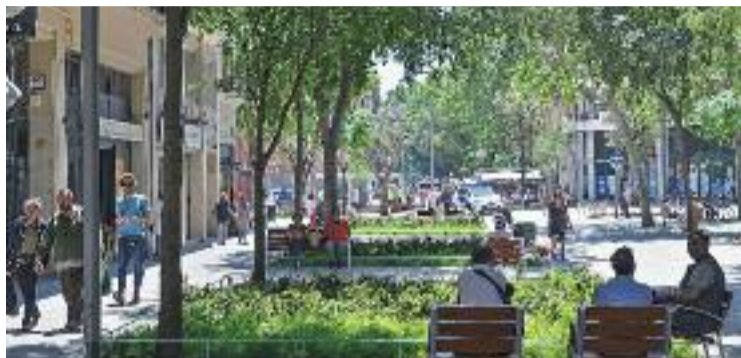
L'Ajuntament diu que mantenir els eixos verds és molt car.

L'anàlisi del funcionament dels eixos verds ha inclòs també la dinàmica del trànsit. A finals de juny i durant 15 dies es va instal·lar un radar pedagògic a Consell de Cent per obtenir dades objectives d'excessos de velocitat. L'aparell va mostrar que la velocitat mitjana és de 20 quilòmetres per hora i que