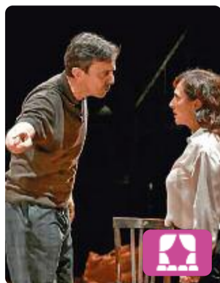
Tots ocells Wajdi Mouawad

L'obra explica la història d'amor entre una jove àrab i un jove alemany jueu que es veurà obligat a enfrontar-se a la seva família i a confrontar les seves creences religioses. Arran del seu enamorament, l'argument repassa temes com la frontera entre l'amor i la família, l'odi i els prejudicis. Es pot veure al Teatre La Biblioteca de Barcelona fins al 31 de juliol.