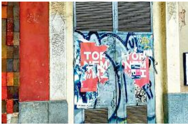
Les portes de la botiga abans d'obrir.

Malgrat que la normativa municipal no permet més punts de