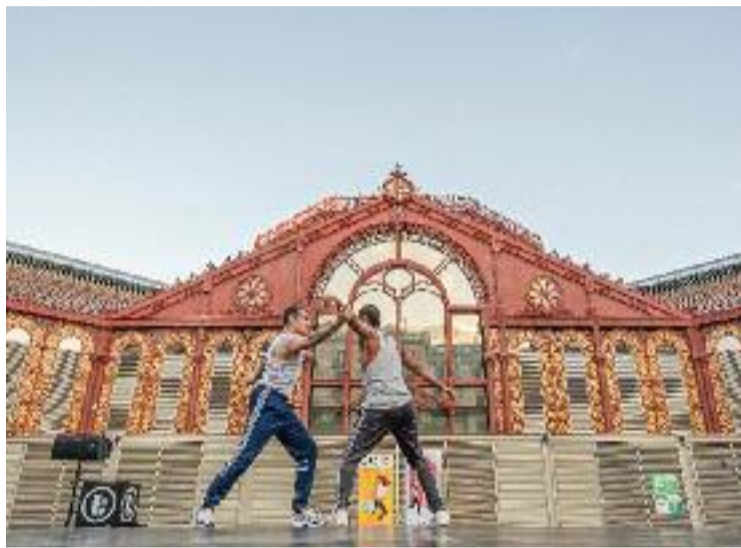
Un dels espectacles del Tangent que s'han fet a Sant Antoni.