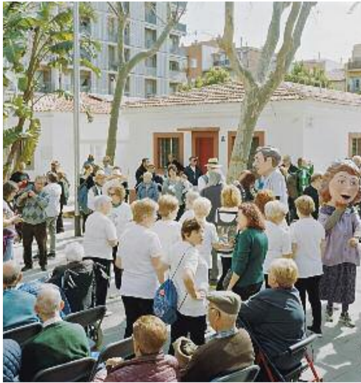
Un dia de celebració a les Cases Barates i una imatge de la complicada realitat social que sovint es viu al Raval.

El projecte de Civera explica tant la persistència dels llocs esmentats com la seva desaparició, així com el reallotjament dels veïns i la recent creació del Museu de l'Habitatge. Per tant, les imatges de Can Peguera mostren l'actual persistència i restauració de la zona a partir de les reivindicacions veïnals, ja que com apunta Civera, "la idea de comunitat supera la incomoditat de l'habitatge". En canvi, les fotografies del Bon Pastor mostren situacions de desmantellament, i