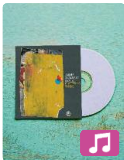
Fluttering Wings Jaume Llobart

El guitarrista Jaume Llobart, una de les figures més destacades del panorama jazz a Catalunya, ha publicat el seu tercer disc juntament amb el seu propi sextet. Amb melodies alegres i els sons del saxo, la guitarra, el clarinet baix, la percussió i el baix, el reconegut músic presenta un total d'onze cançons fresques i innovadores, amb ritmes complexos, al més pur estil jazz.