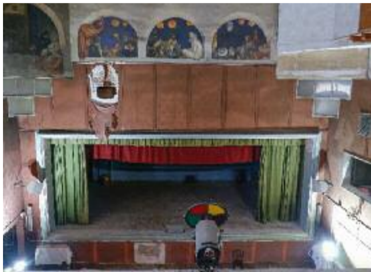
El futur del Taller Masriera es va desencallant.

La presentació de les bases del concurs és el resultat de mesos de negociacions entre l'Ajuntament i la Plataforma Masriera que està integrada per l'Associació de Veïns i Veïnes de la