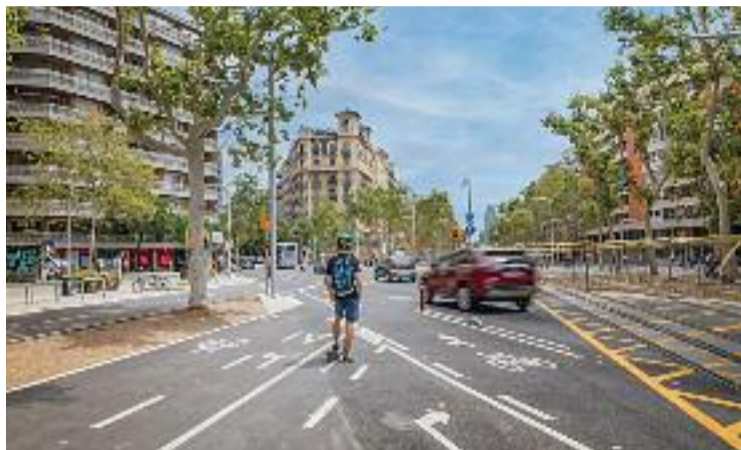
L'avinguda Diagonal en el tram reformat.

Aquestes millores busquen fomentar el transport sostenible i oferir espais més segurs i agradables per als vianants i els veïns, segons l'Ajuntament. De fet, des de l'Associació de Veïns del Fort Pienc celebren els re-