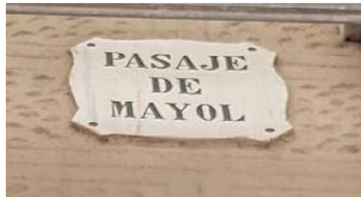
El passatge Maiol, un dels més antics del barri.

El passatge Maiol és, de la Sagrada Família, un dels que conserva més edificis originaris, cosa que li permet mantenir la identitat històrica i de barri.