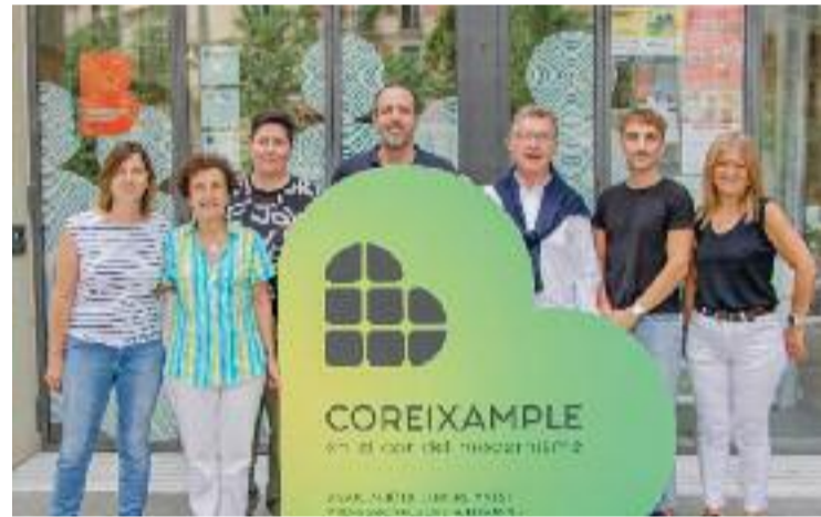
La nova Junta de l'entitat de comerciants de la Dreta.