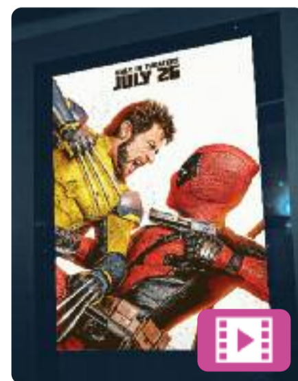
Deadpool i Lobezno Shawn Levy

Es tracta del tercer lliurament de la saga Deadpool . Explica la història d'amistat entre aquest heroi i Lobezno, quan aquest últim està greument ferit. Deadpool viatja en el temps per curar-lo i formar un equip per acabar amb un enemic comú. Ryan Reynolds i Hugh Jackman són els protagonistes d'aquest film de l'Univers Marvel.