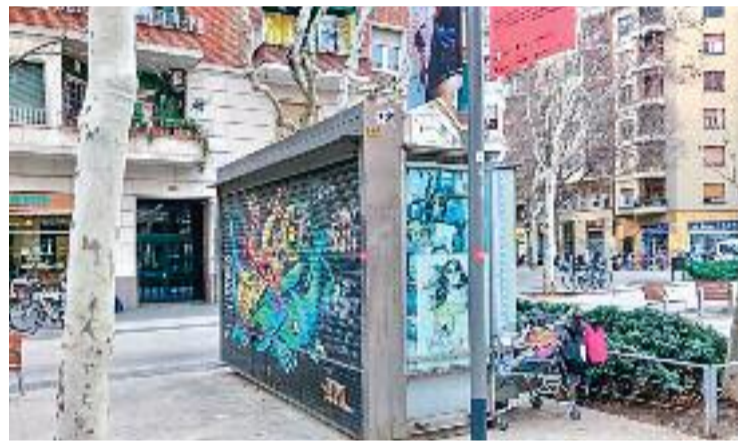
Veïns i comerciants fa temps que demanen la retirada del quiosc.

Així, els veïns van recollir més de 400 signatures per demanar a l'Ajuntament que retirés el quiosc. Un fet que, en principi, es farà realitat al més aviat possible, segons han declarat a Be-tevé fonts del consistori.