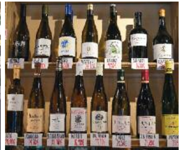
Queviures Serra ofereix una gran varietat de vins.