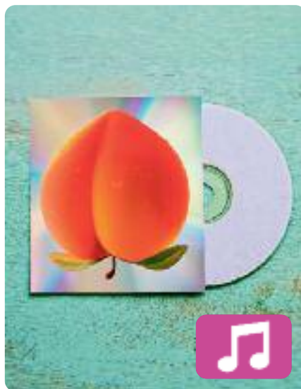
Fruit del deliri Oques Grasses

Oques Grasses, un dels grups per excel·lència de la música catalana, ha publicat el seu nou disc després de l'èxit de la gira amb el darrer àlbum, A tope amb la vida . Es tracta d'un conjunt d'onze cançons d'estil pop, però amb nous tons urbans i electrònics que els allunyen dels seus treballs anteriors. Un dels temes centrals del disc és el desamor.