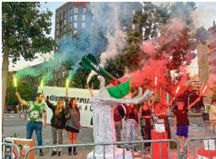
Les falles van tenir un perfil reivindicatiu. Foto cedida

La jornada va continuar amb el dinar popular, que va ser pae-