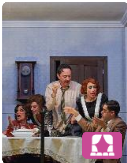
Els criminals Ferdinand Bruckner

El Teatre Nacional de Catalunya presenta aquesta obra sota la direcció de Jordi Prat, que planteja una història que gira al voltant de diversos personatges que comparteixen edifici i que han comès un seguit de delictes que posaran al descobert els errors de la justícia i els límits de les administracions amb l'ús i l'abús de poder. Es podrà veure fins al 22 de maig.