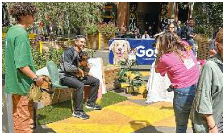
Espai per a fotos de l'anterior Sant Antoni Pelut.

I com a bona festa, a Sant Antoni Pelut no hi podien faltar la música i la gresca. Humans i animals podran gaudir de la música en directe dels disjòqueis durant la jornada.