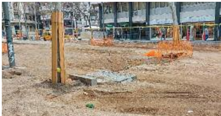
Estat actual de la ronda a la plaça del Pes de la Palla.