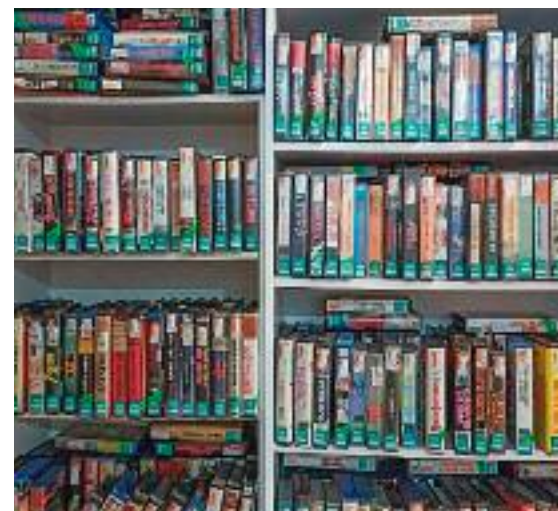
L'Autotracking, a l'esquerra, i la col·lecció de VHS de Video Instan, a la dreta.