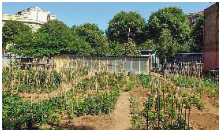
El barri ja té un hort urbà; ara el PDC en vol un de comunitari.

D'altra banda, el PDC també està organitzant una formació adreçada a famílies amb adolescents d'entre 12 i 14 anys. L'objectiu és facilitar un espai adreçat a les famílies que conviuen amb els adolescents i que volen "reflexionar, compartir i aprendre conjuntament al voltant d'aquesta etapa".