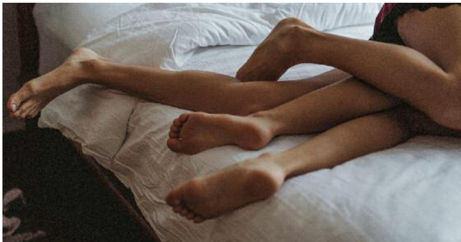
En el darrer any han crescut un 45% les agressions sexuals entre menors a l'Estat.

Això és el que està a l'abast de qualsevol persona que tingui accés a Internet, independentment de la seva edat. Segons la doctora Berta Aznar, que també és professora, investigadora i membre de Feministes de Catalunya, el porno que es consumeix avui dia, caracteritzat per ser totalment assequible, accessible, d'alta qualitat i especialment violent, humiliant i