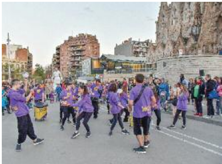
Imatge de la Festa Major del Poblet de l'any passat.

La lectura del pregó, un dels actes més destacats del programa,