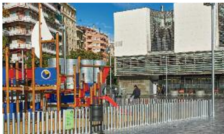
L'àrea de jocs de la plaça abans de la remodelació.

Amb les plaques es generaran uns 30.707 kWh/any d'energia, l'equivalent al consum de 10 llars i es reduiran les molèsties pel sol a un espai on no es poden plantar arbres.