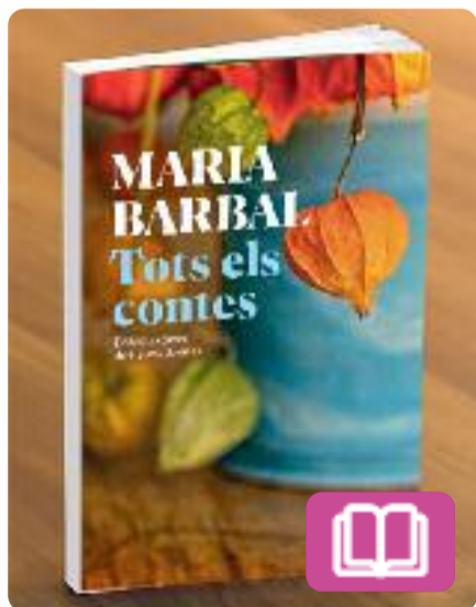
Tots els contes Maria Barbal

Aquest llibre aplega la totalitat dels contes escrits per Maria Barbal fins ara, tant els publicats en volums com els esparsos en publicacions periòdiques o en antologies temàtiques i, també, contes encara inèdits, que s'ofereixen en primícia. Tota la narrativa curta de qui ha destacat per damunt de tot com a novel·lista, però que sempre ha demostrat el seu talent per al conte.