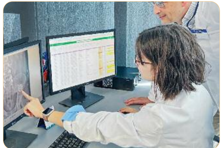
Físics mèdics d'Ascires revisen el cas d'un pacient amb dos neuroestimuladors i diverses fixacions a la columna.