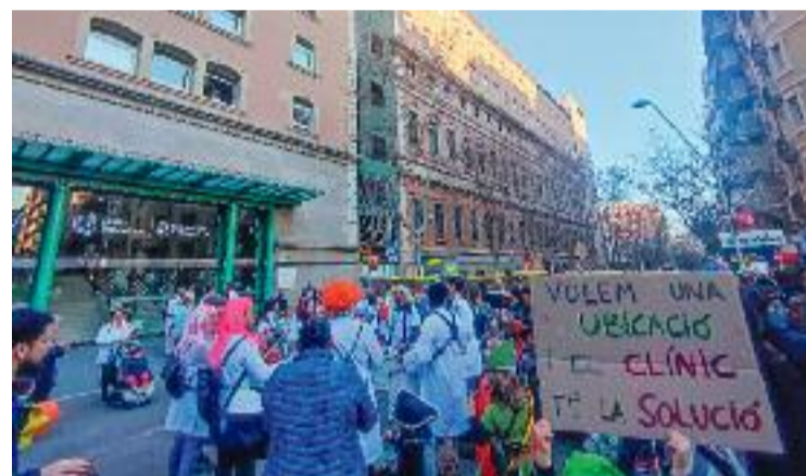
Una protesta de les famílies de l'Escola Entença, al febrer.