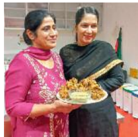
La gastronomia ha estat una de les protagonistes del festival.