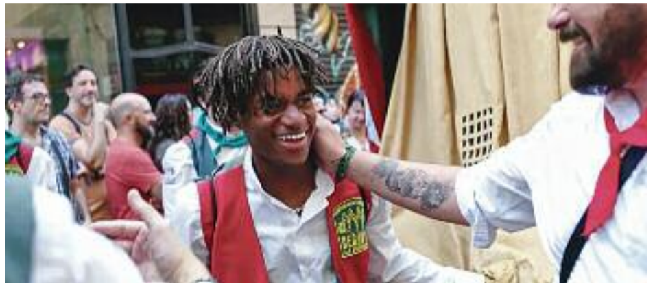
Els Gegants de la Pedrera i diversos integrants de la colla.