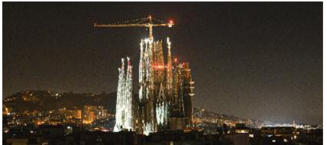
El dia 12 es van il·luminar per primer cop les torres dels Evangelistes.

L'encesa de les torres dels Evangelistes va anar precedida per la celebració d'una missa solemne oficiada pel nunci apostòlic Bernardito Auza i cocelebrada pel