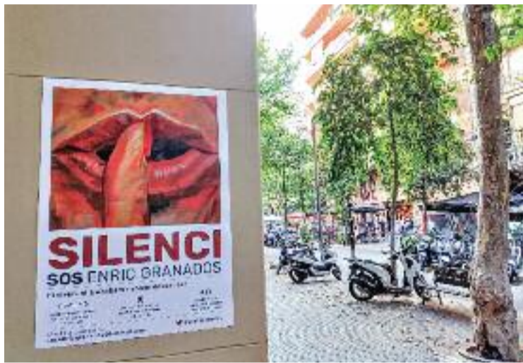
Imatge d'arxiu d'una pancarta demanant silenci.