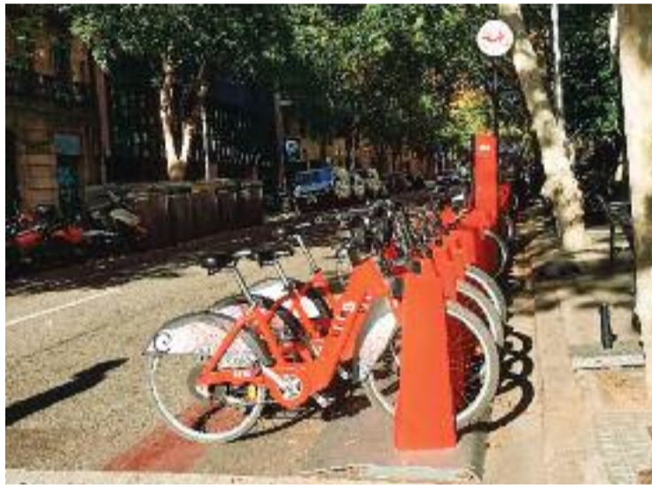
Una estació de Bicing al barri el primer dia de vaga.

Però anem a pams. Pel que fa a l'ampliació i millora del servei, es tracta d'una resposta a l'increment d'usuaris del Bicing. Segons el consistori, actualment, en un dia feiner, més de 60.000 persones es desplacen amb el Bicing, un terç més que el 2019. D'aquests desplaçaments, el 70% es fan amb bicicleta elèctrica. És per això que, al llarg del segon trimestre de l'any vinent, es començarà a incrementar el nombre de vehicles