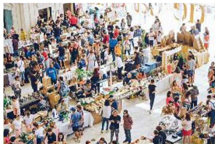
El festival es va celebrar el passat cap de setmana.

Amb tot, aquesta nova edició d'All Those Food Market va oferir diverses propostes de tallers gastronòmics. També hi va haver un programa dedicat a l'alimentació saludable, la meditació i autocura. I els més petits van poder gaudir d'activitats com ara aprendre a sembrar flors comestibles.