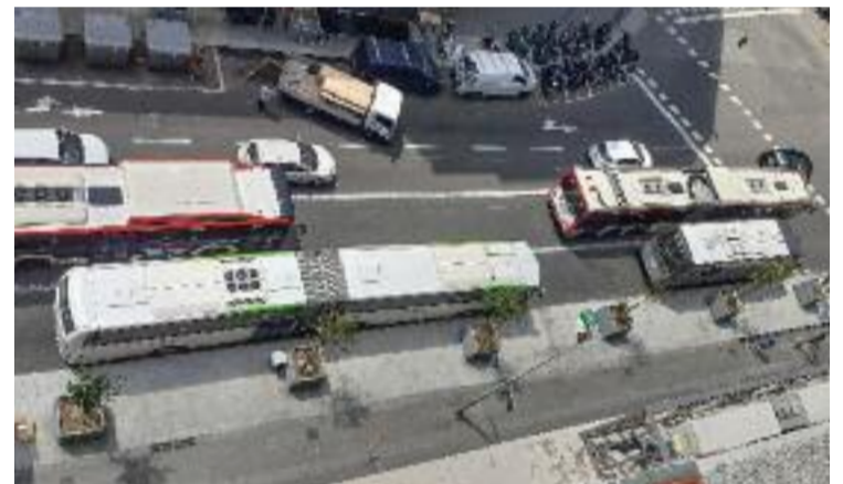
Autobusos acumulats a la ronda Universitat.

"L'altre dia vaig anar a l'estació de la Sagrera i estava buida, tenim tots els busos aquí", lamenta Armengou. En la passada Audiència Pública de l'Eixample, la plataforma SOS Ronda Universitat va exposar la seva queixa. Des del Districte els van dir que estaven "treballant per posar fi a les línies interurbanes amb parades a la via pública", tot i que "les concessions les dona la Generalitat".