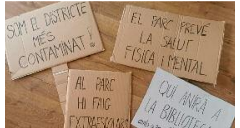
Pancartes per a la concentració d'aquest dijous.