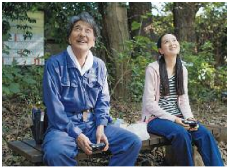
Un moment de 'Perfect Days', pel·lícula japonesa.

Així, l'Asian Film Festival inclou una extensió geogràfica del continent molt àmplia que va des d'Iran, l'Àsia Central amb països com Kazakhstan, Kirguïstàn, Uzbekistan, Afganistan,