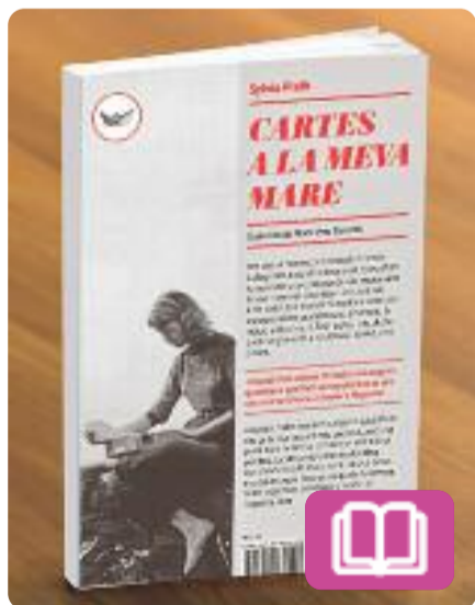
Cartes a la meva mare Sylvia Plath

Des que va començar els estudis a l'Smith College fins al dia de la seva mort, Sylvia Plath va mantenir una correspondència regular amb la seva mare i els seus éssers més estimats. A les cartes que escrivia hi explicava com vivia les experiències acadèmiques, amoroses, la relació amb el marit, Ted Hughes, i els dubtes que li sorgien com a escriptora i, també, com a mare.