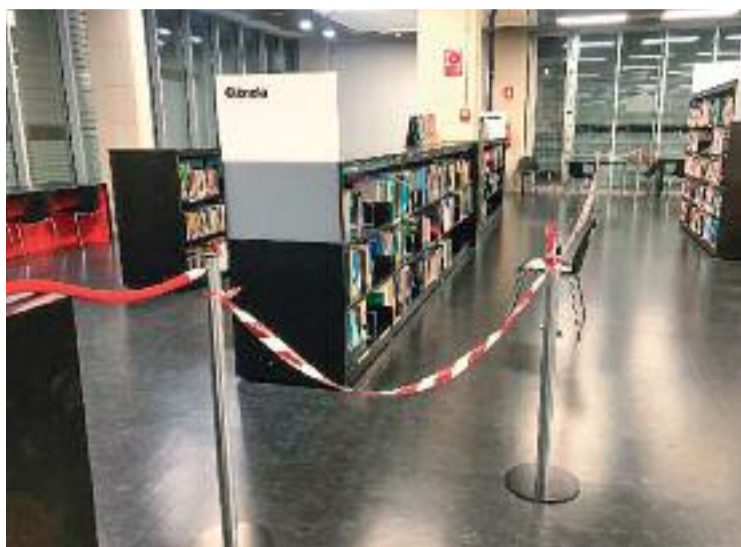
Un dels espais tancats pels desperfectes.

En el comunicat, l'assemblea insisteix a remarcar l'aparició de