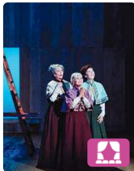
La nostra ciutat Thornton Wilder

En un teatre, la regidora presenta al públic la vila rural de Grover's Corners, a New Hampshire (els EUA), i els seus habitants: les famílies Gibbs i Webb, que són veïnes. Especialment l'Emily Webb i el George Gibbs, que aviat s'enamoraran i es casaran. Al llarg de dotze anys seguiran els canvis en la vida d'aquesta parella. Al Teatre Lliure de Montjuïc.