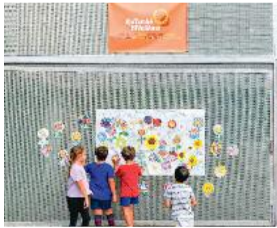
La manifestació a favor de la inclusió a l'Escola Fort Pienc i en Martí, un alumne del centre amb TEA.