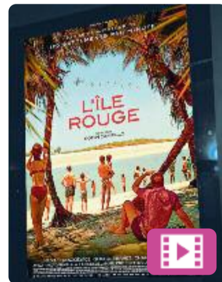
L'illa roja Robin Campillo

Principis dels anys setanta. El petit Thomas viu sota el colonialisme francès a Madagascar, en una de les bases aèries de l'exèrcit francès, on les famílies dels militars viuen els últims rastres del colonialisme. És un nen de deu anys que està molt influenciat per la lectura dels relats de la intrèpida heroïna Fantomette i observa el món amb fascinació.