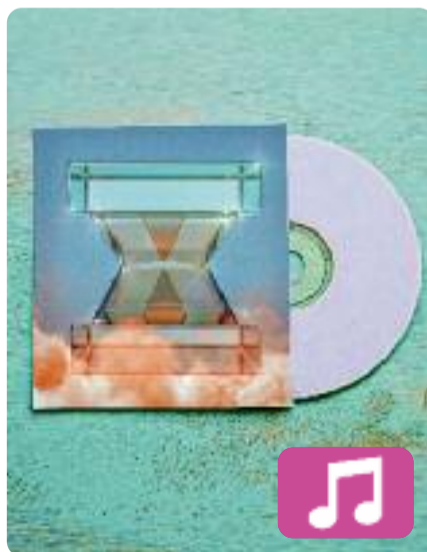
X si ens veiem en una altra vida 31 FAM

X si ens veiem en una altra vida és el quart àlbum del grup sabadellenc 31 FAM, un dels principals exponents de la música urbana catalana actual. En una entrevista amb l'ACN, els integrants de 31 FAM han reconegut que s'han sentit "discriminats" tant per cantar en català en alguns llocs de l'estat espanyol com per fer servir el castellà en alguns municipis catalans.