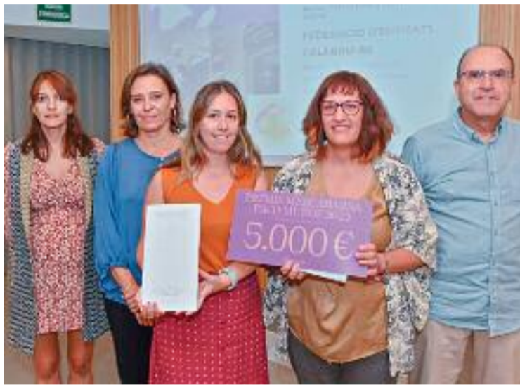
'Aprofita'm' rep el premi contra el malbaratament alimentari.

Un dels motius pels quals han rebut el premi, segons Mercabarna, és perquè l' Aprofita'm és "un bon exemple de com des d'un moviment veïnal i associatiu es poden buscar fórmules per resoldre els principals problemes de l'entorn més proper". El projecte va néixer el 2020 amb la intenció de construir formes més sostenibles i comunitàries de viure i relacionar-se sota una fórmula col·laborativa.