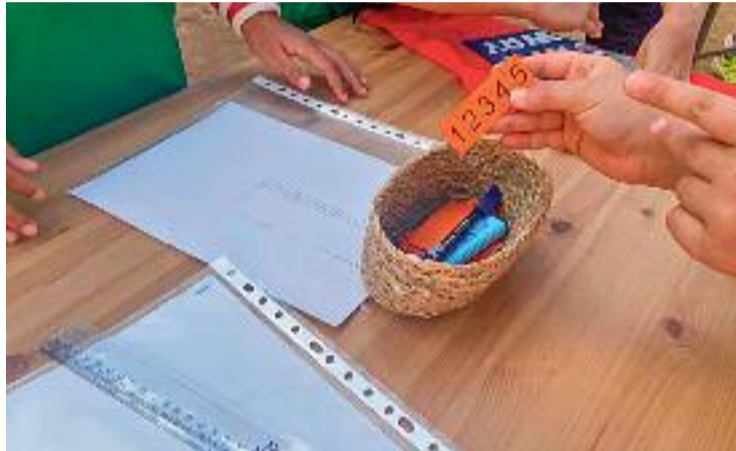
Alumnes de 5è participant en un mercat d'intercanvi de roba.

Núria Torrijos, mestra de 5è de l'Escola Entença, explica que un dels primers passos va ser la sensibilització. Així, en el marc del projecte, els alumnes van aprendre la quantitat de litres d'aigua que es gasten per fer uns texans o les condicions laborals en què es