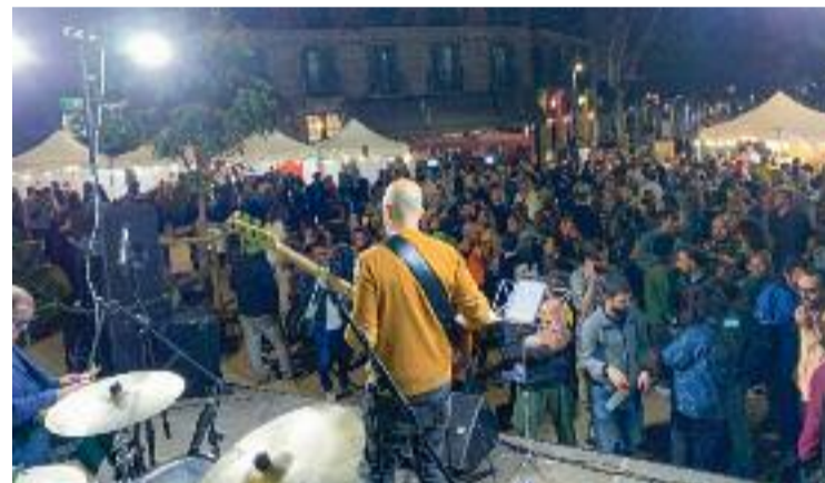
La 1a edició del Cor de Vi ha estat tot un èxit.

Amb tot, els membres de l'entitat afirmen que hi haurà segona edició després del primer èxit.