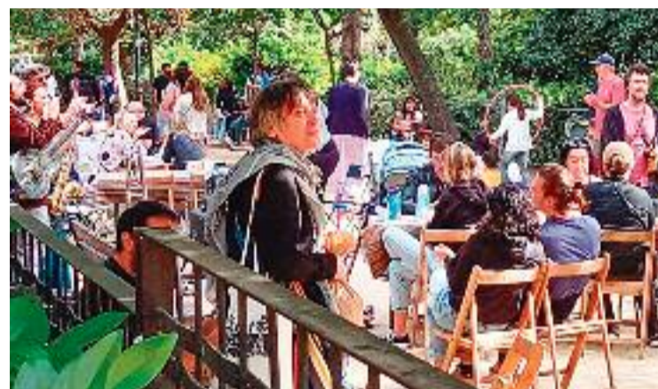
Un moment de la Festa Major de Tardor.

Amb tot, la Festa Major de Tardor del barri també va programar activitats durant el cap de setmana, com ara la Nit Jove, la Mostra de Comerç i els actes de cultura popular. Però una de les més destacades va ser el Mercat sense diners i el Mercat de Pagès, que el diumenge es van instal·lar a la plaça de la Sagrada Família.